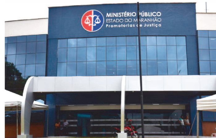
MPMA FAZ ORIENTAÇÃO PARA ATUAÇÃO PARA AUTORIDADES

O Governo do Maranhão e outros poderes públicos do Estado estão unidos para identificar e pedir a punição de autores de fake news sobre o coronavírus. Diversas notícias falsas vêm sendo espalhadas nas redes sociais, o que dificulta ainda mais a prevenção e o combate à doença.