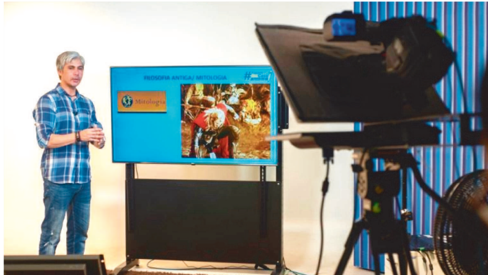
TV ASSEMBLEIA E AS RÁDIOS, ALEMA E TIMBIRA 1290 AM, TRANSMITEM AULAS

“Nesse momento delicado pelo qual passamos, de paralisação total em função da pandemia, essa iniciati-