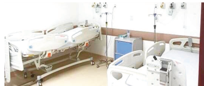
NOVOS LEITOS ESTÃO NO HOSPITAL MACRORREGIONAL

O Governo do Estado entregará, nos próximos dias, 10 novos leitos de UTI no Hospital Macrorregional Dr a Ruth Noleto, em Imperatriz. A entrega faz parte do conjunto de medidas de combate ao novo coronavírus (Covid-19) já adotadas pelo Governo do Maranhão. Os novos leitos serão exclusivos para tratamento de pacientes que apresentarem sintomas graves da doença. Os espaços somam-se a outros 12 leitos para tratamento de síndromes respiratórias que já existem na unidade de saúde, sendo 2 deles de isolamento.