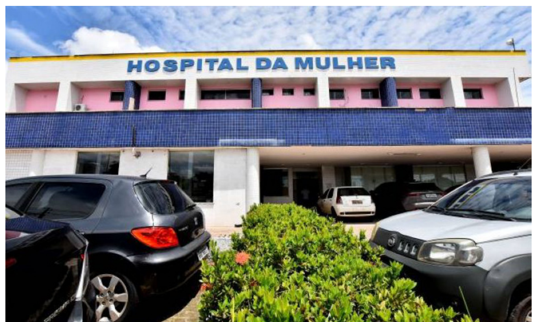
Hospital da Mulher é referência na rede municipal com leitos de retaguarda