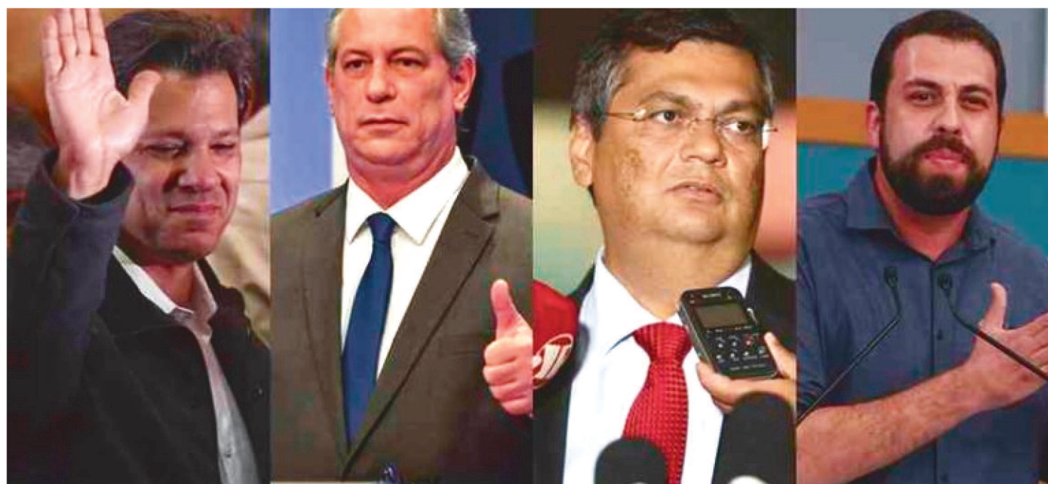
FERNANDO HADDAD, CIRO GOMES, FLÁVIO DINO E GUILHERME BOULOS ESTÃO ENTRE OS QUE ASSINAM O PEDIDO DE RENÚNCIA

Os principais políticos da esquerda, como Fernando Haddad (PT), Ciro Gomes (PDT) e Guilherme Boulos (PSOL), além do governador do Maranhão, Flávio Dino (PCdoB), assinaram um manifesto pedindo a renúncia do presidente Jair Bolsonaro. No documento, eles afirmam que o chefe do Executivo é um "presidente irresponsável" por não respeitar determinações de confinamento da Organização Mundial de Saúde (OMS) e do Ministério da Saúde na luta contra a pandemia de coronavírus.