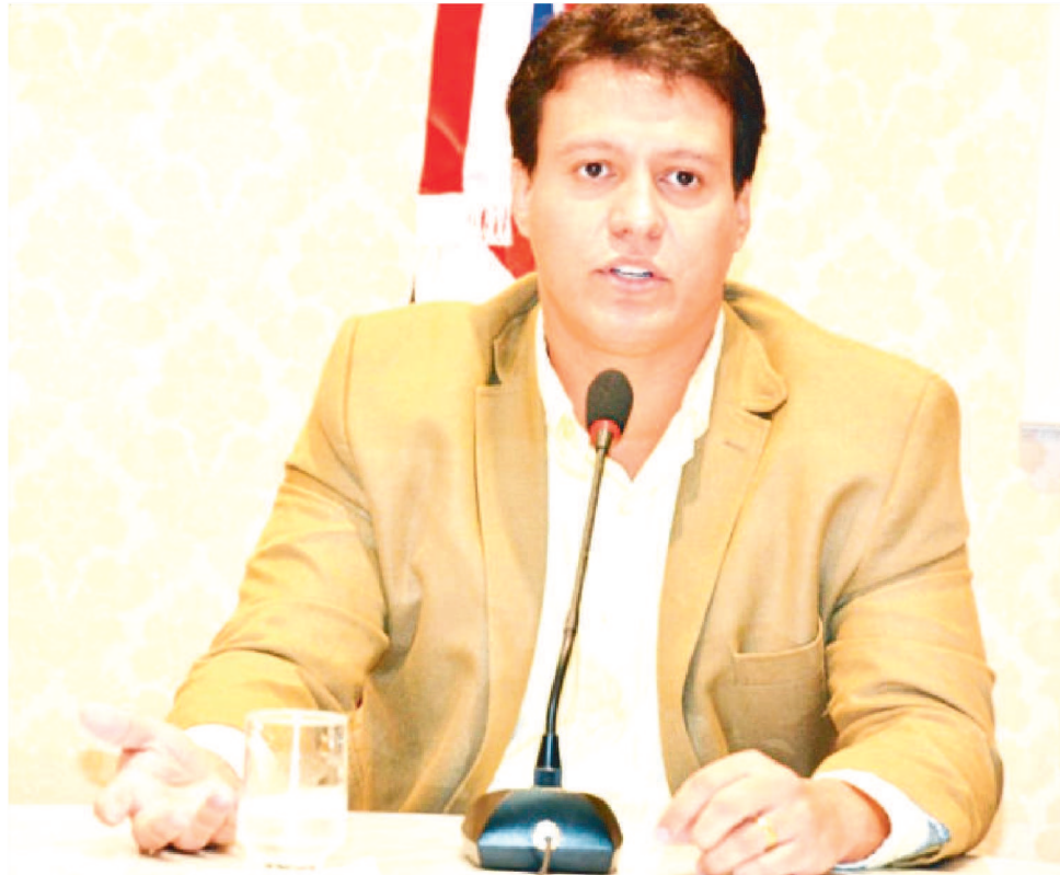
FELIPE CAMARÃO É O SECRETÁRIO DE EDUCAÇÃO DO ESTADO DO MARANHÃO

Segundo Felipe Camarão, depois de "mais uma decisão equivocada e sem alinhamento com os estados, o Conselho Nacional de Secretários de Educação se manifestou contra o calendário divulgado do ENEM". "Manifestamos no sentido de aguardar o final desse ciclo da pandemia e de suspensão das aulas para que sejam definidas as datas das provas do ENEM 2020. Solicitamos, ainda, a ampliação do prazo para as inscrições e que, este ano, diante da pandemia, se-