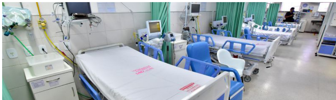
Prefeito Edivaldo vistoria unidade de referência no atendimento a pacientes com Covid-19

Hospital da Mulher estará pronto para receber pacientes na próxima semana e disponibilizará 53 leitos para tratar exclusivamente pacientes com novo coronavírus.