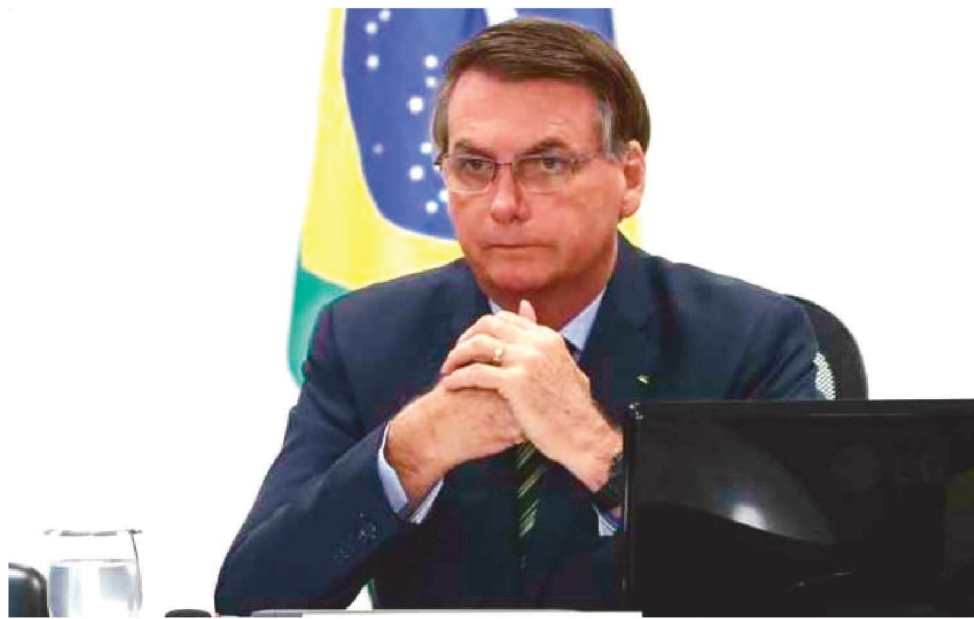
O AUXÍLIO EMERGENCIAL DE R$ 600 SERÁ PAGO AOS TRABALHADORES INFORMAIS

Questionado se o texto seria publicado ainda nesta 5ª feira no Diário Oficial, Bolsonaro respondeu: “Assinei ontem, estava aguardando outra medida provisória, porque não adianta dar um cheque sem fundo. Tem que ter o crédito”. E emendou: “Deve ser, pô. Você não pode... É uma burocracia enorme. Uma canetada minha errada é crime de responsabilidade. Dá para vocês [jornalistas] entenderem isso? Ou vocês querem que eu cave a minha própria sepultura? Vocês querem que eu cave minha própria sepultura? Eu não vou dar esse prazer para vocês!”, disse.