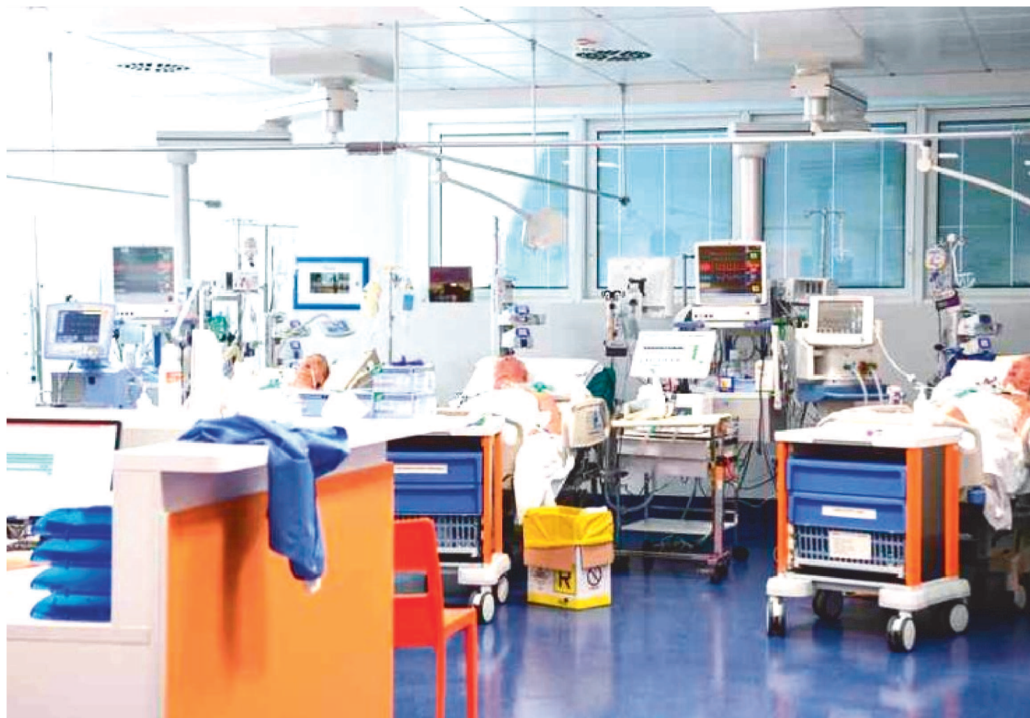
DESDE A ÚLTIMA TERÇA-FEIRA (31), NÚMERO DE ÓBITOS E CASOS DA DOENÇA CRESCE NO PAÍS

Nas últimas 24 horas, 58 novas vítimas do novo coronavírus foram confirmadas no Brasil. Desde o primeiro óbito registrado no país, esta é a maior quantidade de mortes de um dia para o outro. Com isso, o Brasil totaliza 299 vidas perdidas para a Covid-19.