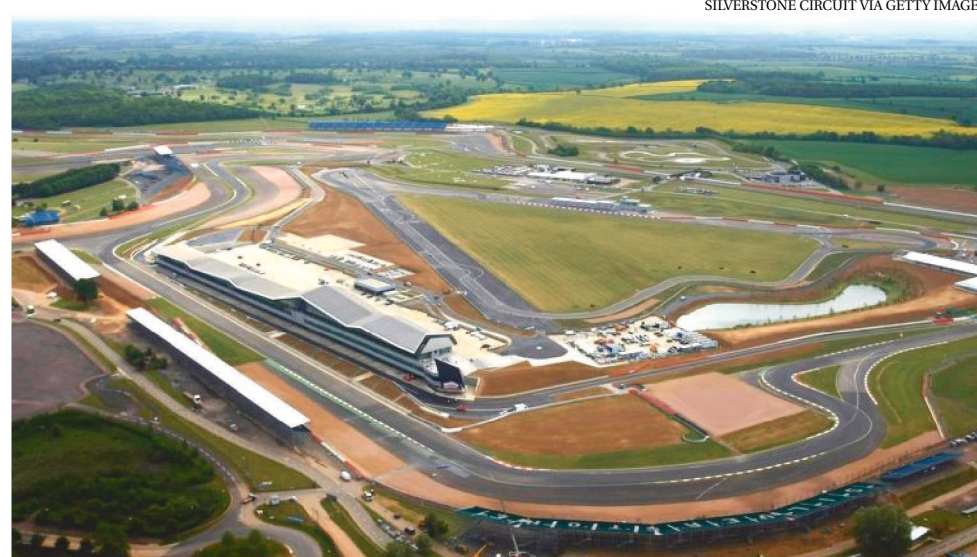
ADMINISTRAÇÃO DO CIRCUITO INGLÊS ESTÁ DISPOSTA A REALIZAR MAIS DE UMA ETAPA

Uma outra sugestão foi realizar a prova com o traçado invertido. E enquanto o diretor da pista admite que o circuito não tem licença para isso, ele aposta que isso pode ser revertido diante das circunstâncias únicas pelas quais passa a F1 e o esporte a motor