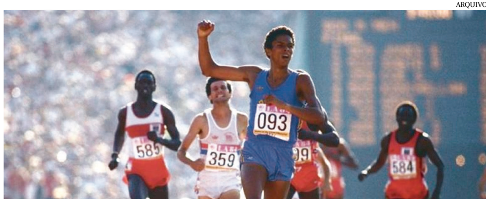
FINAL OLÍMPICA EM LOS ANGELES, ONDE JOAQUIM CRUZ E DONATO PARTICIPARAM

O italiano Donato Sabia, que participou de duas finais olímpicas dos 800m, morreu devido a complicações do Covid-19. O ex-atleta tinha 56 anos e vivia na cidade de Potenza, no sul na Itália. No fim de março, Sabia havia perdido o pai pela mesma doença. Sabia foi contemporâneo de Joaquim Cruz e participou das finais dos 800m em Los Angeles 1984 e em Seul 1988 – na primeira, o brasileiro foi medalhista de ouro e na segunda, de prata. Em 1984, o italiano ficou em quinto lugar; em 1988, foi o sétimo.