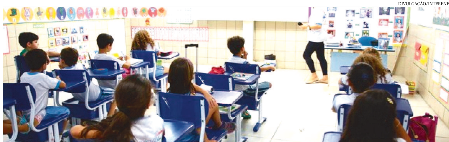
O MINISTÉRIO PÚBLICO E O PROCON EMITIRAM RECOMENDAÇÕES ONDE AS INSTITUIÇÕES PODEM MANTER OU DIMINUIR OS VALORES

O Ministério Público do Maranhão, através da Promotoria de Justiça Especializada na Defesa do Consumidor de São Luís, e o Instituto de Promoção e Defesa do Cidadão e Consumidor do Estado do Maranhão (Procon) emitiram uma Recomendação Conjunta às instituições de ensino do estado.