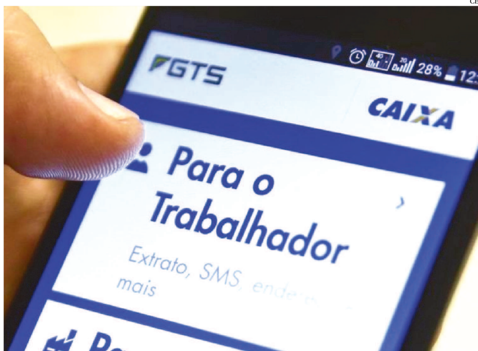
TRABALHADOR COM CONTA EM OUTROS BANCOS PODEM SOLICITAR DÉBITO EM CONTA

Como se trata de uma MP, a operação tem aplicação imediata, mas precisa ser aprovada pelo Congresso em