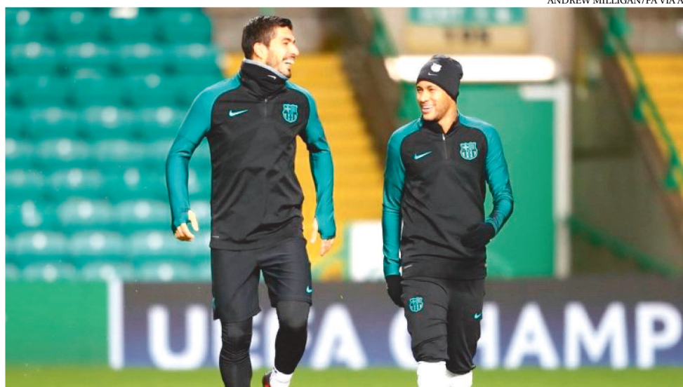
SUÁREZ E NEYMAR EM TREINO DO BARÇA QUANDO O BRASILEIRO ESTAVA NO CLUBE

acordo feito entre os atletas e o Barcelona para a redução do pagamento dos jogadores. O clube vai cortar 70% dos salários durante o período em que não houver jogos. Ele criticou os comêtiários que fizeram a respeito da postura dos jogadores. “Causou um mal-estar pelas coisas que disseram. Falaram que os jogadores não queri-