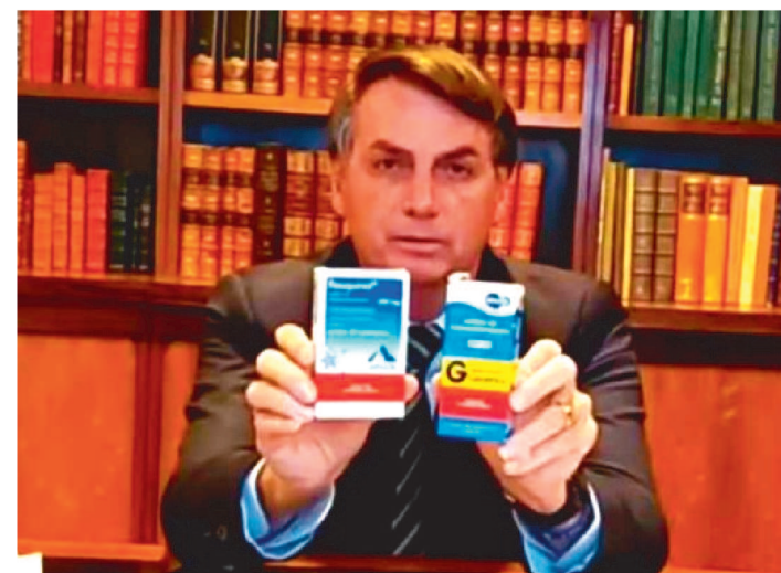
HASHTAG DEFENDE O ENTUSIASMO DO PRESIDENTE

Uma campanha pela indicação do presidente Jair Bolsonaro ao prêmio Nobel da Paz tornou-se no começo da tarde de ontem (9), o assunto mais relevante do Twitter brasileiro. A #JairNobeldaPaz acumulava até as 12h30 mais de 40 mil menções, dividindo usuários entre os que defendem que o entusiasmo do presidente com a medicação hidroxiquina é digno de um Nobel e os que ironizam a campanha promovida pelos bolsonaristas.