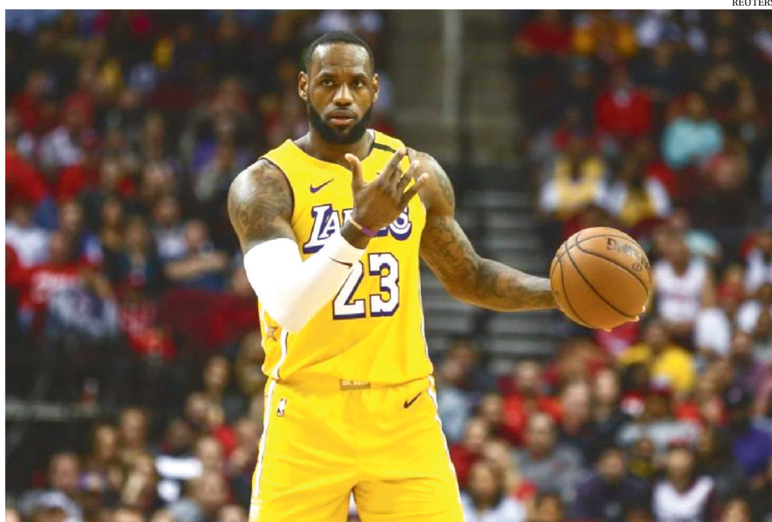
LEBRON JAMES, AOS 35 ANOS, VINHA BATENDO UMA SÉRIE DE RECORDES NESTA TEMPORADA

LeBron James acredita que será difícil aceitar um fim incompleto da temporada da NBA. Especialmente com a ótima atuação que seu time, o Los Angeles Lakers, vinha tendo, liderando a Conferência Oeste da liga americana de basquete quando a competição foi interrompida em função da pandemia de Covid-19, doença respiratória causada pelo coronavírus. Em entrevista coletiva por videoconferência na noite da última quarta-feira (8), o astro lamentou a situação. “Não sei se poderei ter um sentimento de encerramento se não tivermos a oportunidade de retomar a temporada”, declarou.