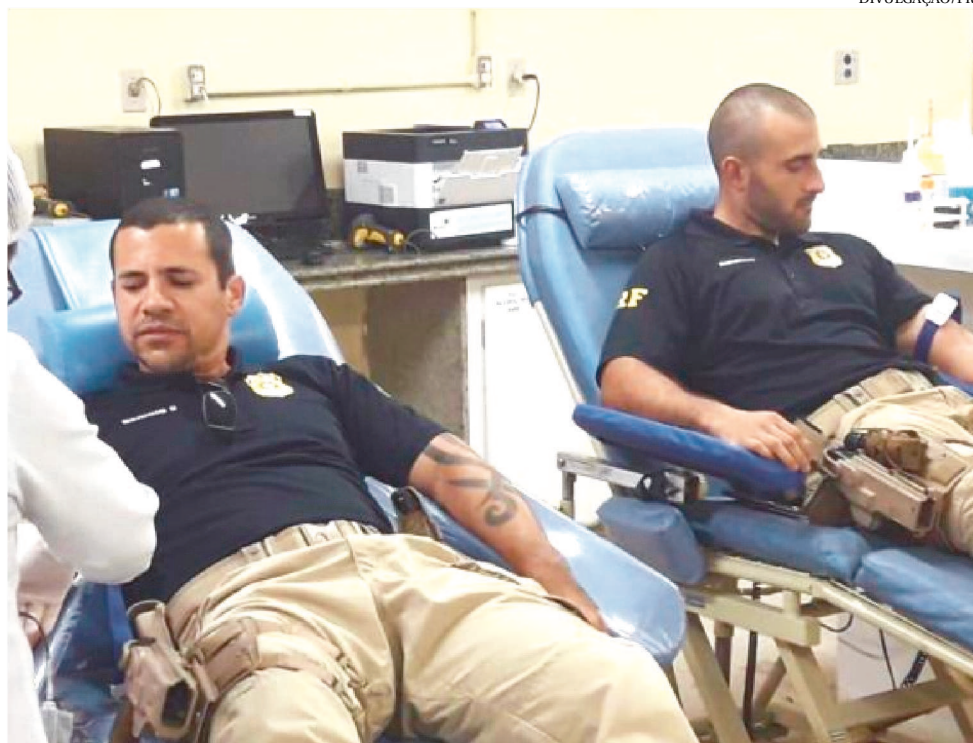
A PRF REALIZOU DOAÇÕES PARA REFORÇAR O ESTOQUE DE BOLSAS NA HEMOMAR

Até a última quarta-feira (8), com o suporte da campanha da PRF, já haviam sido realizadas 149 doações. Na semana passada, militares do Exército