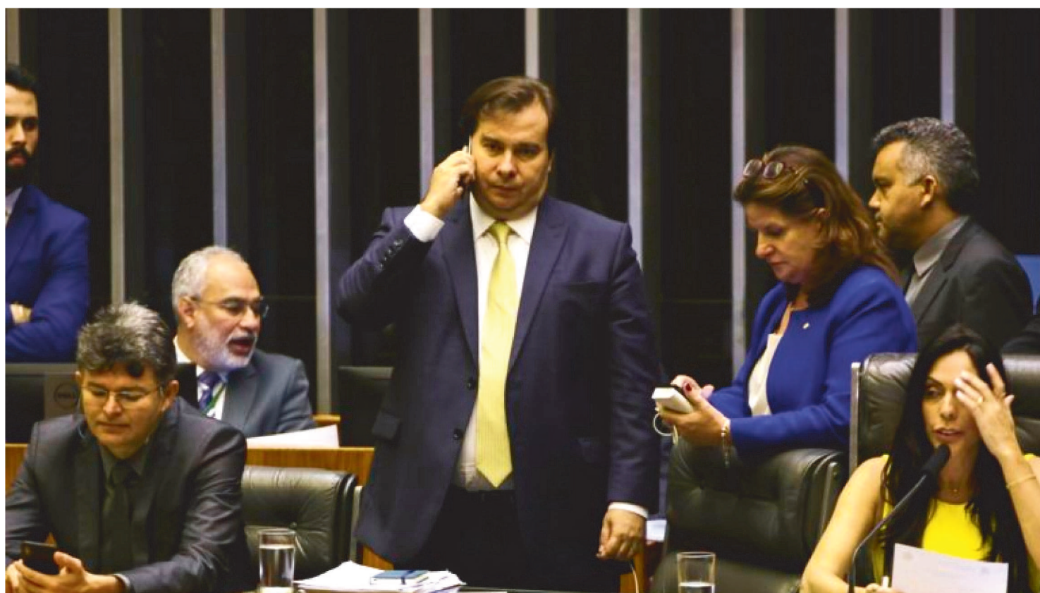
AUXÍLIO DE R$ 2 BI PARA SANTAS CASAS VAI À SANÇÃO PRESIDENCIAL APÓS APROVAÇÃO DA CÂMARA FEDERAL

Em mais uma sessão remota, a Câmara dos Deputados aprovou em regime de urgência, ontem (9), o projeto de lei 1006/20, que prevê a transferência de R$ 2 bilhões da União para santas casas e hospitais sem fins lucrativos (filantrópicos).