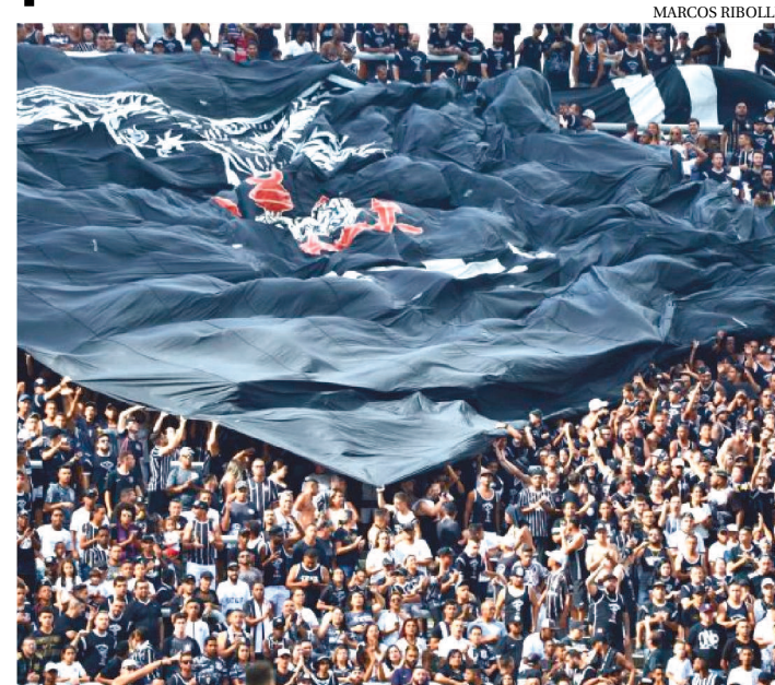
CORINTHIANS FAZ CAMPANHA PARA FIDELIZAR O TORCEDOR

O Corinthians lançou uma promoção voltada para o associado Fiel Torcedor cuja vigência se dará durante o período da quarentena, ou seja, até o retorno oficial da temporada de futebol, paralisada em virtude da pandemia de coronavírus.