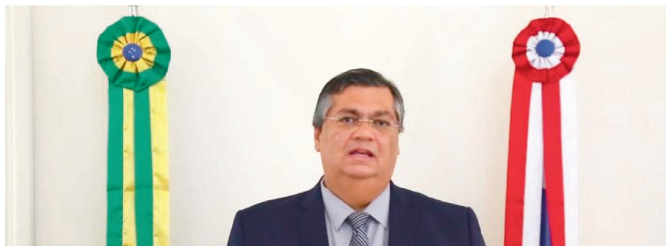
GOVERNADOR DO MARANHÃO FLÁVIO DINO DURANTE COLETIVA

Até o momento, as medidas restritivas estaduais ainda não tinham atingido a rotina bancária, regulada pelo Banco Central. Mas decisão desta quarta-feira (8) do ministro do Supremo Tribunal Federal (STF) Alexandre