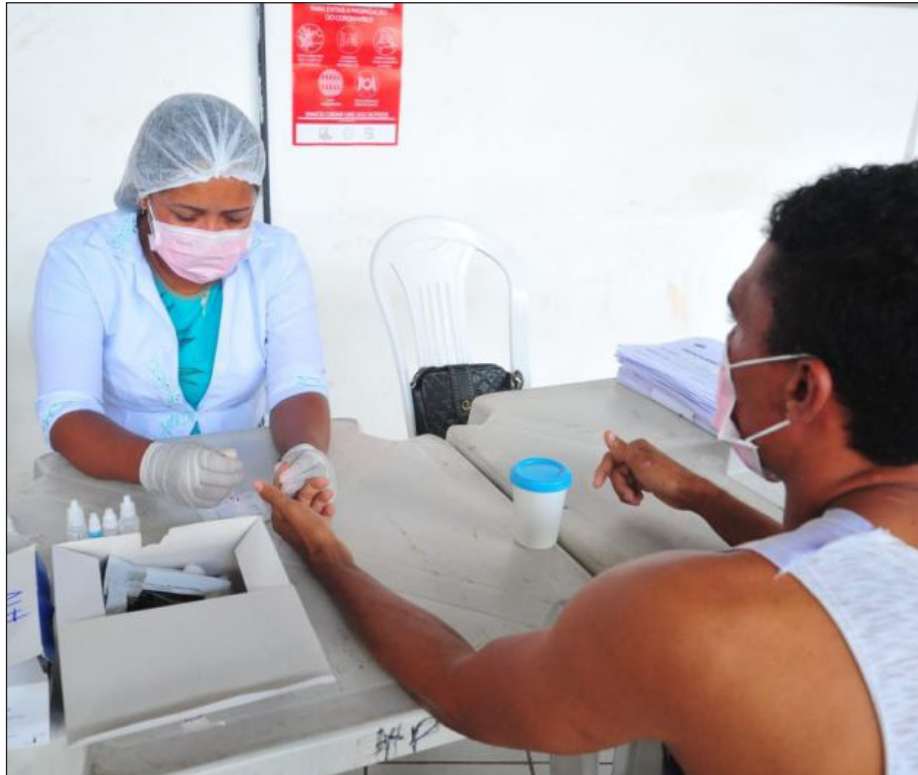
Prefeitura de São Luís e Governo do Estado iniciam testagens rápidas para Covid-19

As cinco pessoas que participaram da testagem rápida, já estavam em isolamento na Unidade da Vila Luizão, pois ao passar pela avaliação clínica havia suspeita de terem contraído o Covid-19. O acolhimento inicial acontece no Estádio Castelão, outro espaço provisório para abrigar a população em situação