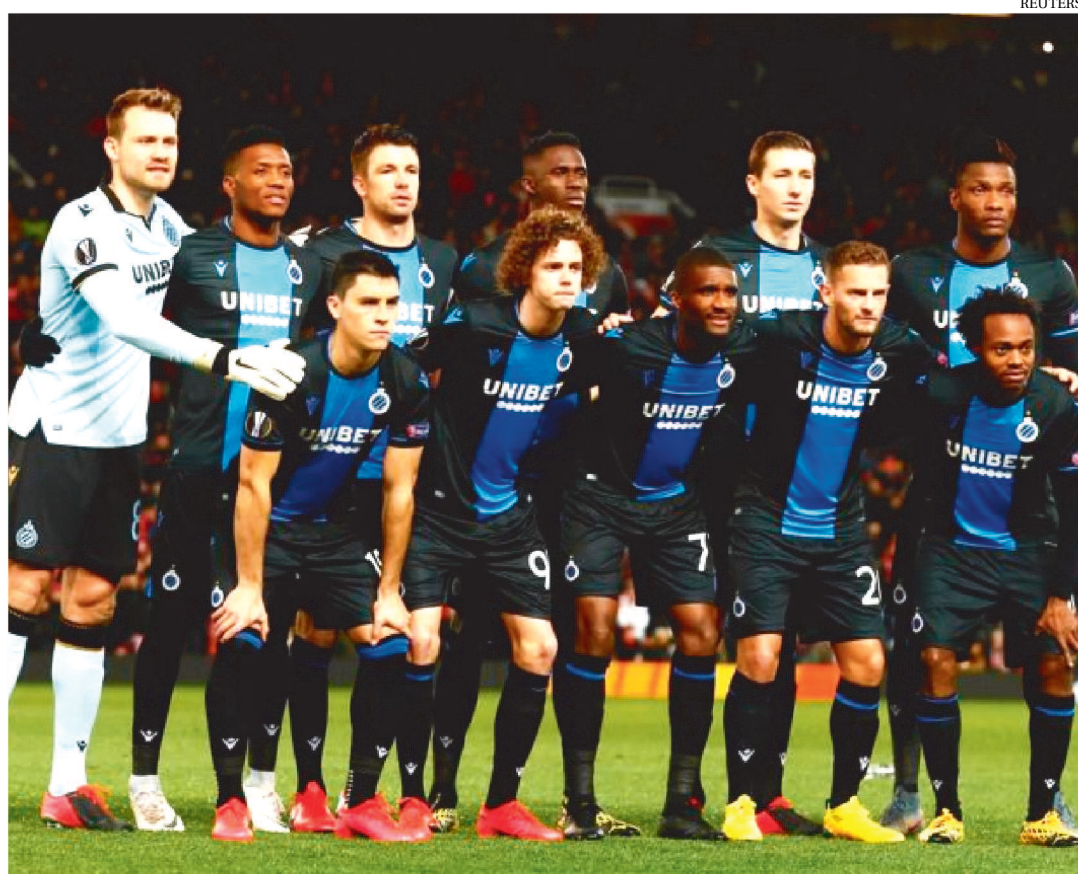
BRUGGE SERIA O CAMPEÃO BELGA SE A TEMPORADA ACABASSE HOJE, MAS DECISÃO FOI ADIADA

A Assembleia Geral da Pro League, que reúne os 24 clubes profissionais de futebol da Bélgica, adiou em nove dias a decisão sobre um provável encerramento antecipado da temporada no país, anunciou a entidade em comunicado.