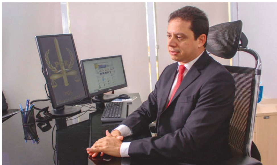
O PROCURADOR-GERAL DO MARANHÃO, RODRIGO MAIA, ATUAL PRESIDENTE CONPEG

Entre as consequências do ato, foi proibida a garantia de habeas corpus em casos de crimes políticos, foi decretado o fechamento do Congresso Nacional, pela primeira vez desde 1937, e o presidente estava autorizado a decretar estado de sítio por tempo indeterminado. Poderia demitir pes-