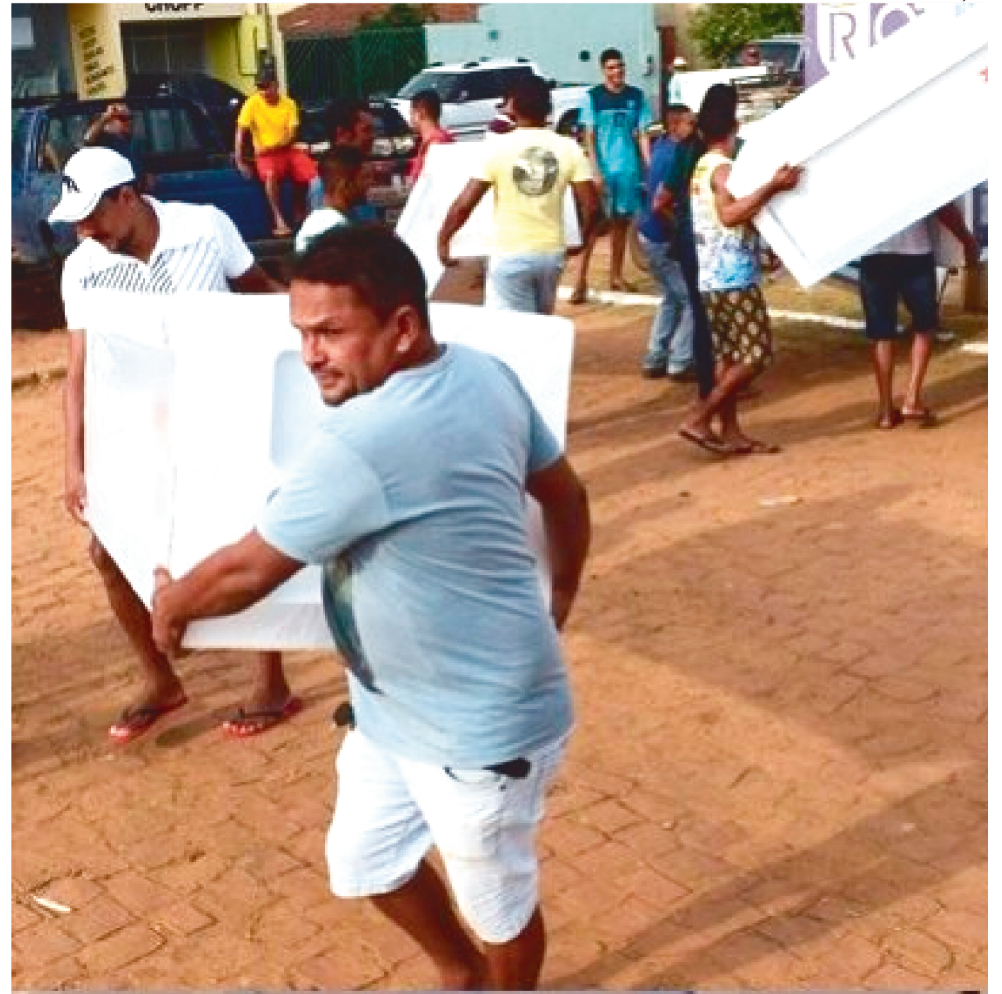
DOAÇÃO DAS 180 GELADEIRAS SERÁ PARA AS CIDADES DE SÃO LUÍS E IMPERATRIZ

"Nos sensibilizamos com a situação dos maranhenses que foram atingidos com as fortes chuvas desde o início do ano. Buscamos auxiliar de várias formas os diferentes municípios afetados, doando cestas básicas, geladeiras e o que mais estiver ao nos-