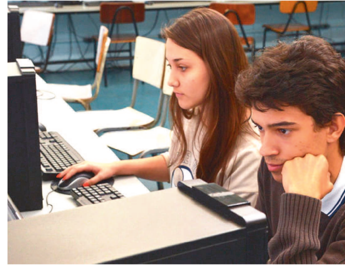
PROVAS PODEM SER FEITAS POR ALUNOS DAS REDES PÚBLICAS

O simulado online será realizado pelo Governo do Estado, por meio da Secretaria de Estado da Educação (Seduc), na próxima sexta-feira (24), com início previsto para as 18h (horário de Brasília) e o encerramento às 21h30. As provas poderão ser feitas por estudantes das redes públicas federal, estadual ou municipais, além de estudantes de escolas particulares, interessados em testar seus conhecimentos.