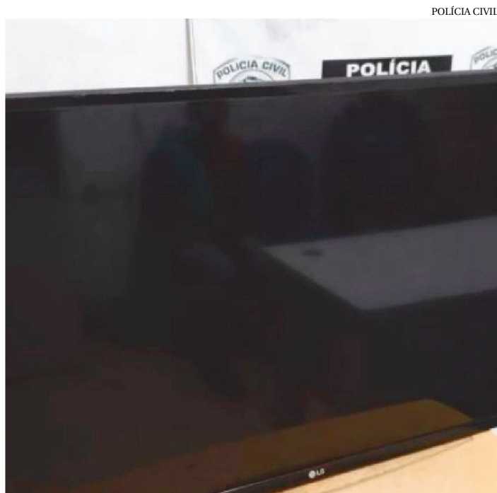
TELEVISÃO FOI RECUPERADA DURANTE AS OPERAÇÕES