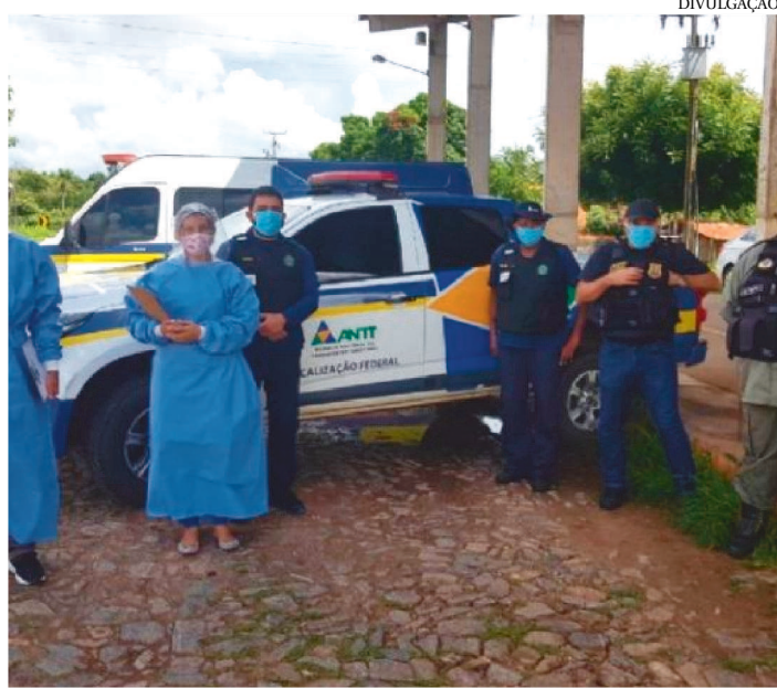
O ÔNIBUS APREENDIDO LEVAVA 40 PASSAGEIROS PARA CAPITAL.

Uma operação da Agência Nacional de Transportes Terrestres (ANTT) e da polícia Militar interceptaram um ônibus que fazia o transporte clandestino de passageiros para o estado do Maranhão.