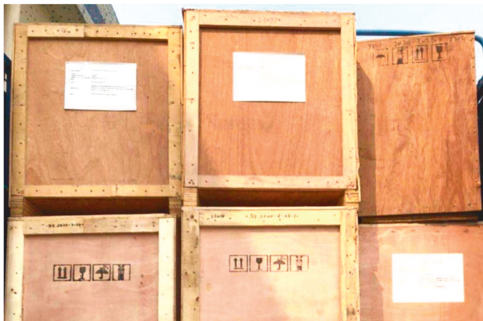
É ESPERADA A CHEGADA DE MAIS 80 APARELHOS RESPIRATÓRIOS NOS PROXIMOS DIAS

O governo maranhense montou a “operação de guerra” para trazer respiradores sem passar pelos radares dos Estados Unidos e da Europa, atualmente as regiões mais afetadas pela pandemia do novo coronavírus. A alta procura pelos equipamentos vem causando disputa entre os países de