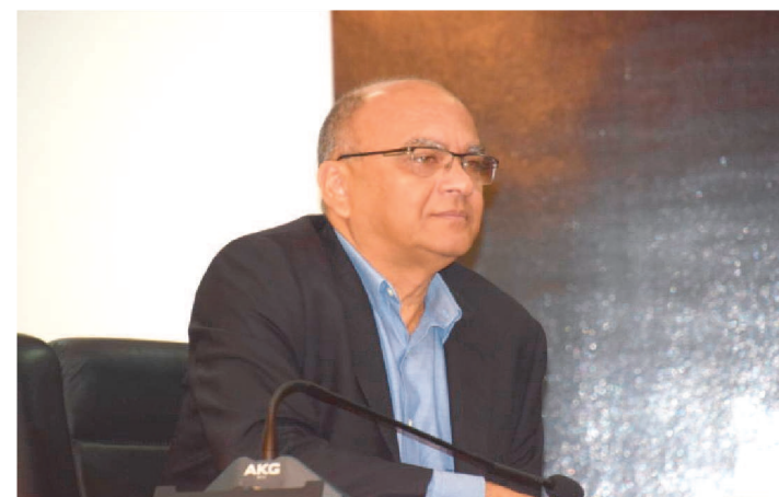
GONÇALVES DISSE QUE CURSOS SÃO PARA CONSELHEIROS

A Secretaria de Estado dos Direitos Humanos (Sedihpop), por meio da Secretaria Adjunta de Participação Popular (SAPP), lança hoje, quarta-feira (22), uma plataforma de cursos na modalidade ensino à distância (EAD), a Plataforma EAD Cursos Participa ( https://cursos.participa.ma.gov.br/ ), que tem por objetivo promover a educação em Direitos Humanos e Participação Popular e contribuir para a formação de agentes sociais.