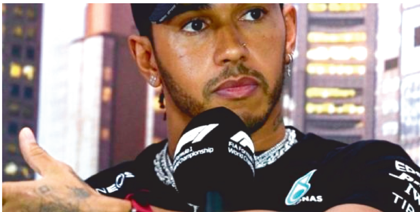
O PILOTO LEWIS HAMILTON AFIRMOU QUE OS ESCALÕES DE RENDA MAIS BAIXA SÃO EXCLUÍDOS DESDE O INÍCIO NA FÓRMULA 1