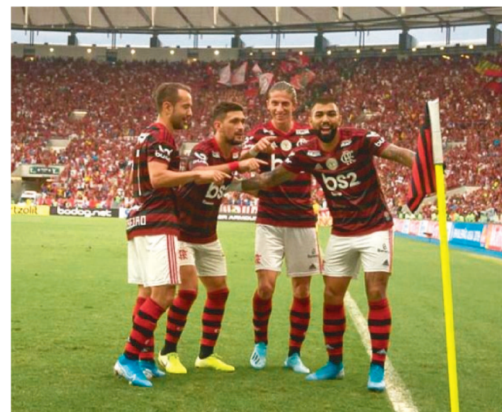
O FLAMENGO CONSEGUE ARCAR COM SUAS DESPESAS.