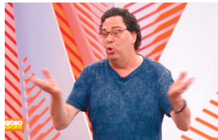
CASAGRANDE DEFENDEU RAÍ POR CRÍTICAS CONTRA GOVERNO

Após as críticas de Raí ao governo de Jair Bolsonaro, que acabaram sendo repreendidas pelo comentarista Caio Ribeiro na última quinta-feira, outro comentarista se manifestou sobre o caso, mas a favor do diretor tricolor. Casagrande, que é companheiro de Caio Ribeiro na Globo, afirmou que pensa exatamente como Raí e é contra a volta do futebol, defendendo o direito de expressar opiniões sobre qualquer assunto independentemente da profissão. "Eu penso exatamente como o Raí. Sou contra a volta do futebol, neste momento. Todos os dias, as mortes aumentam no país. É um absurdo pensar nisso. Já falei diversas vezes sobre esse assunto. Numa democracia, todas as pessoas podem e devem expressar suas opiniões sobre qualquer assunto, independentemente da sua profissão", afirmou em seu Instagram.