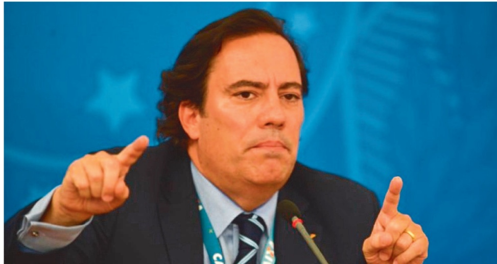
O PRESIDENTE DA CAIXA ECONÔMICA FEDERAL, PEDRO GUIMARÃES, FALA À IMPRENSA NO PALÁCIO DO PLANALTO

Segundo Guimarães, o banco ainda está fechando o detalhamento dos pagamentos da primeira parcela e fechará o calendário após reunião com o ministro da Cidadania, Onyx Lorenzoni, e aprovação do presidente da República, Jair Bolsonaro. De acordo com o presidente da Caixa, o pagamento da segunda parcela ocorrerá em dias distintos dos dias para o pagamento do Bolsa Família. A medida visa evitar aglomerações nas agências bancárias. “O segundo pagamento levará em conta tudo o que está acontecendo agora. De uma maneira muito clara: não há condição de misturar o pagamento do Bolsa Família com o das contas digitais. Passamos este mês montando a base de dados”, disse Guimarães. “Na semana que vem, vamos publicar o calendário do se-