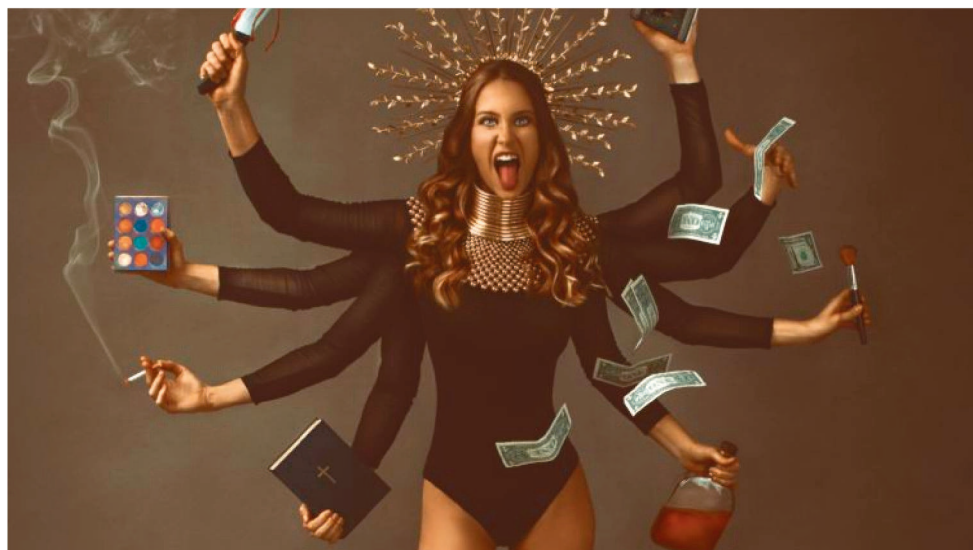
FOTÓGRAFA PROPÕE UMA INTERPRETAÇÃO É SUBJETIVA DOS ITENS ESCOLHIDOS

Maquiagem: quando as pessoas buscam a perfeição, para ser algo que não são. Quando querem mostrar que