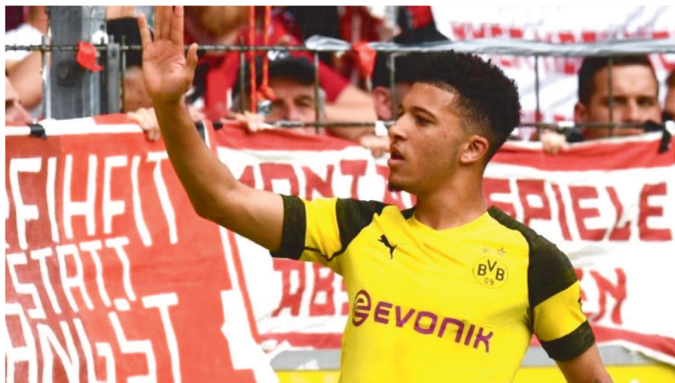
O BORUSSIA PEDE 130 MILHÕES DE EUROS (R$ 771 MILHÕES) PARA LIBERAR O ATLETA

O clube catalão, no entanto, tem algumas ressalvas sobre o craque. Uma delas é que o brasileiro é um jogador difícil de lidar e os dirigentes não encontram facilidade para domá-lo, o que não esperam em Sancho. Outro ponto que pesa na história é o valor de Neymar. O Barcelona teria que desembolsar entre 150 e 170 milhões de euros (entre R$ 889 milhões e R$ 1 bilhão) para contratá-lo. Sancho já deixou claro o desejo de sair do Borussia Dortmund e os alemães sabem que não podem fazer nada. O destino de preferência do jogador (e também o mais provável) seria a Inglaterra. O Manchester United é quem mais se aproxima da contratação, mas ainda