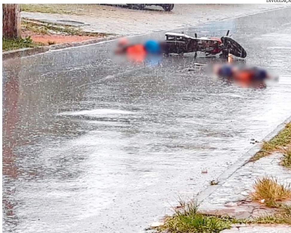
MORTES DE ADOLESCENTES SUBIRAM 100% NOS ÚLTIMOS 60 DIAS NA ILHA DE SÃO LUÍS

foram mortas a tiros, ou seja, 27 pessoas perderam a vida através de arma de fogo. Esse número representa que 85,19% perderam a vida após serem atingidas por tiros. Apenas 14,81% das vítimas morreram através de armas brancas e outros meios.