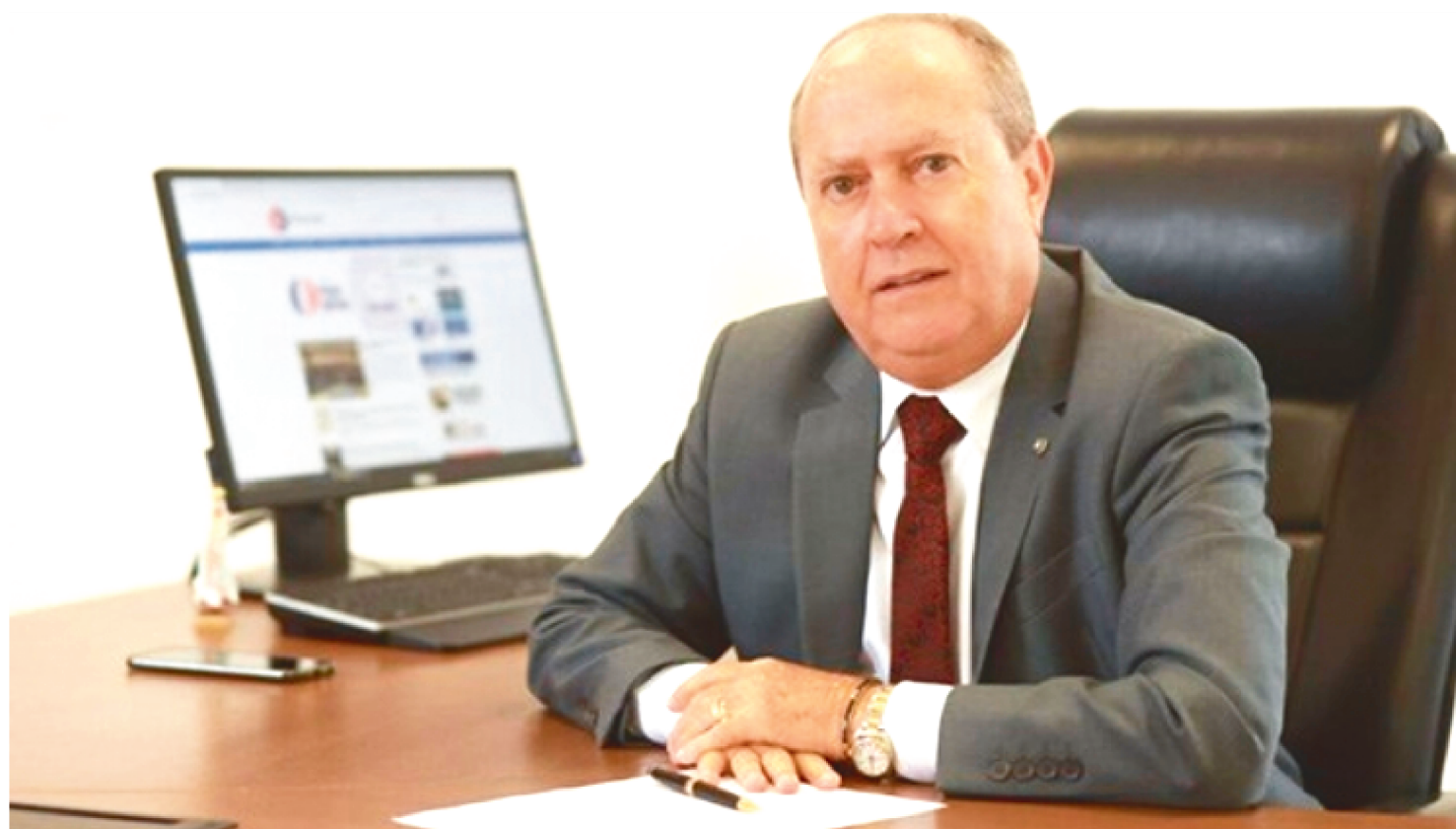
A SOLENIDADE DE POSSE DO FUTURO PROCURADOR-GERAL DE JUSTIÇA ESTÁ MARCADA PARA O DIA 15 DE JUNHO