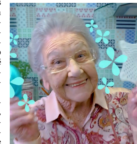
A apresentadora e culinária Vovó Palmirinha que protagoniza a campanha educativa da BRK Ambiental do Meio Ambiente.

A campanha da BRK Ambiental conta com vídeo e peças para redes sociais celebrando o dia Mundial do Meio Ambiente. E envolverá 100 influenciadores digitais que participarão na disseminação das dicas sobre a destinação correta do lixo doméstico.