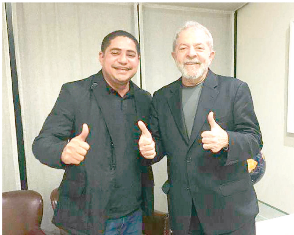
“SOU PRÉ-CANDIDATO DO LULA E DA MILITÂNCIA DE ESQUERDA”, DISSE ZE INÁCIO

“Apresentamos o nome do companheiro Zé Inácio, Deputado Estadual, como pré-candidato a Prefeito de São Luís, para representar o PT nestas eleições, parlamentar atuante e comprometido com as lutas do Partido dos Trabalhadores, que tem ampla relação com os movimentos sociais e faz um mandato participativo na Assembleia Legislativa do Maranhão, voltado para a classe trabalhadora, para a juventude, mulheres, negros e negras, pessoas que sonham e lutam incansavelmente por um projeto de-