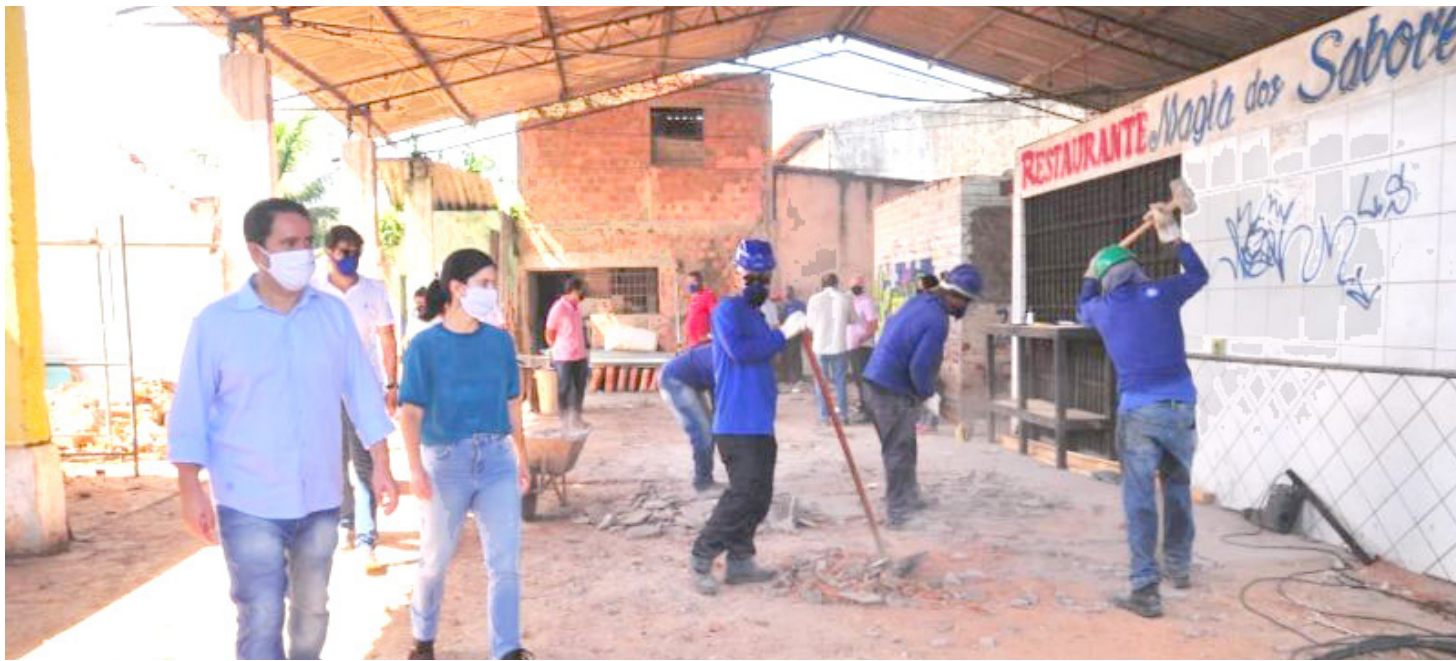
Prefeito Edivaldo vistoria obras de mercados, que recebem o maior pacote de investimentos da história

Edivaldo esteve nos mercados do Monte Castelo, Bom Jesus e Santo Antônio que recebem serviços; além destes, outros mercados da capital estão em obras para melhorar a estrutura de trabalho a feirantes e segurança aos consumidores