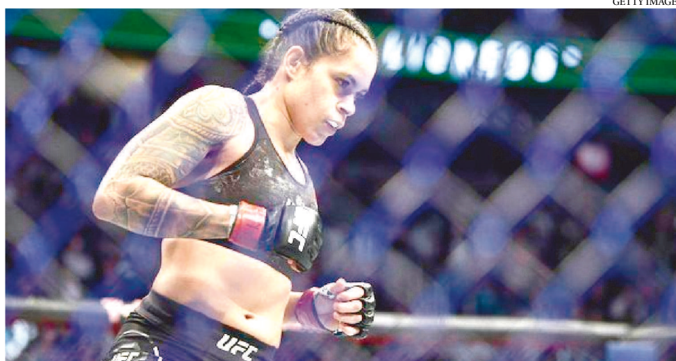
AMANDA NUNES PODE FICAR SEIS MESES SUSPENSA PELOS MÉDICOS DO UFC 250

médica para evitar suspensão até 4 de dezembro.