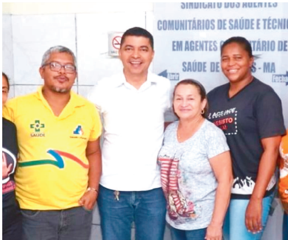
O PROJETO DE BIRA JÁ RECEBEU A ADEÇÃO DE COAUTORIA DE 17 OUTROS DEPUTADOS

Profissionais essenciais Além da proposta de pagamento do