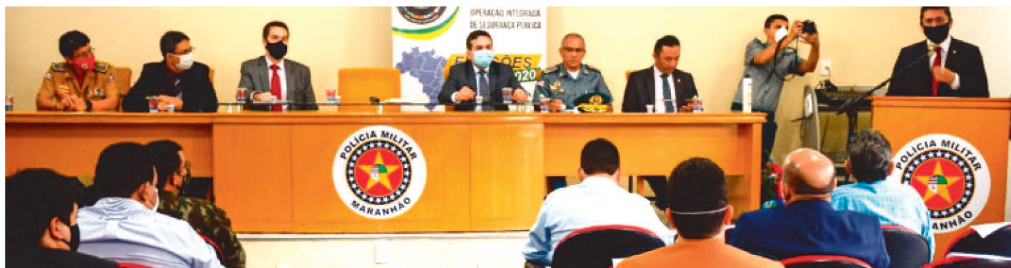
NA OCASIÃO, OS PRESENTES DISCUTIRAM AS DIRETRIZES DO MINISTÉRIO DA JUSTIÇA E DA SEGURANÇA PÚBLICA.

Representantes da Secretaria de Estado de Segurança Pública (SSP-MA) e da Justiça Eleitoral trataram sobre os direcionamentos para o planejamento operacional a ser executado durante as eleições 2020.