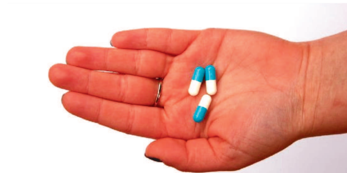
BRASIL POSSUI MAIS DE 220 MIL FARMACÊUTICOS INSCRITOS

O brasileiro nos últimos meses deixou de frequentar muitos estabelecimentos devido à pandemia da covid-19. Porém, as farmácias – muitas vezes a primeira escolha da população que precisa acessar os serviços e orientações relacionadas à saúde – continuam atendendo um fluxo grande de pessoas in loco, afinal, é justamente o segmento da saúde que acabou ganhando foco neste novo cenário mundial. Em comemoração ao Dia da Farmácia, no último 5 de agosto, confira as novidades da área, além de dicas e orientações para quem precisar frequentar esses locais durante a pandemia.