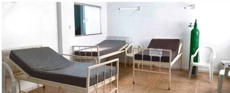
A OPERAÇÃO INVESTIGA SUPERFATURAMENTO DE MATERIAIS HOSPITALARES

A operação Falsa Esperança tinha como finalidade de desarticular associação criminosa voltada a fraude em