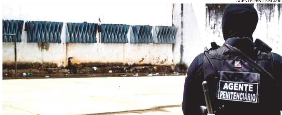
PESQUISA DA NEB/FGV MOSTRA QUE TENSÃO ENTRE OS PRESOS É UM DOS MOTIVOS

Segundo a pesquisa, entre os motivos para o aumento da tensão entre os detidos, os profissionais apontam a falta de contato com os familiares, de informações sobre o cenário real da