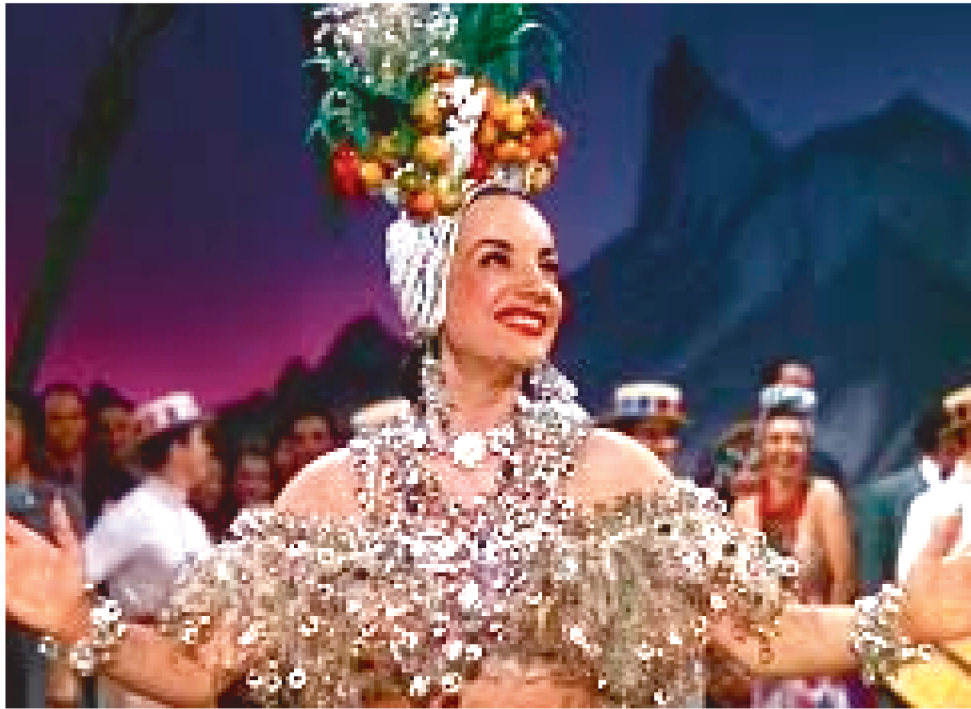
"AURORA" ETERNIZADA POR CARMEM MIRANDA FICOU EM 1º LUGAR NO RANKING

Maria do Carmo Miranda da Cunha, artisticamente conhecida como Carmen Miranda, foi uma mulher à frente