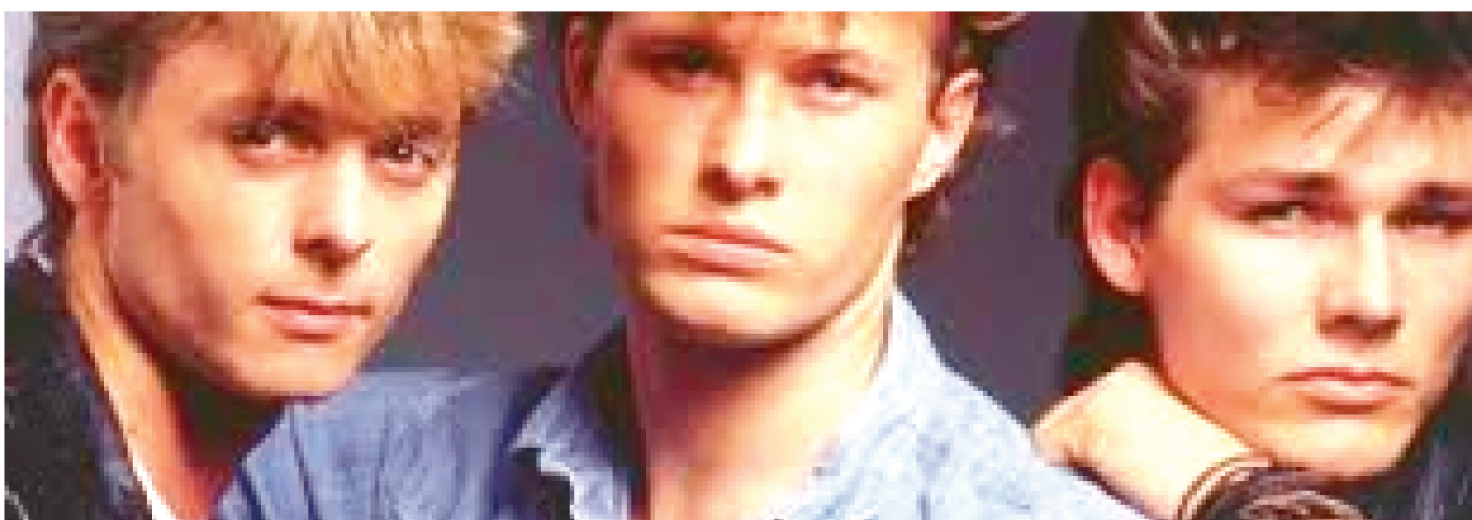
TURNÊ MUNDIAL QUE VEM PARA O BRASIL CELEBRA O ANIVERSÁRIO DE 35 ANOS DO ÁLBUM DE ESTREIA DO GRUPO NORUEGUÊS A-HA

Em comemoração aos 35 anos do lançamento de um dos mais influentes álbuns da história da música pop, trio norueguês marca novas datas para apresentações em Salvador, Belo Horizonte, Rio de Janeiro, São Paulo e Curitiba devido à pandemia do covid-19