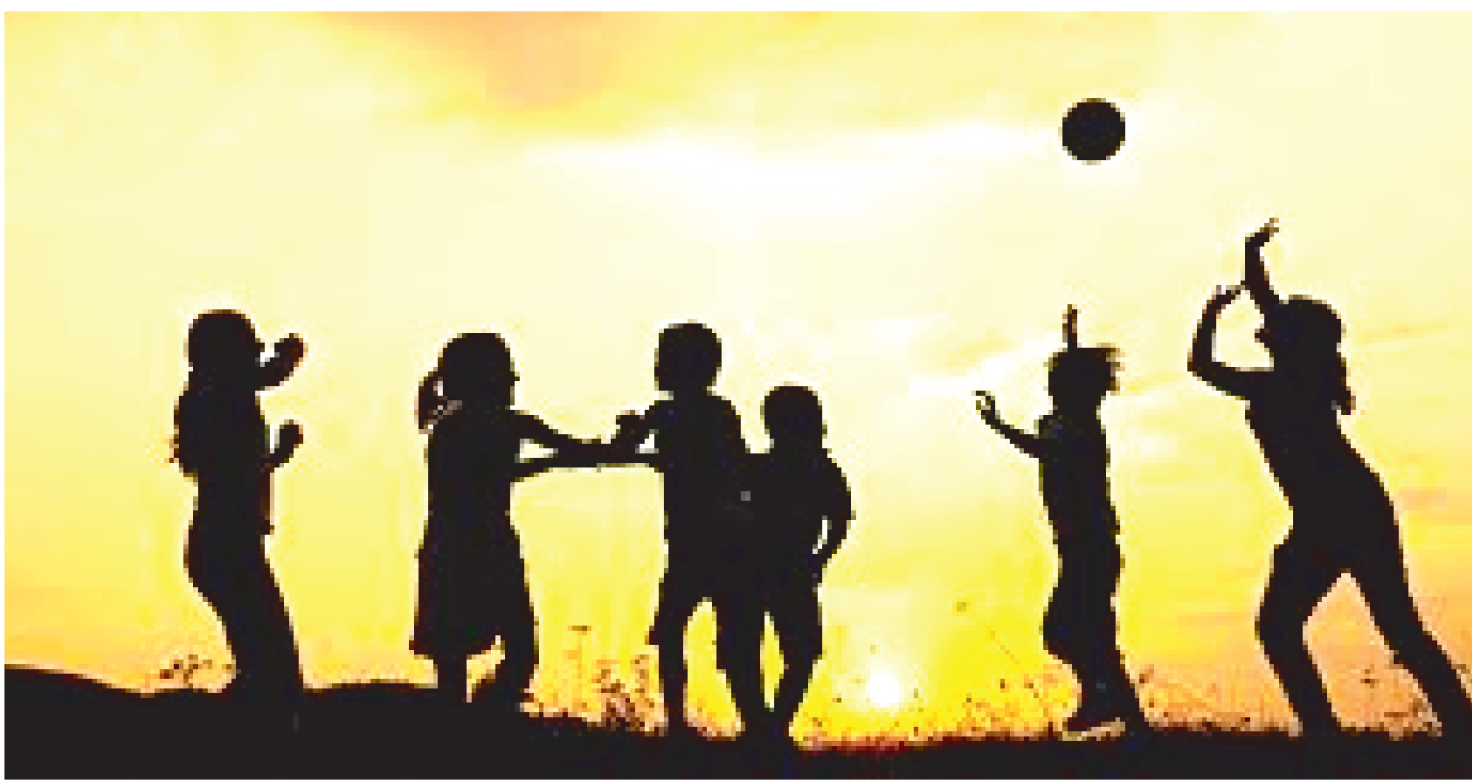
SER CRIANÇA E TER INFÂNCIA SÃO DOIS PRATOS DE UMA BALANÇA QUE AINDA ESTÁ EM BUSCA DO SEU FIEL.

Esse jeito próprio e único de cada criança ser, de sentir, de se relacionar, enfim, de viver, impacta e é impactado por muitos aspectos intervenientes, como: as relações interpessoais e aspectos sócio-afetivos com outras crianças e adultos em geral; as relações familiares e a qualidade do compromisso que cada responsável estabelece com suas crianças; as oportunidades desiguais de acesso aos bens culturais de sua comunidade e de seu povo; a renda familiar; e a maior ou menor garantia de acesso aos direitos garantidos à infância.