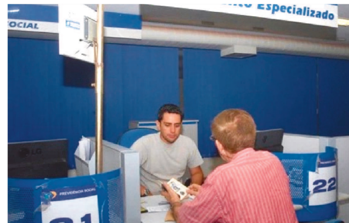
AS AGÊNCIAS DO INSS VÃO REABRIR NO PRÓXIMO MÊS

A Secretaria Especial de Previdência e Trabalho do Ministério da Economia e do Instituto Nacional do Seguro Social (INSS) decidiram adiar até o dia 14 de setembro o retorno gradual e seguro do atendimento presencial nas Agências da Previdência Social.