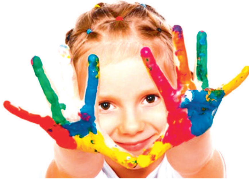
O CONCEITO DE INFÂNCIA SE SUSTENTA EM ASPECTOS MULTISSENSORIAIS.

No Brasil, as pessoas são consideradas crianças desde o momento em que nascem até completarem doze