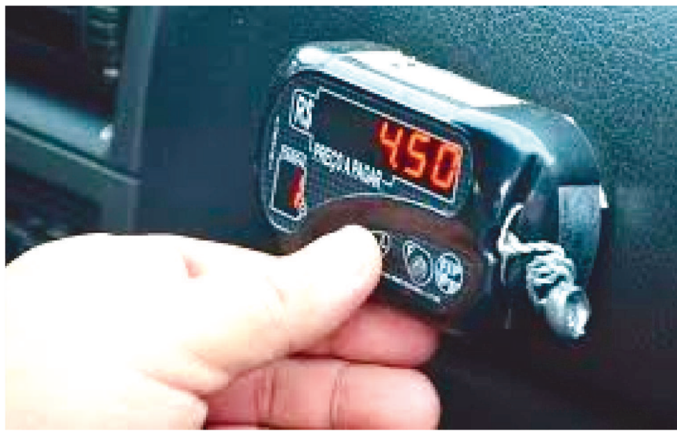
A QUANTIDADE DE AGENDAMENTOS PARA AFERIÇÃO DOS TAXÍMETROS SERÁ LIMITADA

A quantidade de agendamentos para aferição dos taxímetros será limitada em 32 instrumentos por dia. “Toda essa atividade de aferição ela segue os protocolos sanitários do Ministério da Saúde e da Organização Mundial da Saúde de forma que todos