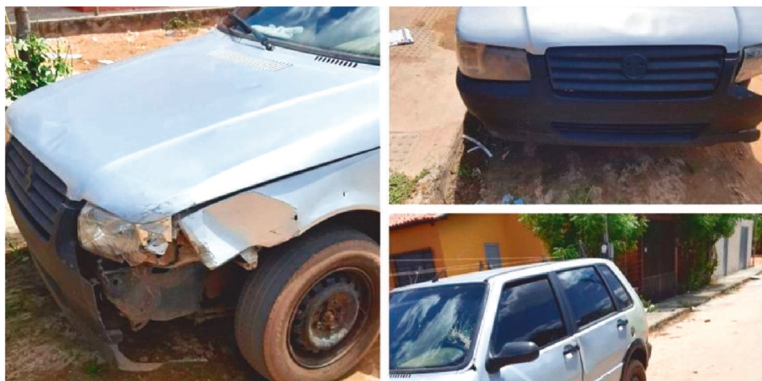
O CARRO DO SUSPEITO FOI IDENTIFICADO ATRAVÉS DE IMAGENS DE CÂMERAS DE SEGURANÇAS