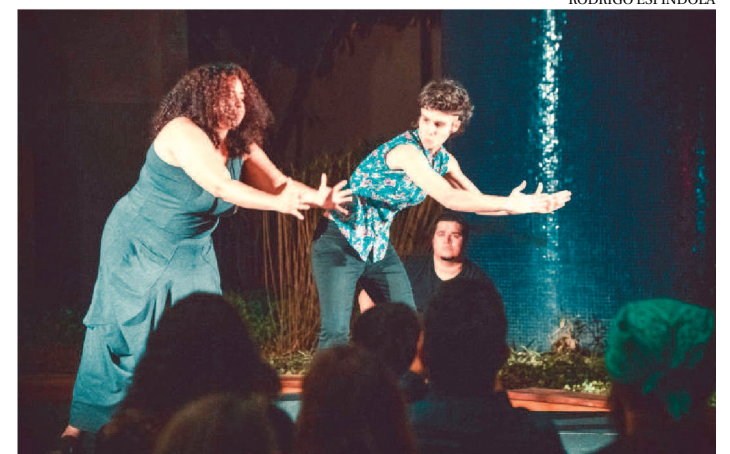
SLAM É UMA BATALHA DE POESIAS, UMA CELEBRAÇÃO

O CCVM abre, nesta quarta (26), inscrições para o Laboratório On-line de Poesias em Libras e Português com o coletivo Slam do Corpo (SP), que tem como proposta a investigação criativa entre a Língua Portuguesa e a Língua Brasileira de Sinais, a partir da experiência poética. Criado em 2014 pelo Coletivo Corposinalizante, o Slam do Corpo é a primeira batalha de poesias no Brasil com surdos e ouvintes, em parceria com o Núcleo Bartolomeu de Depoimentos (idealizador do ZAPISLAM) e o poeta Daniel Minchoni (idealizador do Sarau do Burro e Menor Slam do Mundo). O Slam nasceu do desejo de experimentar performances poéticas em uma composição entre a língua portuguesa e a língua de sinais, entre surdos e ouvintes.