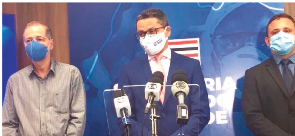
MARANHÃO JÁ REGISTROU 144.895 CASOS CONFIRMADOS E 3.365 MORTES POR COVID.

A pesquisa teve início no dia 27 de julho e se estendeu até o dia 7 de agosto. Ele se dividiu em quatro etapas. A primeira englobou os quatro municípios da Grande Ilha, onde 1.432.529 habitantes fizeram parte da pesquisa. Na segunda, 122 municípios participaram, tendo 1.516.205 habitantes pesquisados. Já na terceira fase, a pesquisa foi realizada em 85 municípios e contou com a participação de