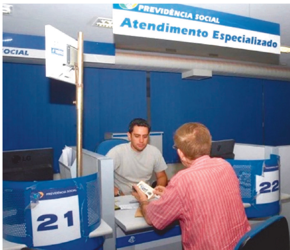
EM ALGUNS CASOS O SEGURADO PODE ACUMULAR DOIS BENEFÍCIOS DO INSS

Anteriormente, se o cônjuge falecesse e depois a pessoa perdesse um filho e provasse que havia dependência financeira dele, poderia receber as duas pensões. Um filho também po-