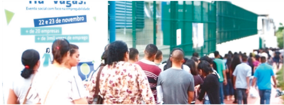
MAIS DE 47 MIL PESSOAS PERDERAM O EMPREGO NO MÊS DE AGOSTO NO MARANHÃO

Já o rendimento médio real efetivamente recebido de todos os trabalhos foi de R$ 1.327 no mês de agosto. Valor