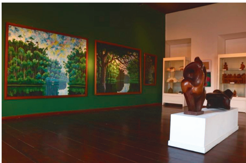
DIVERSAS PEÇAS SÃO ORIUNDAS DO BRASIL, VENEZUELA, SURINAME E COLÔMBIA

A Fundação da Memória Republicana Brasileira já anunciou a exposição virtual "#SOSAmazonia". A mostra apresenta obras de arte sobre a