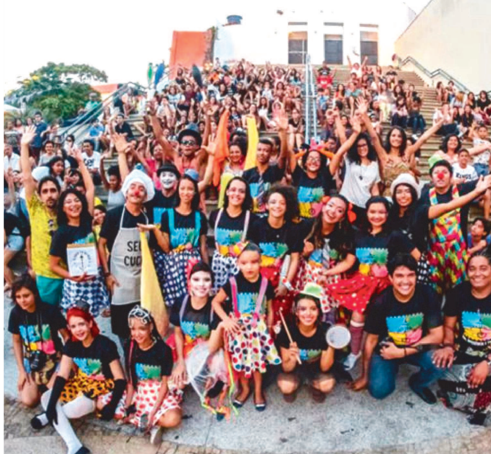
O PROJETO "CIRCO TÁ NA RUA" ESTÁ HÁ SETE ANOS EM ATIVIDADE EM SÃO LUÍS

O circo possui aproximadamente 25 artistas, os quais trabalham com diversas modalidades. Também atua