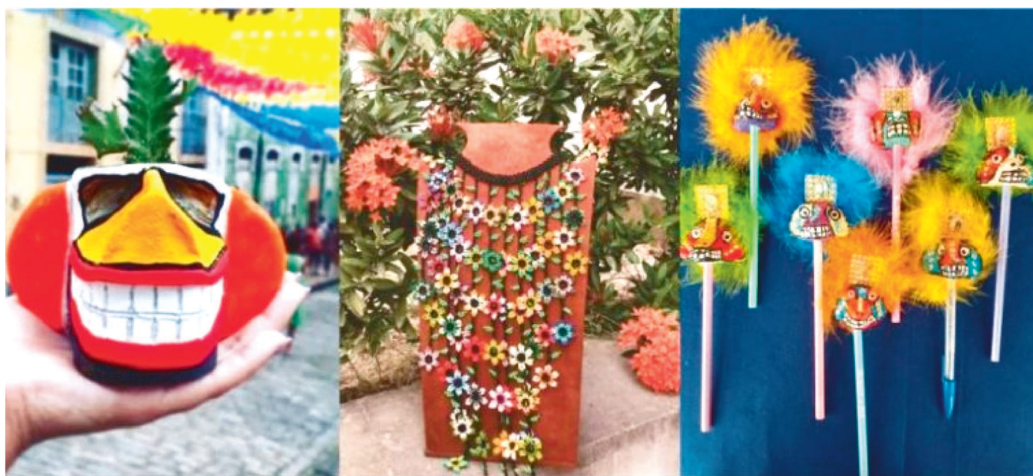
PARTICIPANTES APRENDERÃO COMO MODELAR UM VASO NO FORMATO DE CAZUMBÁ, UM DOS PERSONAGENS DO NOSSO SÃO JOÃO

O artesanato maranhense é rico em matérias-primas e técnicas variadas. E para quem quer desenvolver suas habilidades em trabalhos manuais, o Sesc oferecerá a Oficina de Vasos Personalizados, Oficina de Bijuterias e Oficina de personagens da cultura maranhense em papel machê/ ponteira de lápis por meio da plataforma Youtube, de 01 a 03 de outubro, das 14 às 15h. As aulas são abertas ao público, mas quem desejar certificado de participação deve inscrever-se até o dia 30 de setembro pelo link abre.ai/oficinasartesanais .