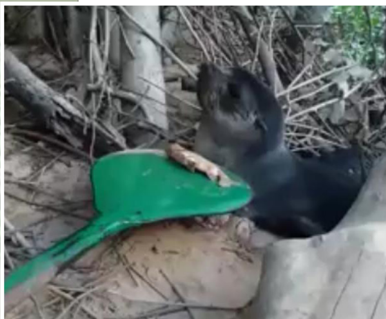
O animal foi visto nesta semana em um povoado ribeirinho de Arari. O local é conhecido como São José e alguns pescadores o encontraram um pouco debilitado.