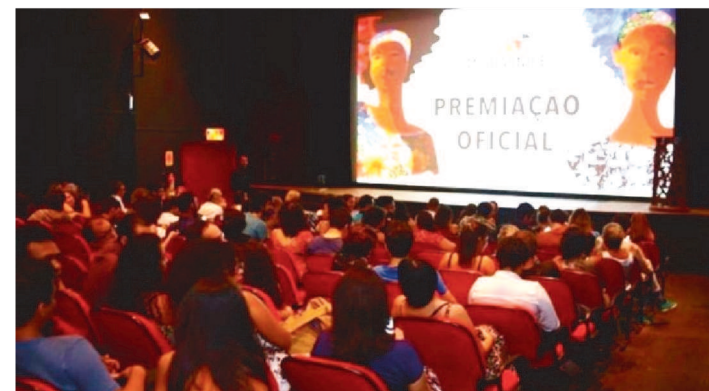
OFICINAS DO FESTIVAL GUARNICÊ OCORRERÁ EM OUTUBRO