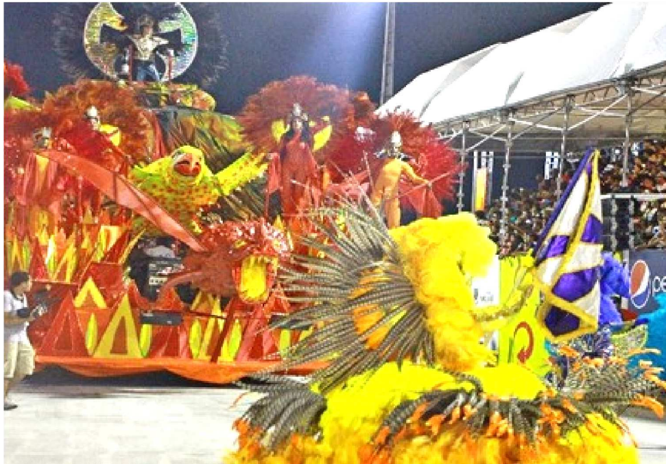
FAVELA DO SAMBA LANÇARA PROGRAMA EM TODAS AS PLATAFORMAS DIGITAIS