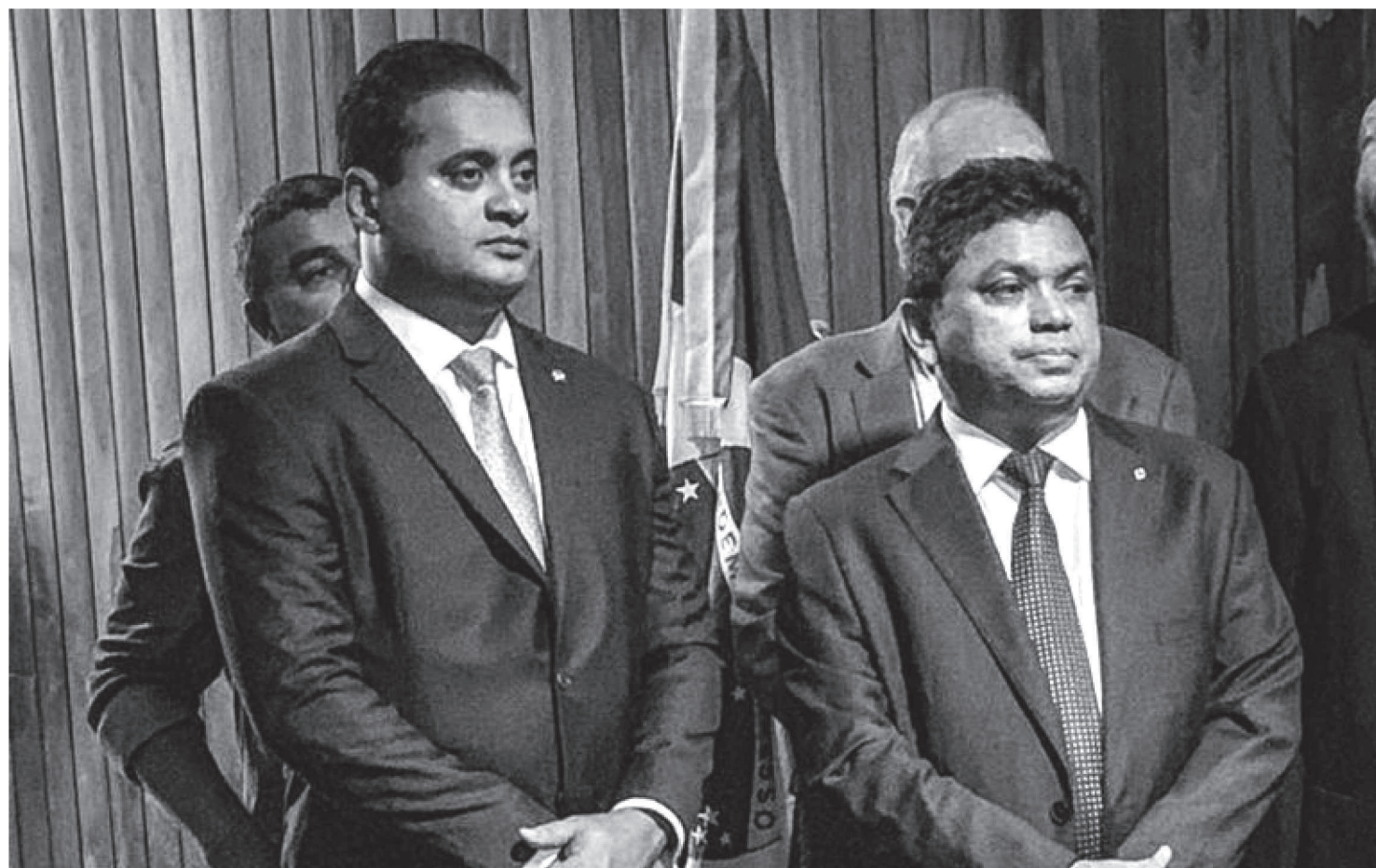
INICIATIVA PARLAMENTAR É LIDERADA PELO DEPUTADO MÁRCIO JERRY E PELO SENADOR WEVERTON ROCHA (PDT-MA)

Presidente da Frente Parlamentar Mista pelo Fortalecimento do Sistema Único da Saúde (SUS), o vice-líder do PCdoB, deputado federal Márcio Jerry (MA), afirmou nesta terça-feira (27) que levará à Comissão Mista do Orçamento (CMO) o embate sobre os cortes de cerca de R$ 40 bilhões previstos para a área em 2021. Em discurso na sessão virtual da Câmara, o parlamentar, que também é membro titular da Comissão, defendeu a garantia de recursos permanentes para o Sistema que hoje alcança 180 milhões de brasileiros e realiza em torno de 2,8 bilhões de atendimentos médicos por ano no país.