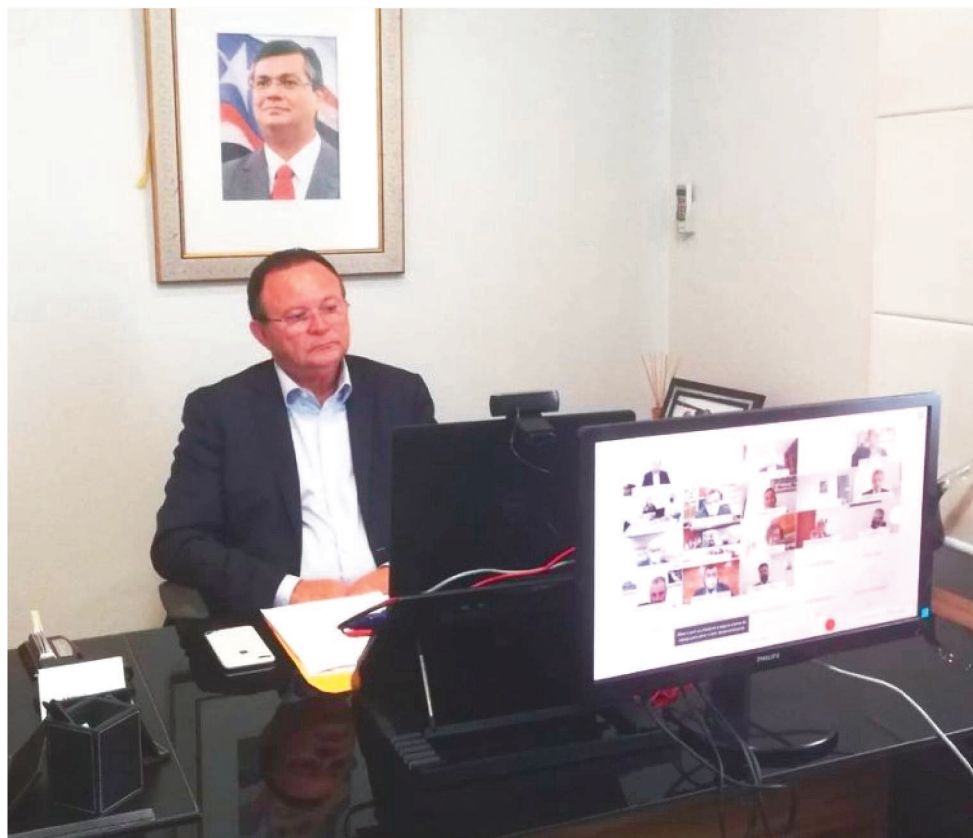
NO EVENTO, FORAM DISCUTIDAS SOLUÇÕES PARA OS PROBLEMAS FUNDIÁRIOS