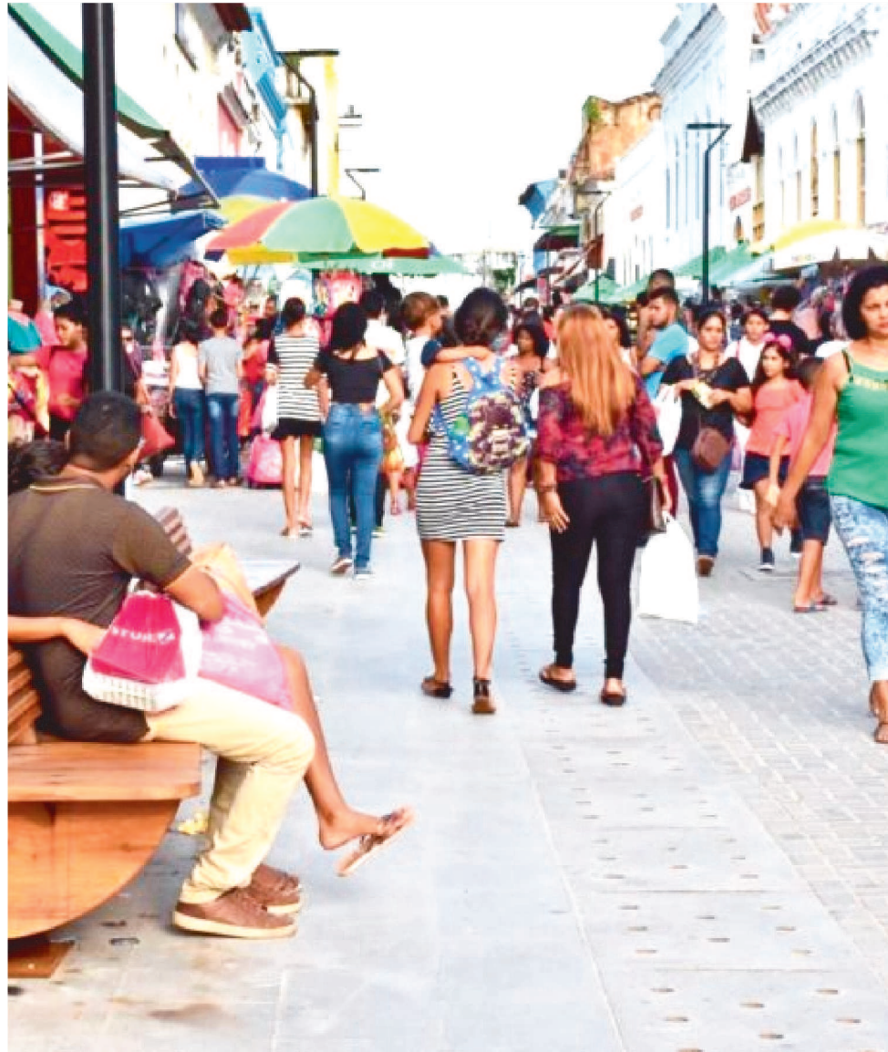
AS LOJAS DE RUA E GALERIAS PODERÃO ABRIR AS PORTAS NESSE DIA DAS 8H ÀS 18H

As empresas que desejarem funcionar no dia 2 de novembro deverão enviar, com antecedência, a lista dos empregados convocados para o trabalho ao conhecimento do Sindco-