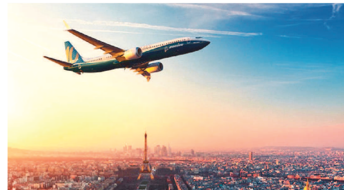
SITES VÃO AJUDAR NA PROCURA DE PASSAGENS EM CONTA