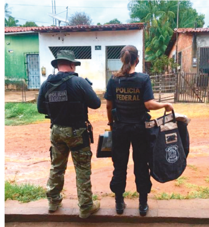
O VEREADOR IRIA PAGAR R$ 50 POR VOTO COMPRADO

Na manhã de ontem, terça-feira (3), a Polícia Federal realizou a Operação Lei Mária. O objetivo foi combater o crime de corrupção eleitoral praticado por um vereador da cidade de São José de Ribamar.