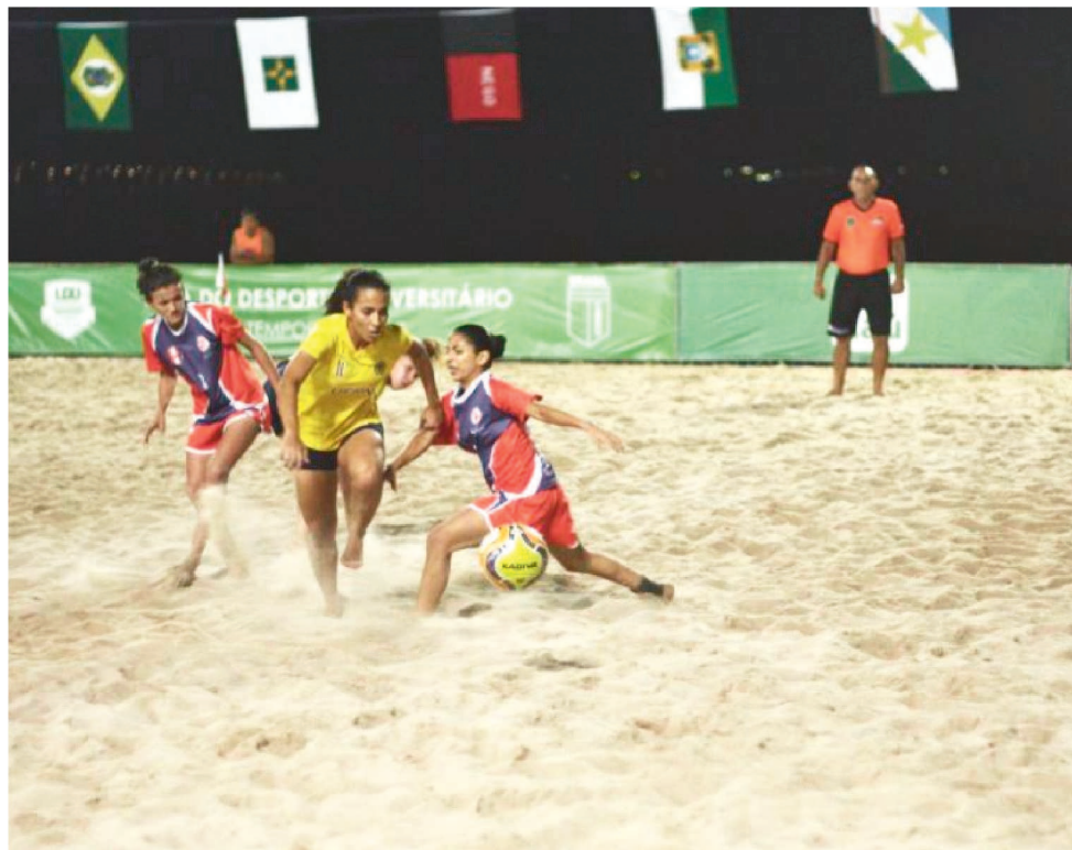
A COMPETIÇÃO SEGUIE ATÉ O DIA 8 E CONTA COM JOGADORAS DA SELEÇÃO BRASILEIRA

As equipes se enfrentam dentro de cada grupo e duas melhores de cada