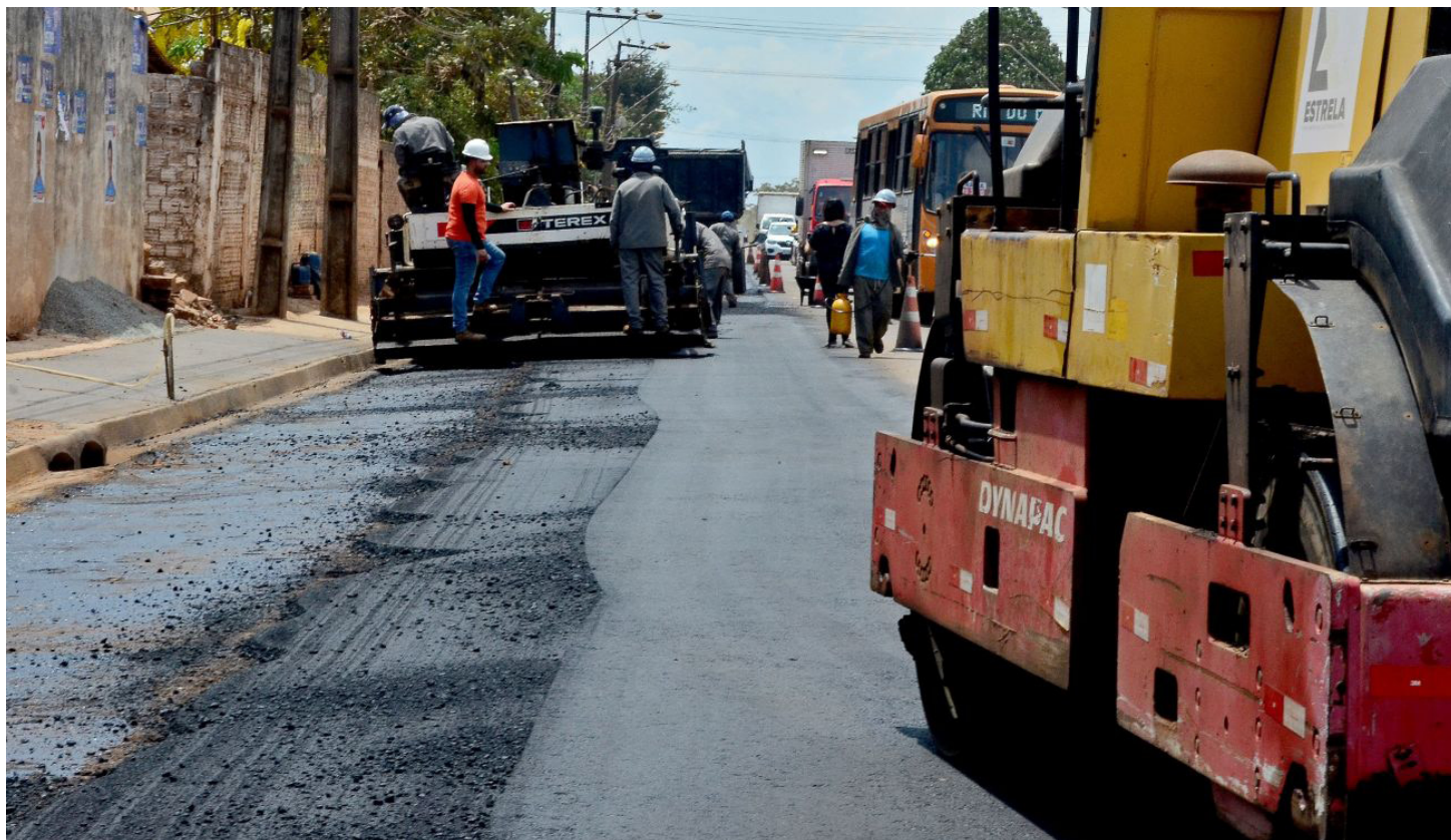
Prefeitura de São Luís avança com obras estruturantes na região do Santa Bárbara

Avenida é uma das principais vias do bairro em que a gestão do prefeito Edivaldo implanta drenagens profunda e superficial e ainda pavimentação de ruas e avenidas mudando a configuração urbanística da área