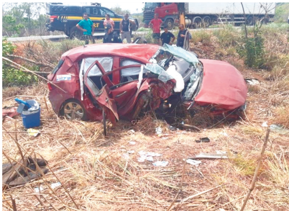
UMA IDOSA MORREU APÓS MOTORISTA PERDER CONTROLE E BATER EM UMA ÁRVORE

De acordo com relatórios divulgados pela Polícia Rodoviária Federal (Superintendência no Maranhão), das 00h do dia 30 de outubro até as 23h59 do dia 2 de novembro, ocorreram 11 óbitos nas rodovias federais que cortam o Maranhão. A Operação Finados, que ocorreu em todo o Brasil, por conta do feriadão, se revelou movimentado nas estradas maranhenses.