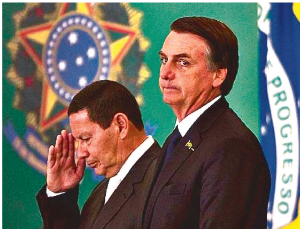
HAMILTON MOURÃO DISCORDOU DO PRESIDENTE JAIR BOLSONARO NA VACINA

O presidente tem se colocado contra a CoronaVac principalmente por conta da participação do governador de São Paulo, João Dória (PSDB), no processo de testagem do imunizante no país. “O que eu quis colocar (na entrevista) é o seguinte: a vacina é a vacina brasileira, produzida aqui no Brasil. Óbvio que o presidente vai tomar a decisão que for melhor para o conjunto da população brasileira, que é a responsabilidade dele. Vamos aguardar, essa vacina não é uma coisa tão sim-