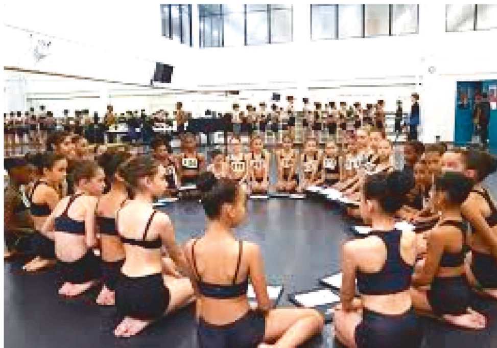
CHAMADA ESPECIAL É PARA BAILARINOS NASCIDOS ENTRE OS ANOS DE 2002 E 2008

A Chamada Especial, para bailarinos com conhecimento em dança, nascidos entre os anos de 2002 e 2008, também será feita por vídeo. Após a avaliação dos candidatas, o Núcleo Artístico da Escola Bolshoi entrará em contato com os pré-selecionados para agendar uma data durante o 1º semestre de 2021, para realizar a etapa presencial. Uma oportunidade imperdível para aqueles que sonham em se profissionalizar na carreira e dançar pelos palcos do Brasil e do mundo.