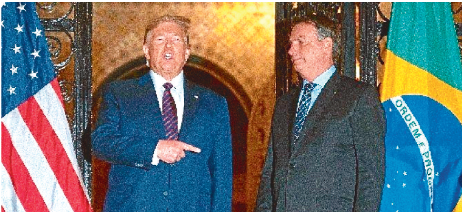
PRESIDENTE REFORÇOU TORCIDA POR DONALD TRUMP E ATACOU CANDIDATO DO PARTIDO DEMOCRATA

O presidente Jair Bolsonaro disse nesta quarta-feira (4) que está na torcida pela reeleição de Donald Trump como presidente dos Estados Unidos e alertou que eventual vitória de Joe Biden para a Casa Branca pode abrir espaço para uma interferência do governo norte-americano na política do Brasil.