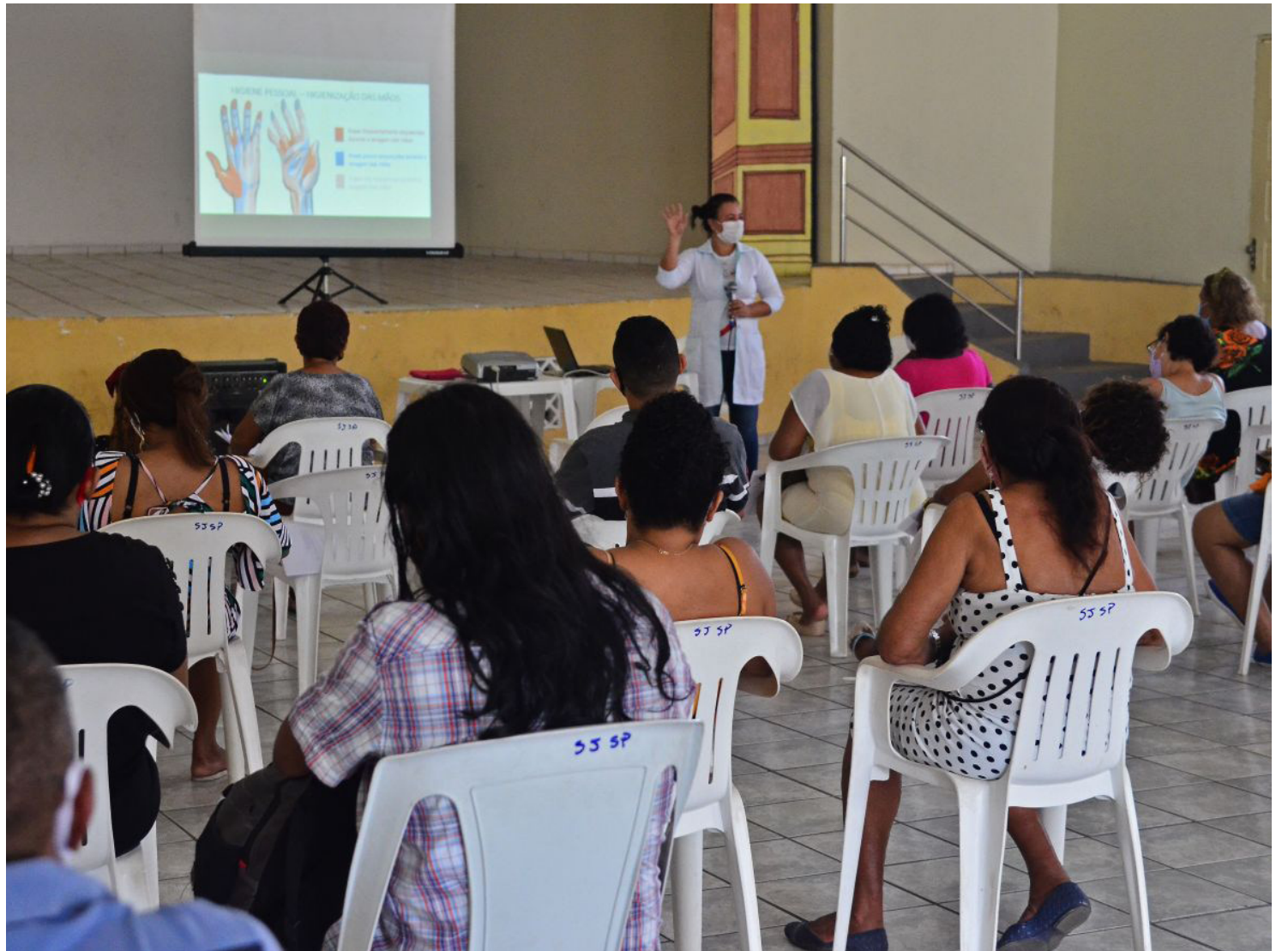
Entre os cursos ofertados estão qualificações nas áreas de empreendedorismo, qualidade no atendimento e boas práticas na área de alimentação

Com serviço de infraestrutura em ritmo acelerado, Fonte do Bispo deverá ser entregue pelo prefeito Edivaldo em dezembro; comerciantes do local participam de cursos voltados para o empreendedorismo, qualidade no atendimento e boas práticas na área de alimentação