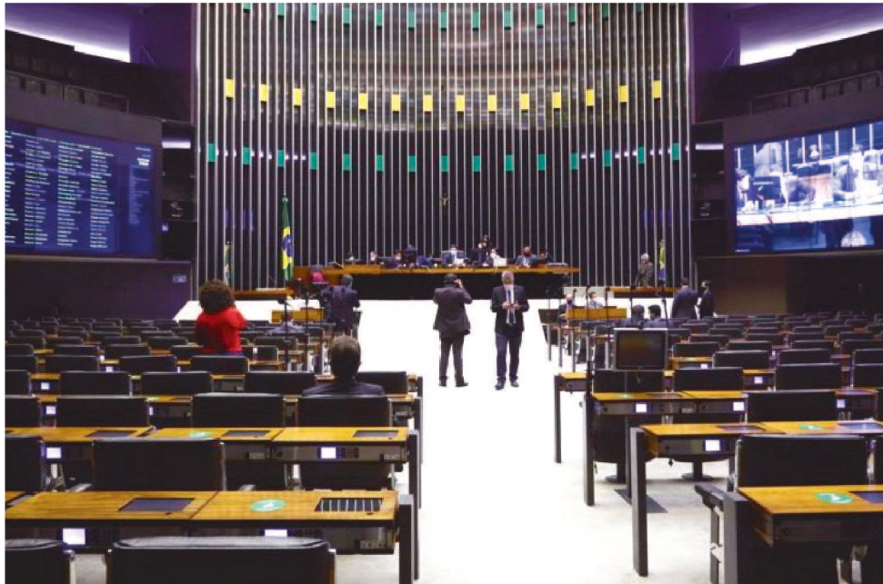
MEDIDA AINDA PRECISA SER VOTADA PELOS SENADORES

Como o Congresso está funcionando de forma remota, a sessão foi dividida em etapas. Após o encerramento da sessão com os deputados, haverá outra com os senadores, marcada para as 16h. Para as 19h, está prevista nova sessão com os deputados. A terceira sessão servirá para que a Câmara