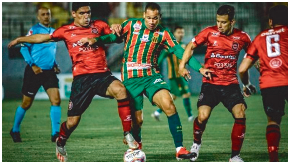
O SAMPAIO GARANTIU UM PONTO NA DISPUTA DO JOGO ATRASADO COM O BRASIL-RS