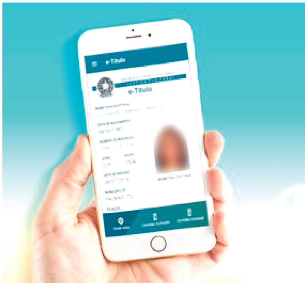
APÓS ATUALIZAÇÃO RECENTE, APLICATIVO PASSOU A APRESENTAR FOTO DO ELEITOR

seu domicílio eleitoral no dia da eleição poderão utilizar o e-Título para justificar sua ausência, por meio da geolocalização do aplicativo. Essa funcionalidade estará disponível somente no dia da eleição, das 7h às 17h. Para fazer a justificativa fora do dia da eleição, o eleitor poderá apresentar documento comprobatório que motivou a ausência (60 dias para justificar após cada pleito, ou 30 dias para justificar