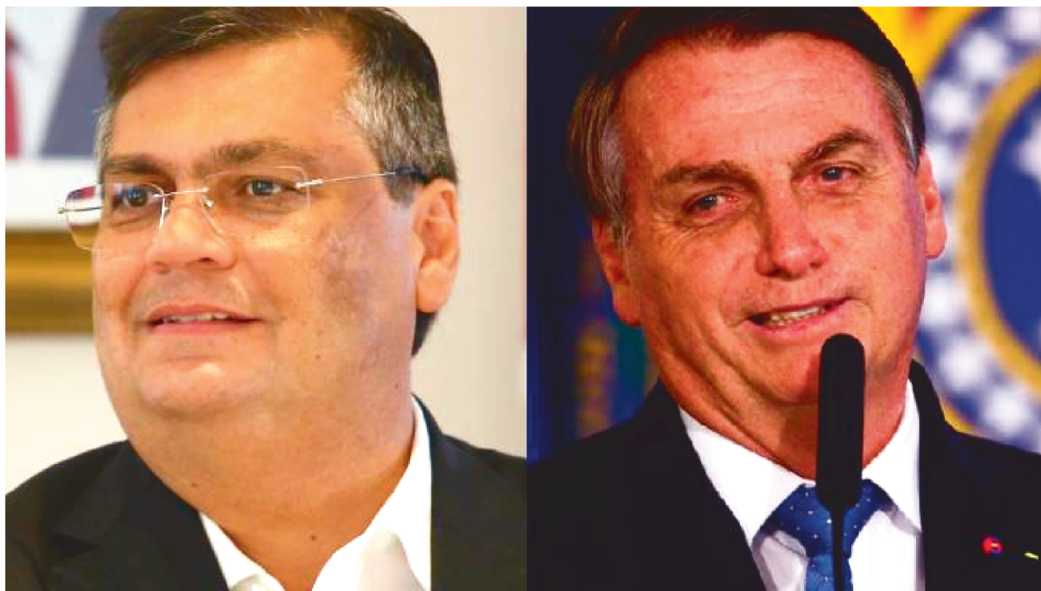
NO DESPACHO, O MINISTRO DO STF DÁ 15 DIAS PARA BOLSONARO APRESENTAR SUA MANIFESTAÇÃO SOBRE A QUEIXA DE DINO