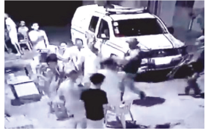
UM VÍDEO DA AÇÃO ESTÁ CIRCULANDO NAS REDES SOCIAIS

Na madrugada do último domingo, dia 29 de novembro, um jovem foi alvejado com um bala de borracha por um policial militar no município de Rosário, durante um atendimento de uma ocorrência.