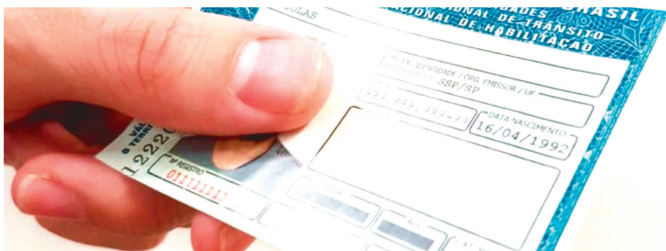
O DOCUMENTO DE HABILITAÇÃO VENCIDO EM 2020 DEVE SER ACEITO ATÉ O ÚLTIMO DIA DO MÊS CORRESPONDENTE EM 2021

Já está valendo, desde o início da semana, a resolução do Conselho Nacional de Trânsito (Contran) que altera os prazos para a regularização das carteiras nacionais de Habilitação (CNHs) vencidas.