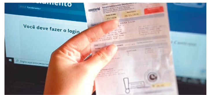
A CAMPANHA FOI PRORROGADA ATÉ O DIA 6 DE DEZEMBRO

A Equatorial Maranhão prorrogou até o dia 6 de dezembro a campanha Equatorial TA ON – Semana Fique em Dia, com facilidades para quitação de débitos aos clientes da concessionária. A ação foi iniciada no dia 22 de novembro e disponibiliza ofertas exclusivas para deixar as contas de energia em dia. Os consumidores podem aderir e ter 100% de desconto nos juros, multas, encargos por atraso e juros do parcelamento no cartão de crédito, somente no site da distribuidora www.equatorialenergia.com.br e aplicativo para smartphones, podendo a dívida ser parcelada em até 12 vezes nas bandeiras Visa, Master, Elo, Hipercard, Amex, Diners Club. Os clientes que possuem o cartão do Auxílio Emergencial, também podem efetuar o pagamento à vista através da bandeira Elo Débito com as mesmas facilidades. O objetivo desta campanha é auxiliar o cliente que ainda está sofrendo com os impactos econômicos e acabou acumulando as contas de energia.