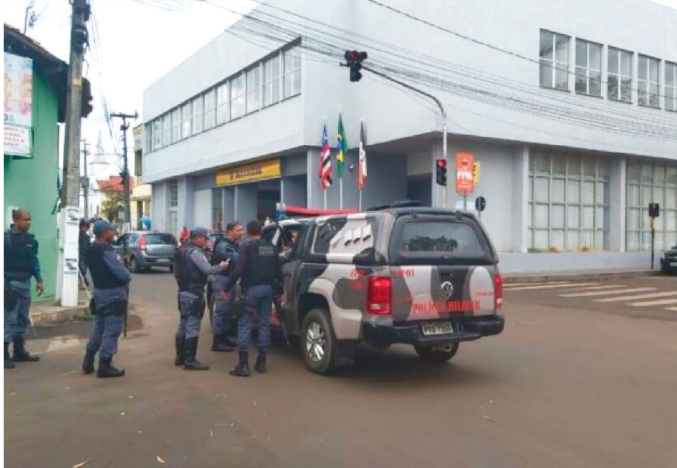
O ASSALTO AO BANCO DO BRASIL DE CODÓ ACONTECEU NO DIA 17 DE NOVEMBRO

De 2019 até novembro deste ano, o suspeito participou e planejou quatro assaltos, sequestros e explosão de bancos no Maranhão.