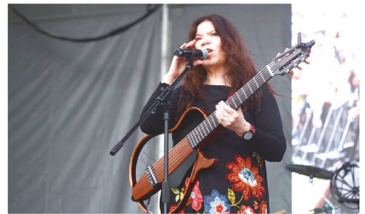
CHILENA TITA PARRA É UMA DAS ATRAÇÕES DO ANIVERSÁRIO

Pautada no conceito de redes colaborativas para construir um modelo singular que valoriza a economia solidária, a autonomia e a arte autêntica, o Casa d'Arte é certificado pelo Minc como Ponto de Cultura, que se articula para inspirar e ser referência em processos criativos e compartilhados em todas as áreas do saber.