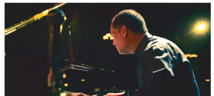
ADRIAN IAIES, DA ARGENTINA PARTICIPA DO FESTIVAL AO VIVO

Três apresentações exclusivas ao vivo – direto dos Estados Unidos, da Argentina e do Chile –, seis concertos e espetáculos realizados em Joinville, mas sem presença de público, transmitidos pelas redes sociais, e dois shows em sistema drive-in. Para completar, dois workshops e um curso, oportunizando aos músicos locais o contato com mestres do instrumento, sem custos. É o Pianístico 2020, terceira edição do festival que pretende transformar Joinville em ponto de referência na cultura do piano. A programação, de quinta, 3, a domingo, 6 de dezembro, poderá ser acompanhada pelo YouTube ou pela página do evento no Facebook. Idealizado em modelo misto, com parte aberta ao público, no teatro, seguindo as limitações vigentes para esse tipo de evento, o Pianístico irá se concentrar no digital – apenas o drive-in e as atividades de formação serão presenciais. A mudança, anunciada há poucos dias, deve-se ao aumento dos casos de coronavírus em Santa Catarina, nas últimas semanas.