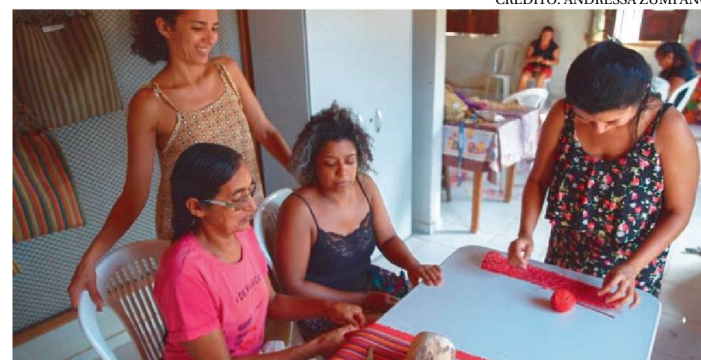
ARTISTAS COM ARTESÃS DA COMUNIDADE DE SANTA MARIA

"Casas" é uma residência artística e uma intervenção política na cidade de Alcântara, ao norte do Maranhão. Um projeto do Coletivo Linhas que registra a liderança feminina pela criatividade no manuseio de tecnologia tradicional e suas narrativas de vida e existência comunitária em Santa Maria, comunidade quilombola.