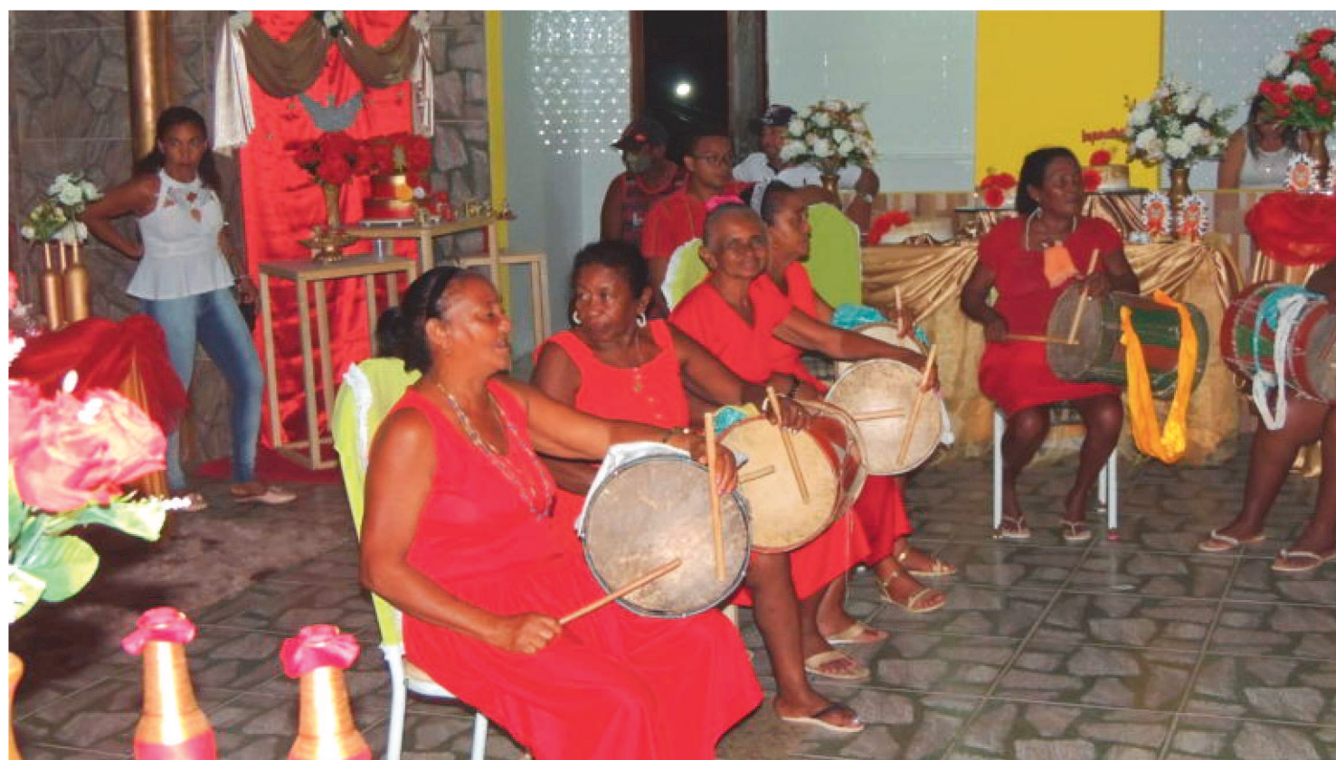
O CANTO, O BAILADO E A BATIDA DAS CAIXEIRAS DE SÃO JOÃO BATISTA FOI UMA DAS PROPOSTAS SELECIONADAS PARA APRESENTAÇÃO

O Ocupa CCVM recebeu 509 projetos vindos de todas as regiões do país. Foram selecionadas 28 propostas, contemplando artistas de 11 estados brasileiros. Entre as propostas selecionadas, há apresentações de canto e artes visuais/audiovisual indígenas, de artistas da cultura popular; exposições de artes visuais; mostras audiovisuais; shows; seminários, dentre outras linguagens contempladas.