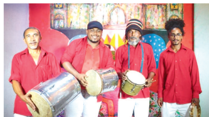
GRUPO AFOXÉ MINA SERÁ UMA DAS ATRAÇÕES DO FESTIVAL