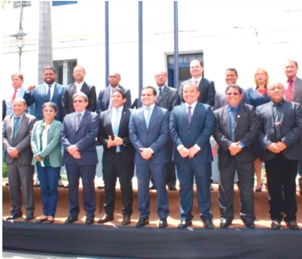
O EVENTO ACONTECE NA VILLA REALE BUFFET, HOJE A PARTIR DAS 19H

A medalha Simão Estácio da Silveira foi instituída pela Lei Orgânica do Município e regulamentada pela Resolução 05/95 do plenário. Maior e mais importante homenagem do Legislativo Municipal, é destinada às