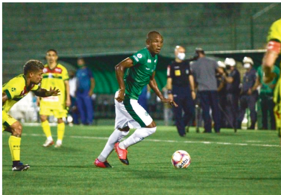
NO PRIMEIRO TURNO, AS EQUIPES EMPATARAM EM 1 X 1 NO ESTÁDIO BRINCO DE OURO