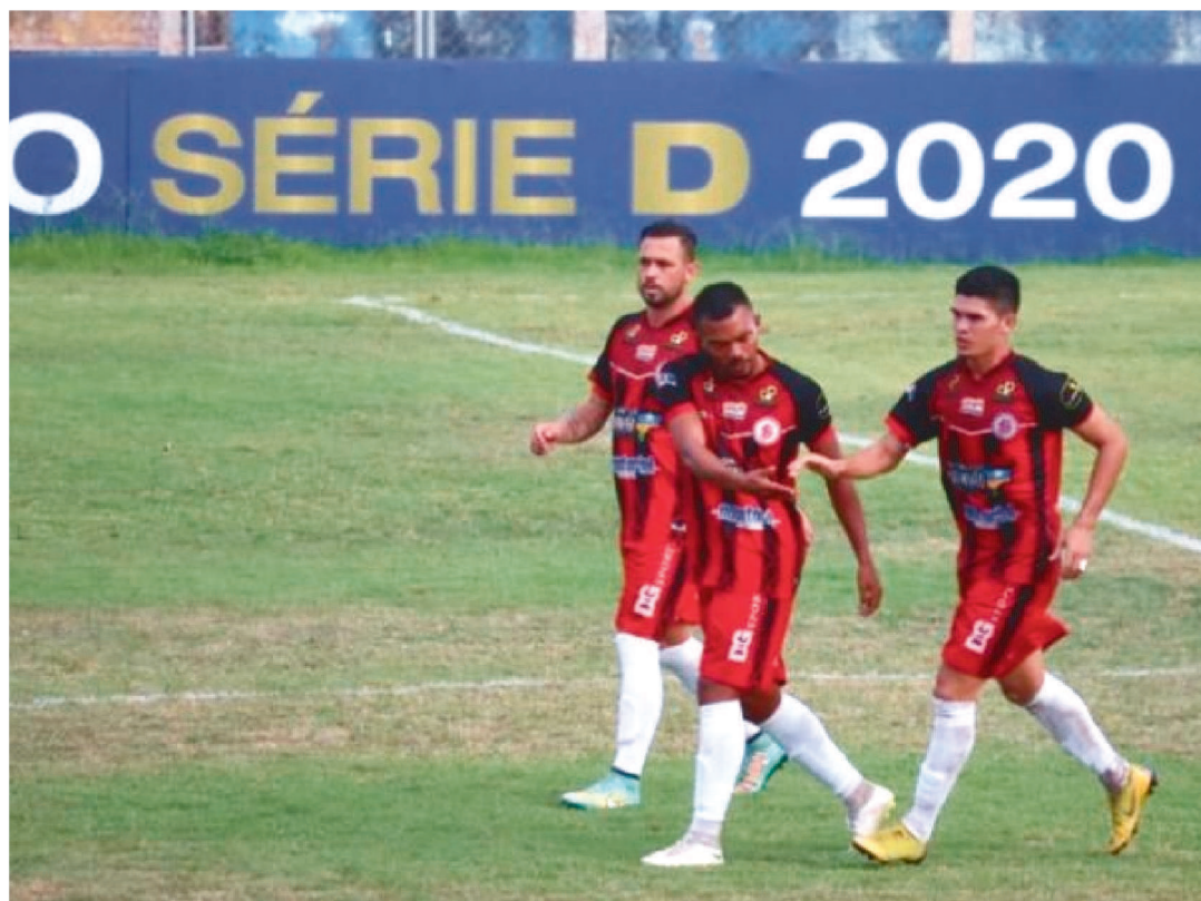
EM CASO DE NOVO EMPATE, A VAGA PARA AS QUARTAS-DE-FINAIS SERÁ DECIDIDA NOS PÊNALTIS

O empate por 2 a 2 com o Floresta-CE teve sentimento de derrota para os jogadores do Juventude, após a partida disputada no Estádio Pinheirão, pela Série D do Campeonato Brasileiro.