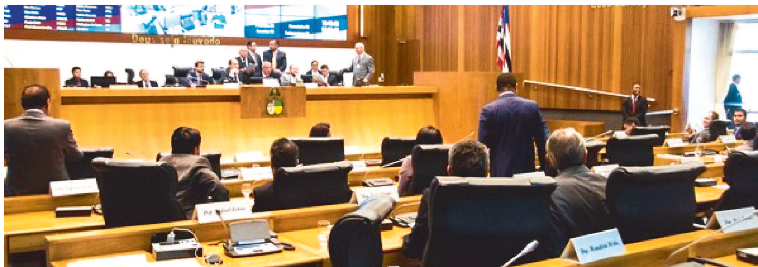
O SERVIÇO DE LOTERIA SERÁ EXPLORADO PELO EXECUTIVO, POR MEIO DA MARANHÃO PARCERIAS S/A (MAPA)

A Assembleia Legislativa do Maranhão aprovou, na sessão plenária desta, o Projeto de Lei 359/2020, de autoria do Poder Executivo, que reinstitui o serviço público de Loteria no Estado do Maranhão. A matéria aprovada seguiu à sanção do governador Flávio Dino (PCdoB).