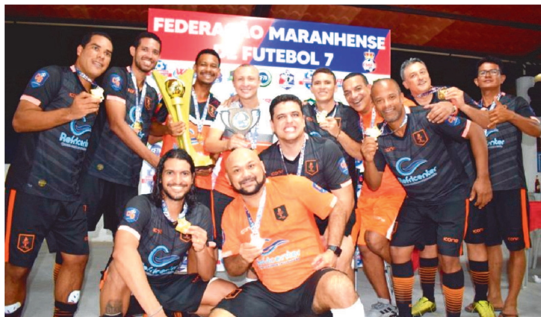
O TIME DA OLÍMPICA FOI CAMPEÃ NA CATEGORIA +30 DA COPA PAPAÍ BOM DE BOLA

As equipes do Olímpica e da AABB/Meninos de Ouro foram as grandes campeãs da primeira edição da Copa Papai Bom de Bola, nas categorias +30 e +40, respectivamente. As finais do torneio promovido pela Federação Maranhense de Futebol 7 (FMF7) foram realizadas no sábado (19), na Arena Olynto, no bairro do Olho d'Água.