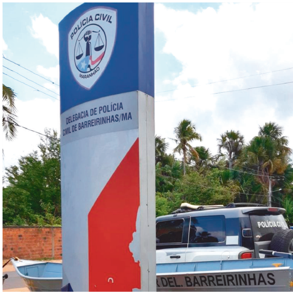
UM DOS CASOS FOI INVESTIGADO PELA DELEGACIA REGIONAL DE BARREIRINHAS

De acordo com a investigação da Delegacia Especial da Mulher de Pinheiro, o suspeito teria pego a vítima e