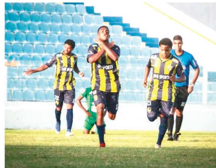
A PARTIDA FINAL SERÁ NO ESTÁDIO NHOZINHO SANTOS