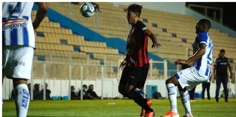
A PRIMEIRA PARTIDA TERMINOU EMPATADA SEM GOLS NO ESTÁDIO NHOZINHO SANTOS