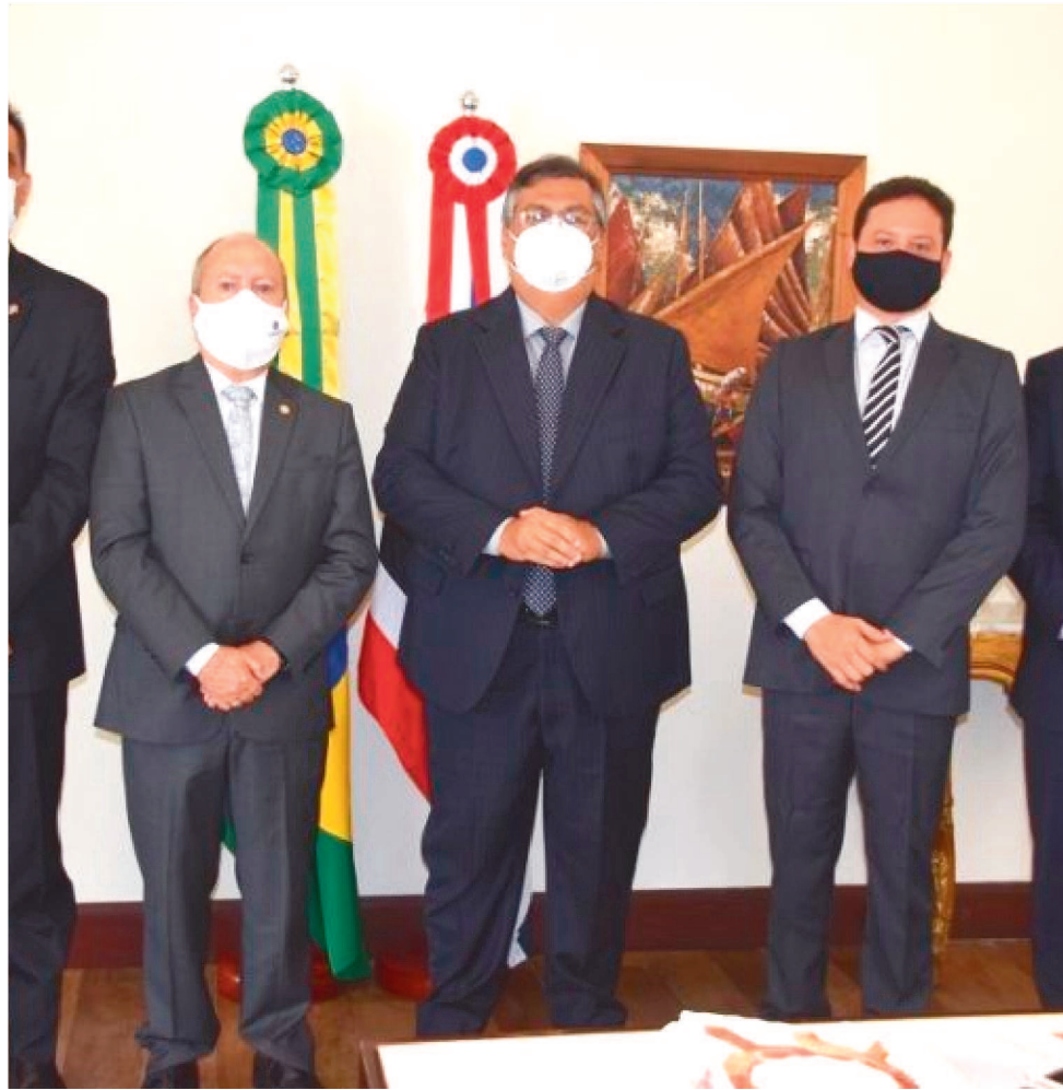
PARA O GOVERNADOR, SÃO TEMAS IMPORTANTES AOS INTERESSES DA POPULAÇÃO.

No encontro, eles dialogaram ainda sobre as decisões recentes adotadas pelo Governo do Estado como a suspensão das festas de carnaval e as novas medidas da campanha estadual de vacinação – que inclui, além dos profissionais da saúde, pacientes em