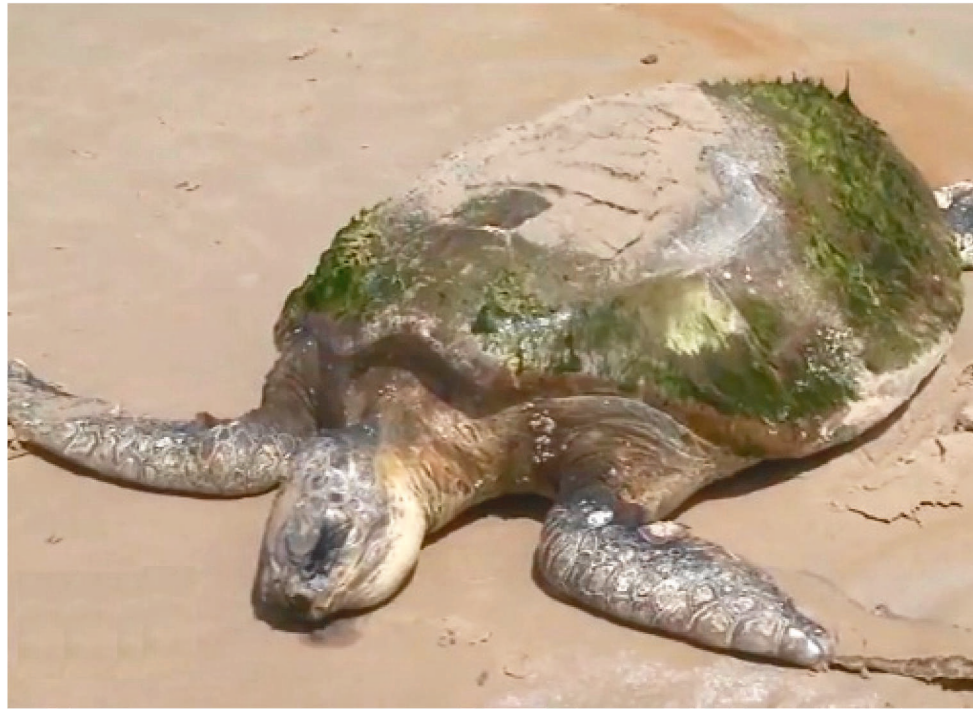
TARTARUGA FOI ENCONTRADA NA PRAIA DE SÃO MARCOS NOS PRIMEIROS DIAS DE 2021

De acordo com Instituto Chico Mendes de Conservação da Biodiversidade (ICMBio), pescadores que encontram o animal, afirmaram que ele estava com hematomas na nadadeira