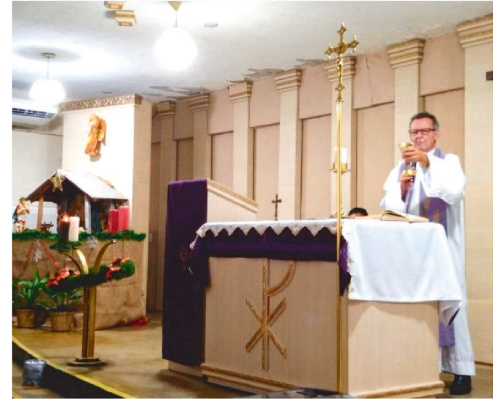
A CELEBRAÇÃO DESTE ANO NÃO TERÁ MOMENTO FESTIVO

Com essas palavras de encorajamento de sua padroeira, a Paróquia Santa Paulina, localizada no Residencial Pinheiros, celebrará seus 9 anos, no próximo dia 28, quinta-feira, às 19h30, com uma Missa em Ação de Graças, em meio à pandemia mundial de covid19.