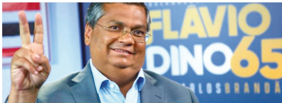
FLÁVIO DINO DESPONTA COMO FAVORITO PARA A VAGA DO SENADOR ROBERTO ROCHA

No primeiro momento, segundo uma fonte próxima do governador, a prioridade partidária é o PCdoB, cuja legenda, a exemplo de outras 14, não resistirá por muito tempo isolado, em razão da cláusula de barreira. Esse é uma diapasão dentro do qual, Flávio Dino terá que tocar o governo em 2021, ao mesmo tempo em busca ampliar a articulação política para seguir o caminho da fusão do PCdoB com outras legendas do campo de esquerda, ou simplesmente trocar de partido. Essa tese, porém, é pouco provável, já que não existem legendas entre as nanicas de esquerda que não estejam atadas à mesma cláusula de barreira, exceto o PT, partido no qual ele iniciou sua militância política na ju-