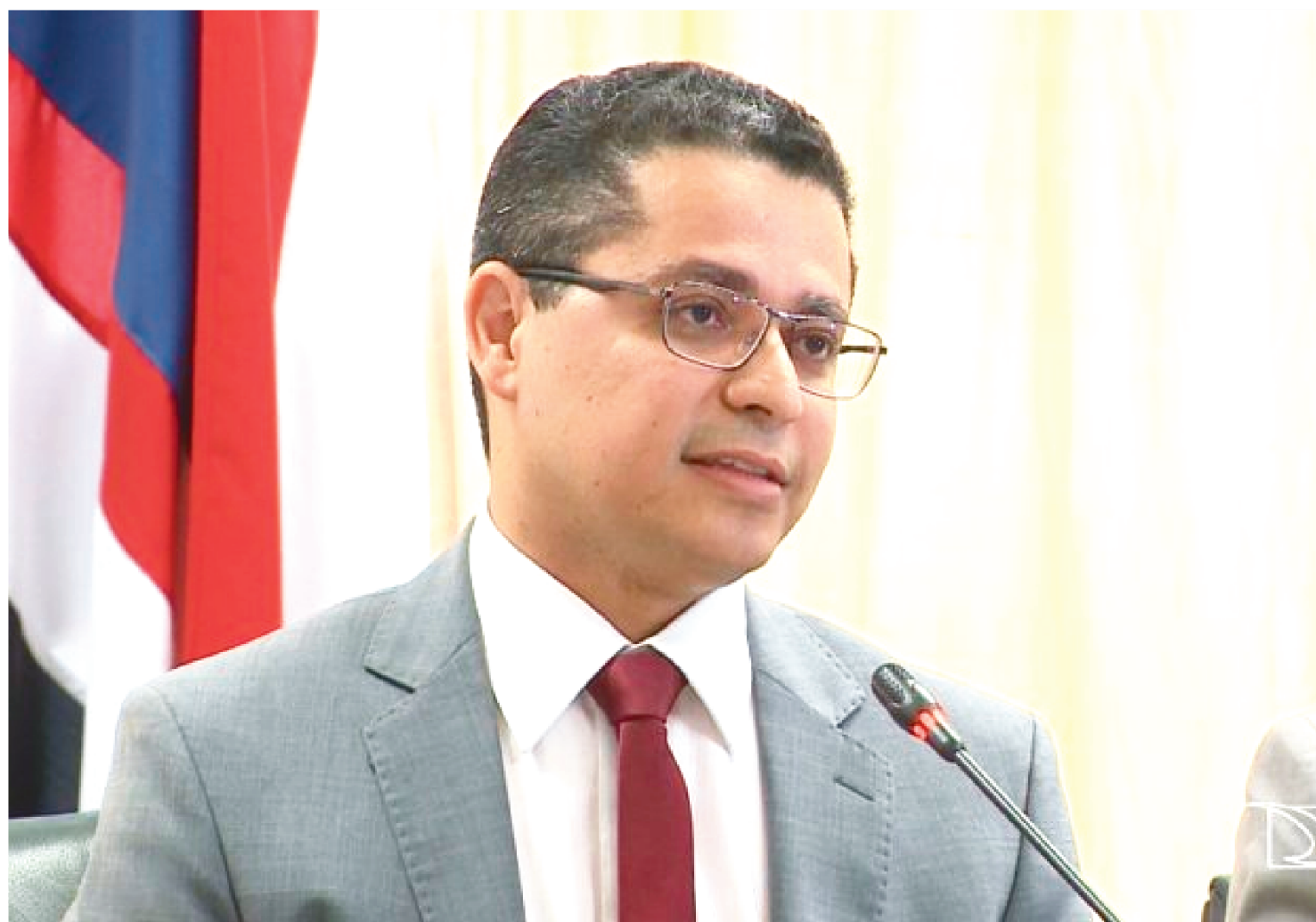
DIANTE DE INÚMERAS MANIFESTAÇÕES POR PARTE DO SEGMENTO DE EVENTOS, CARLOS LULA ANUNCIOU RECUO NA NOITE DE ONTEM.

No final da noite de ontem, o Governo do Estado do Maranhão desistiu de suspender a Portaria nº 55/2020, que liberava a realização de pequenos eventos.