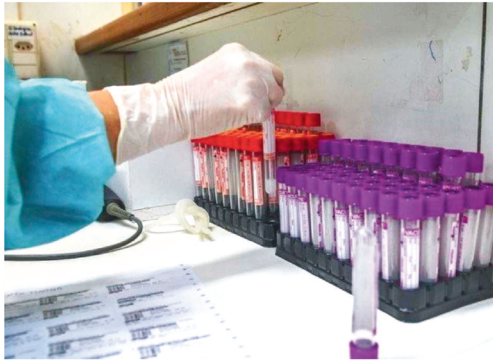
O TESTE POPULAR DE COVID-19 SERÁ ENVIADO PARA A APROVAÇÃO DA ANVISA