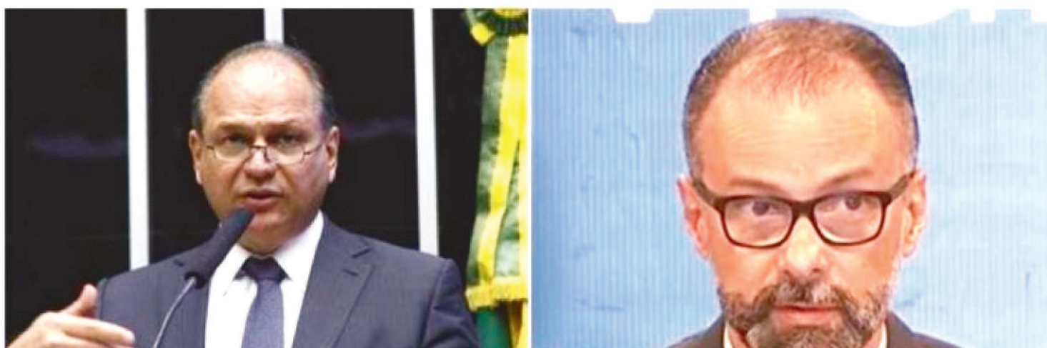
RICARDO BARROS, LÍDER DO GOVERNO NA CÂMARA, E ANTÔNIO BARRA TORRES, PRESIDENTE DA ANVISA

A polêmica entre o líder do governo na Câmara, deputado Ricardo Barros (PP-PR), e o presidente da Anvisa, Antônio Barra Torres, é a primeira queda de braços entre os políticos do Centrão e os militares do governo Bolsonaro após a eleição do novo presidente da Câmara, Arthur Lira (PP-AL).