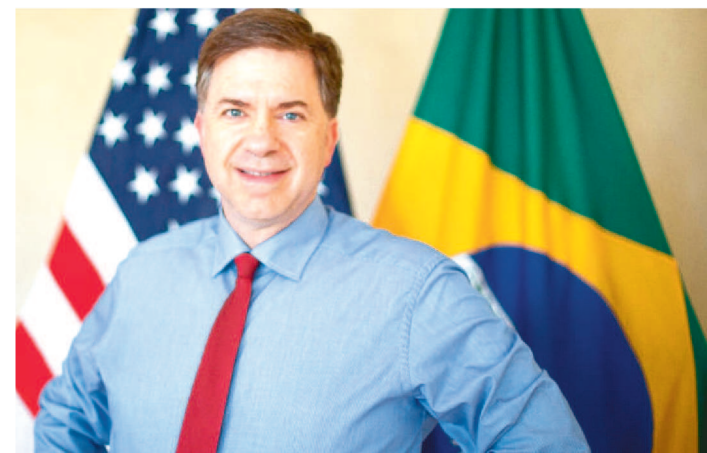
EMBAIXADOR TODD CHAPMAN SE REÚNE COM O FLÁVIO DINO

Os Estados Unidos da América, através do Comando Sul do Departamento de Defesa, doou para o governo do Maranhão uma estrutura para a montagem de um hospital de campanha que contará com tendas para 40 leitos, geradores de energia e quatro ventiladores. Uma delegação do Departamento de Defesa dos EUA está no estado para treinar a equipe da Defesa Civil que vai gerenciar o uso do material.