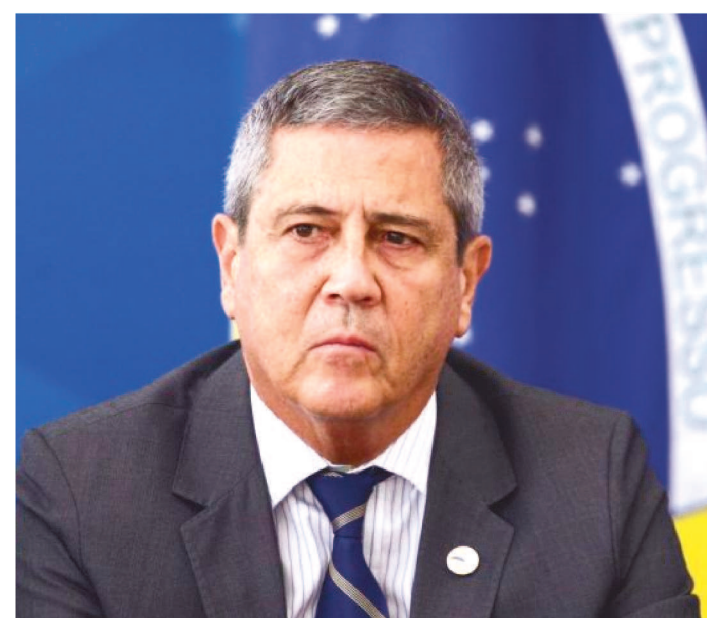
MINISTRO BRAGA NETTO DEVE COMANDAR AÇÕES

O presidente Jair Bolsonaro determinou ao ministro-chefe da Casa Civil, Walter Braga Netto, que articule ações extras em apoio aos estados para combater à pandemia do novo coronavírus (covid-19). O despacho foi publicado hoje (8) no Diário Oficial da União.