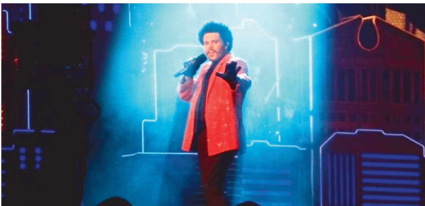
O PREFEITO DE TORONTO, JOHN TORY, DECRETOU QUE 7 DE FEVEREIRO SERÁ OFICIALMENTE O DIA DO THE WEEKND NA CIDADE

Um dos cantores mais relevantes de 2020, The Weeknd foi o artista responsável pelo show do intervalo durante a 55ª edição do Super Bowl. Neste domingo (7/2), o cantor tomou os palcos do Raymond James Stadium, em Tampa Bay, e, durante 13 minutos, relembrou os maiores sucessos da carreira.