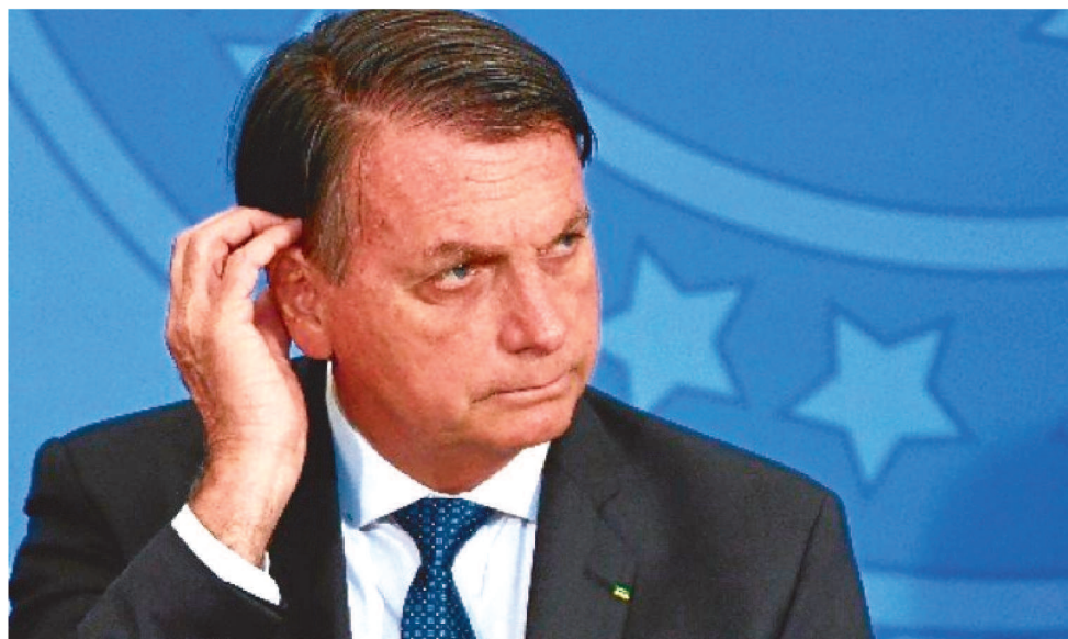
PRESIDENTE BOLSONARO SOLTU INDIRETA SOBRE PEDIDO DE IMPEACHMENT

Bolsonaro comemorou o resultado das eleições no Congresso e fez novas críticas ao ex-presidente da Câmara, Rodrigo Maia (DEM-RJ), caracterizando-o como a encarnação da opo-