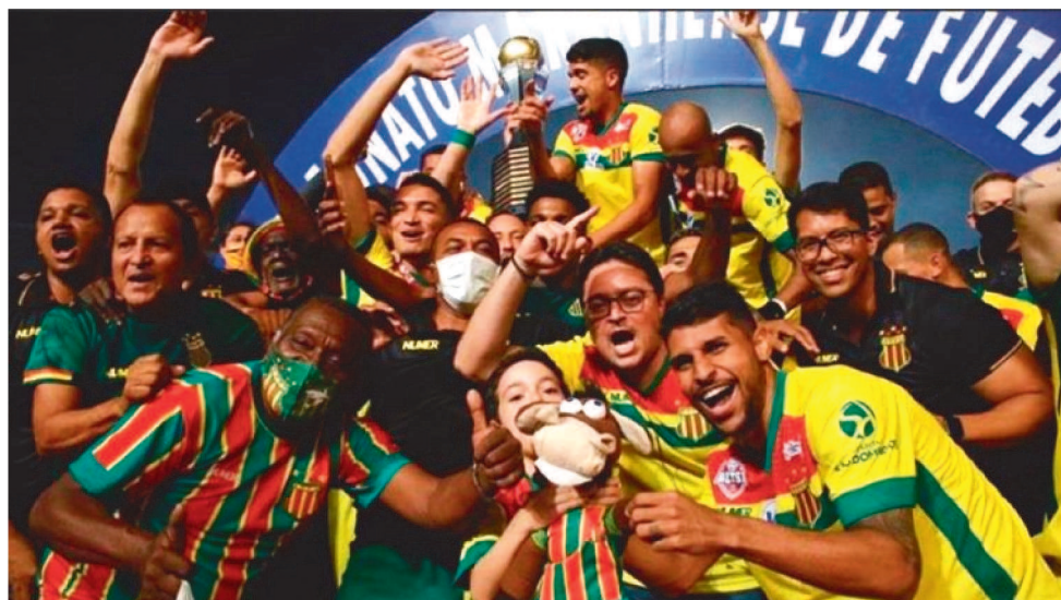
SAMPAIO FOI A EQUIPE QUE MAIS CONTRATOU JOGADORES DE FORA: 34 ATLETAS

da torcida maranhense é quanto ao aproveitamento técnico dos clubes nas competições nacionais, pois deles dependem o número de vagas na Série D e Copa do Brasil.