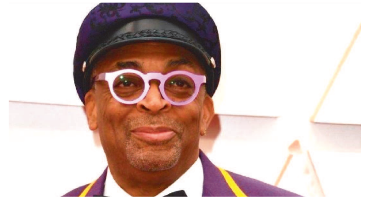
SPIKE LEE ESTÁ ENTRE OS DIRETORES DESTACADOS

Uma dose de reparação nas indicações a recentes prêmios de cinema ocupou destaque no anúncio dos candidatos selecionados por críticos para a 26ª edição Critics Choice Awards. Numa lista mais abrangente, com direito, por exemplo, a 10 títulos candidatos a melhor filme, o corpo de jurados pode incluir, entre sete diretores destacados, nomes como Lee Isaac Chung e Spike Lee.