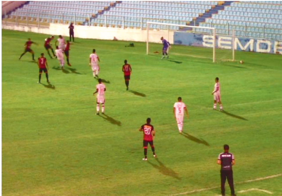
O MOTO CLUB VEM DE DUAS VITÓRIAS NO CAMPEONATO MARANHENSE 2021