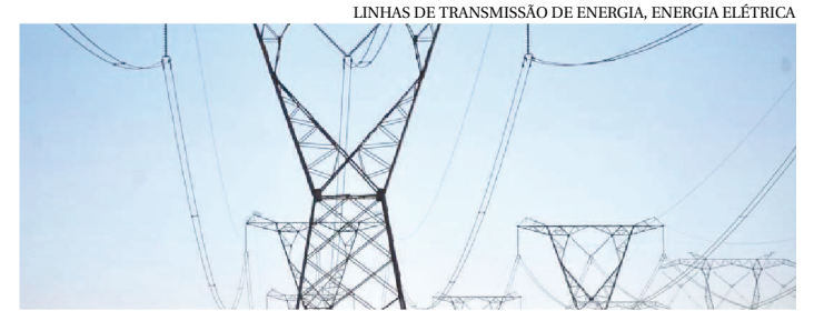
LINHAS DE TRANSMISSÃO DE ENERGIA ELÉTRICA

A Agência Nacional de Energia Elétrica (Aneel) informou que a bandeira tarifária permanecerá amarela no mês de março. Dessa forma, o consumidor pagará R$1,343 para cada 100kWh utilizados.