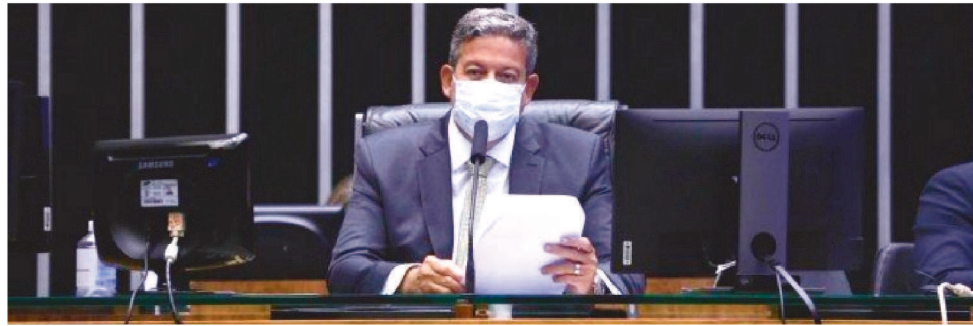
SENADOR ARTHUR LIRA TENTOU O AJUSTE DO TEXTO ATÉ O ÚLTIMO MINUTO

O presidente da Câmara fez uma retrospectiva do caso, intimamente ligado à PEC que, no entanto, surpreendeu líderes por ter sido criada em tempo recorde e enviada a plenário sem passar por uma comissão especial e pela Comissão de Constituição, Cidadania e Justiça (CCJ), a uma se-