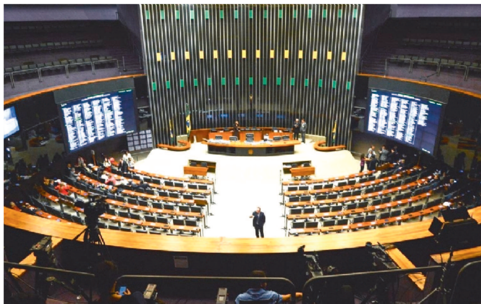
APENAS QUATRO DEPUTADOS MARANHENSES FORAM CONTRA O PROJETO

qualquer deputado que perder uma votação, vai ter descontado do salário um dia de trabalho. Tudo para completar o quórum governista de 308 votos. Quem está decidido a votar contra, vota", disse o deputado federal. Também votaram contra texto do projeto de lei que dificulta a prisão de parlamentares, os deputados federais maranhenses Josivaldo JP (Podemos), Marreca Filho (Patriota) e Zé Carlos (PT). A matéria passou na tarde de sexta-feira (26) por análise do mérito. Até o fechamento desta edição a pauta ainda não havia tido modificações até nova votação, e esse resultado de hoje praticamente será o posicionamento final de cada parlamentar, principalmente da bancada maranhense.