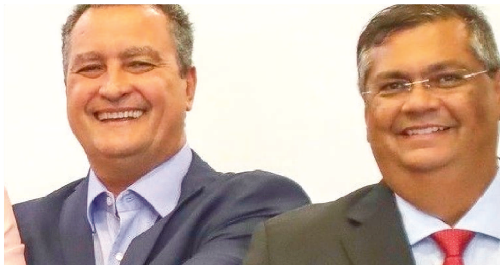
RUI COSTA, GOVERNADOR DA BAHIA, E FLÁVIO DINO, GOVERNADOR DO MARANHÃO

Dino comenta que a publicação contém repasses para municípios e estados juntos e inclui, erroneamente, valores relacionados a fundos nos quais o governo é “mero repassador”.