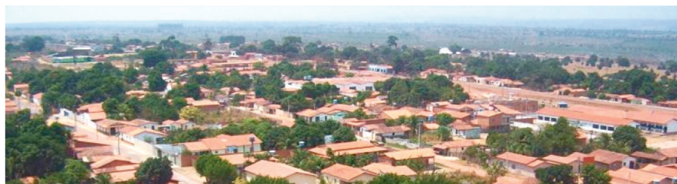
ALÉM DA CAPITAL, APENAS BOM JESUS DAS SELVAS ESTÁ NO CONSÓRCIO NACIONAL

Desde o anúncio, diversas capitais manifestaram interesse, portanto, a inclusão de São Luís na lista dos municípios não é nenhuma surpresa, mas o nome de Bom Jesus das Selvas,