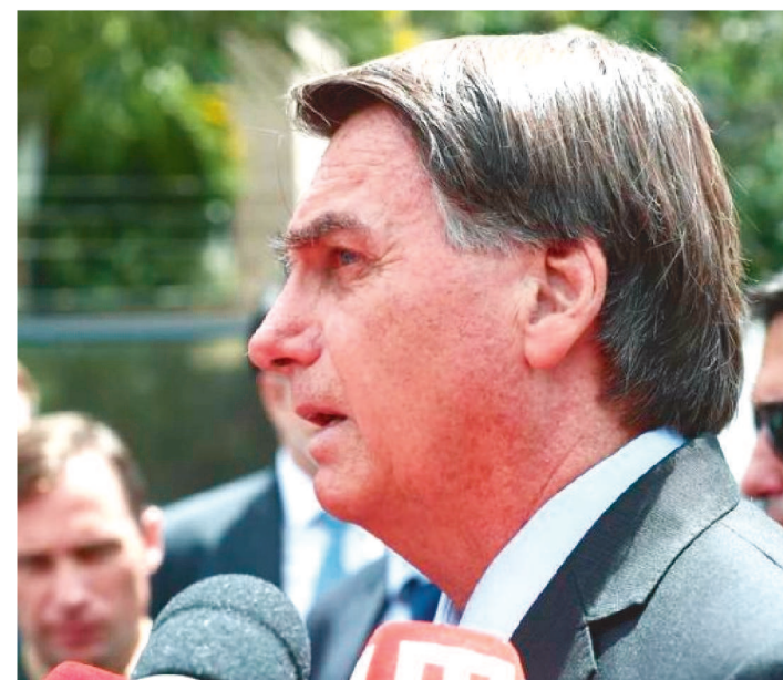
PRESIDENTE JAIR BOLSONARO FALOU DAS FINANÇAS

O presidente Jair Bolsonaro (sem partido) disse, nesta quarta-feira (03/03), que não tem dinheiro em caixa para o pagamento do auxílio emergencial. A declaração foi feita após almoço com embaixadores de países do Golfo.