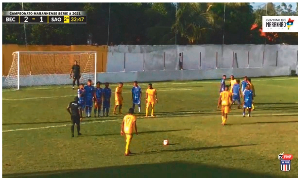
O BACABAL VENCEU O SÃO JOSÉ POR 2 X 1, NO ESTÁDIO PINHEIRÃO, EM SÃO MATEUS