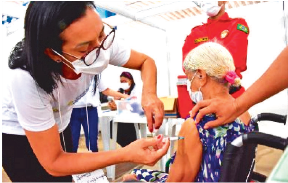
IDOSOS E PROFISSIONAIS DE SAÚDE AINDA ESTÃO SENDO VACINADOS NA CAPITAL

Das cidades maranhenses, 6 ainda não atingiram o percentual de 70% de