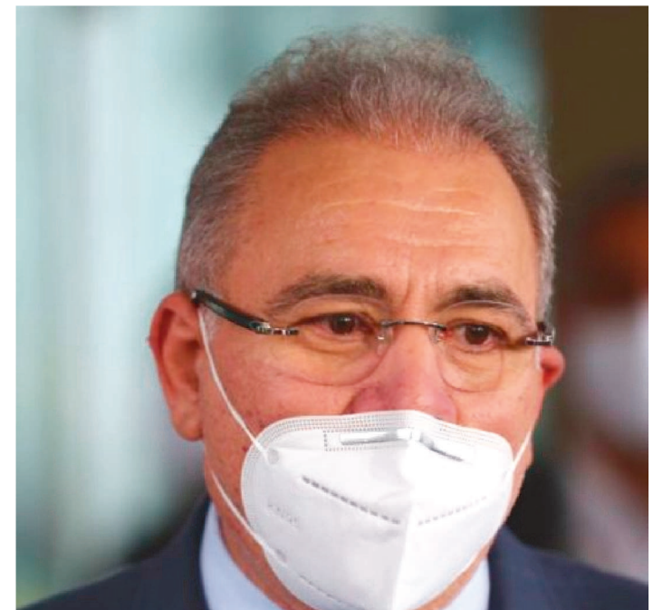
NOVO MINISTRO DA SAÚDE, MARCELO QUEIROGA

O presidente da comissão temporária da covid-19, senador Confúcio Moura (MDB-RO), anunciou que o novo ministro da saúde, Marcelo Queiroga, será ouvido no dia 25, em uma sessão de debates temáticos sobre o enfrentamento à pandemia no plenário da Casa. Em sessão remota ontem os senadores aprovaram um convite para ida do novo ministro da Saúde à Casa.