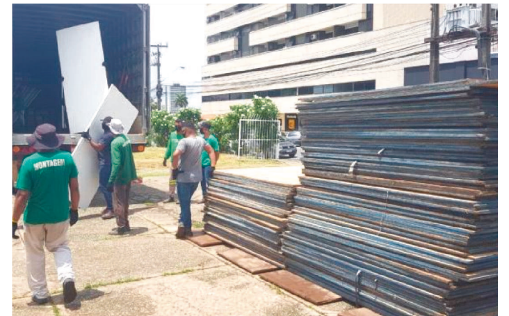
O HOSPITAL SERÁ INSTALADO NO BAIRRO DO RENASCENÇA

O governo do estado começou a instalação do Hospital de Campanha em São Luís para o ajudar no enfrentamento da pandemia do novo coronavírus. A unidade terá 80 leitos, sendo 70 de enfermagem e 10 de UTI. A estrutura será montada no Espaço Renascença, próximo ao hospital Carlos Macieira.