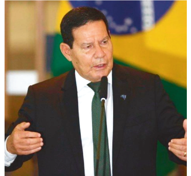
VICE-PRESIDENTE COMENTOU MUDANÇA NO MINISTÉRIO

O vice-presidente Hamilton Mourão afirmou que o ministro da Saúde apenas cumpre as decisões do presidente. Portanto, segundo ele, Jair Bolsonaro “é o responsável por tudo o que aconteça ou deixe de acontecer”.