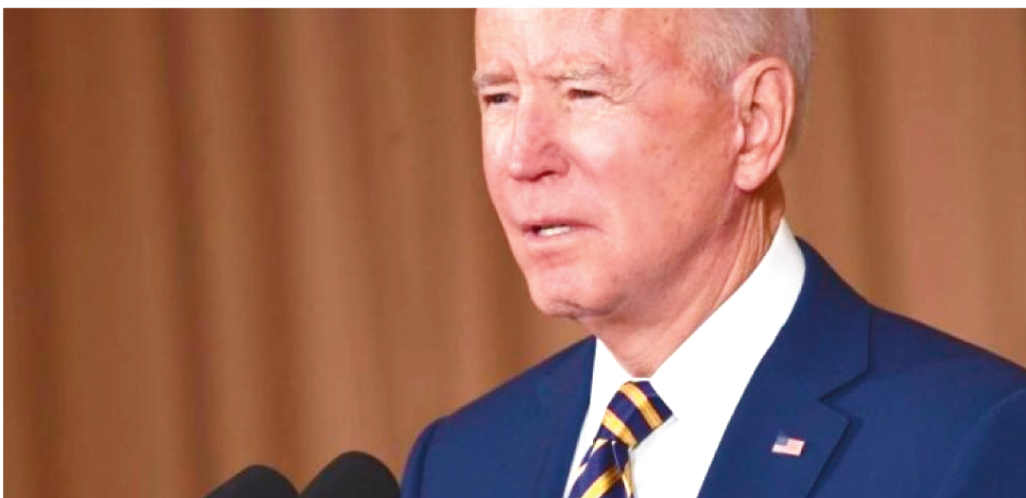
BIDEN ROMPEU UM PRECEDENTE AO ESPERAR TANTO TEMPO PARA DAR À IMPRENSA A OPORTUNIDADE DE LHE FAZER PERGUNTAS

O presidente Joe Biden irá conceder sua primeira entrevista coletiva formal desde que assumiu o cargo na próxima semana, anunciou a secretária de imprensa da Casa Branca, Jen Psaki, ontem.