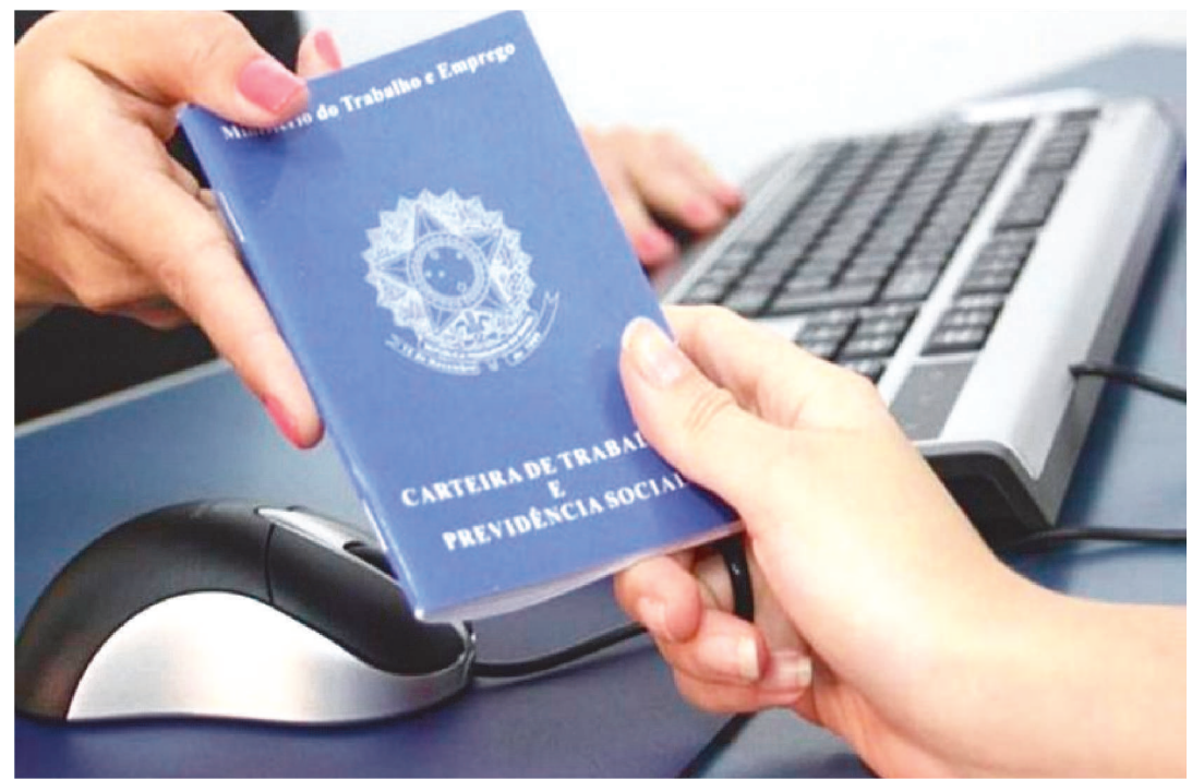
AS VAGAS OFERECIDAS SÃO PARA VÁRIOS CARGOS E POSTOS DE TRABALHO NA CAPITAL