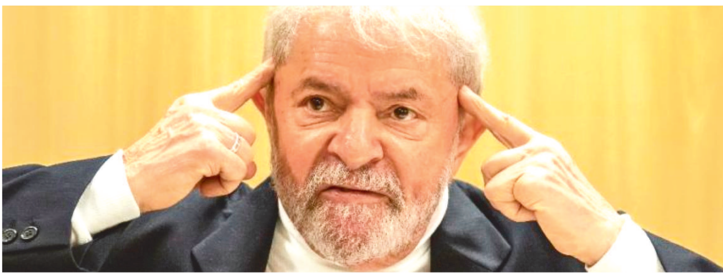
FHC CITOU O EFEITO DA ANULAÇÃO DAS CONDENAÇÕES DE LULA PELO MINISTRO EDSON FACHIN, DO SUPREMO TRIBUNAL FEDERAL