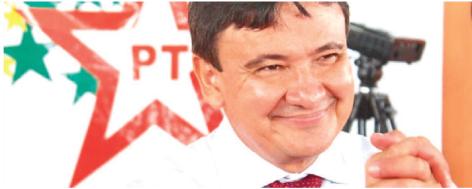
GOVERNADOR DO PIAUÍ FOI O ESCOLHIDO POR LULA PARA DIALOGAR COM PSDB

Na quarta-feira, 10, o ex-presidente aconselhou o partido a repensar os encontros eleitorais que havia autorizado o ex-prefeito de São Paulo Fernando Haddad a cumprir. Candidato ao Planalto derrotado em 2018, ele já