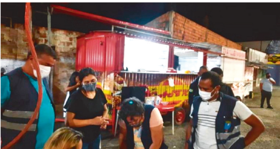
21 ESTABELECEMENTOS FORAM AUTUADOS POR ESTAREM EM DESACORDO COM OS DECRETOS

Desde do dia 3 de março, quando foi publicado o Decreto Estadual nº 36.582 e Municipal nº 56.887/21, que estabelecem as diretrizes para conter o avanço dos casos de Covid-19 na Grande Ilha, lojas e estabelecimentos comerciais têm sido fiscalizados diariamente, visando garantir o cumprimento das medidas sanitárias estabelecidas.