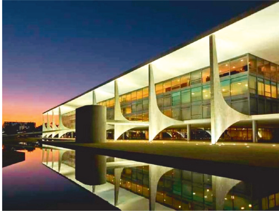
O PALÁCIO DO PLANALTO É A “MENINA DOS OLHOS” DOS PRESIDENCIÁVEIS EM 2022

Hoje, tanto Dino mantém a posição sobre a situação democrática do Brasil, quanto ao agravamento da crise pandêmica do coronavírus e suas mutações se espalhando de forma devastadora pelo país. Ele e seus demais colegas governadores dos estados estão no epicentro do furacão da crise, en-