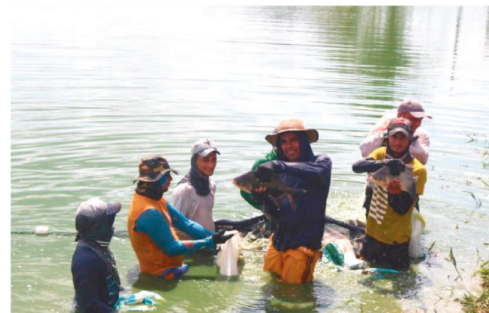
AS VENDAS DE PESCADO NO ESTADO TIVERAM ICMS REDUZIDO

O Governo do Estado, por meio do Decreto 36.650/2021, reduziu de 4% para 1% a carga tributária do ICMS incidente sobre as vendas internas de pescado. Com a medida, o Estado pretende reduzir o preço do produto na mesa dos maranhenses e estimular o consumo dessa importante proteína. Outras importantes proteínas, a carne bovina e bubalina, já desfrutam da carga de 1% do ICMS.