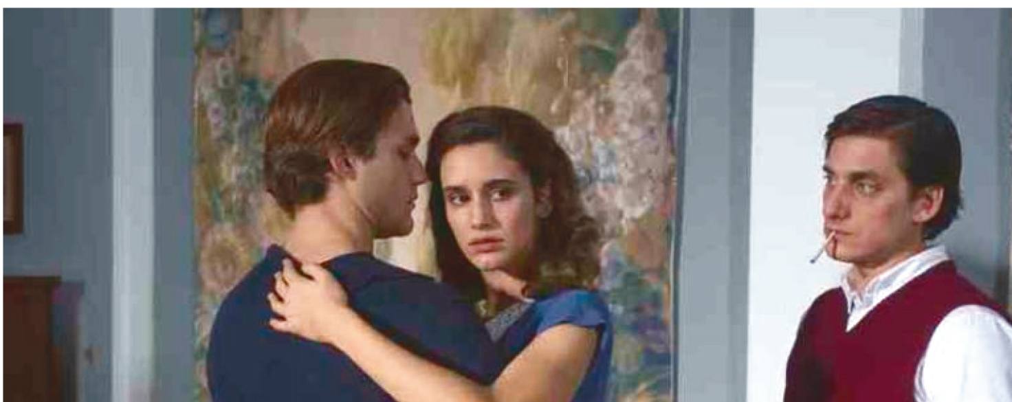
“UMA QUESTÃO PESSOAL”, DOS IRMÃOS TAVIANI, ESTÁ NO CATÁLOGO DA SUPO MUNGAM PLUS, LANÇADA EM DEZEMBRO PASSADO

Um cinema de rua que exhibe filmes independentes não tem condições de brigar com o de shopping, que arrasta multidões para ver produções de super-heróis. Isso na época em que havia salas abertas. No mundo da pandemia, em que o consumo audiovisual transferiu-se para o streaming, embate semelhante, à moda Davi x Golias, continua ocorrendo.