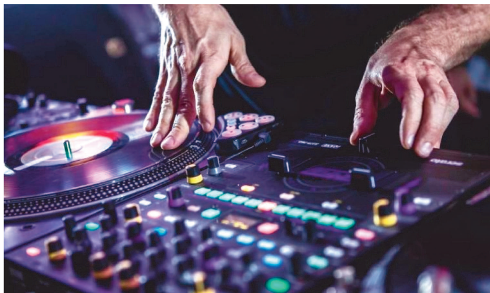
AUXÍLIO EMERGENCIAL DO SETOR DE EVENTOS SERÁ PAGO EM COTA ÚNICA DE R$ 600

De acordo com a Medida Provisória (MP) nº 345/2021, que autoriza a concessão do benefício, são considerados trabalhadores de eventos os produtores, promotores (pessoa física), garçons, garçonetes, barmen, barwomen e bartenders, decoradores e floristas, boleiras (os), doceiras (os) e cozinheiras (os), além de cerimonialistas, fotógrafos, membros da produção técnica