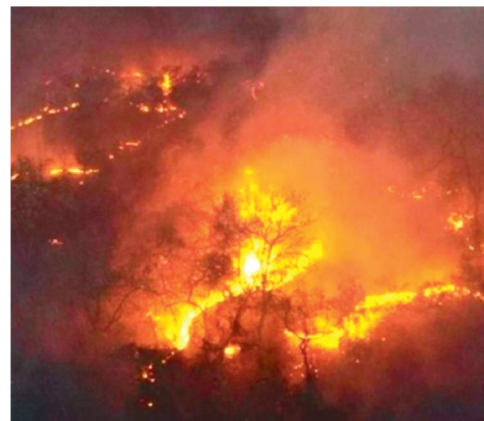
OS FOCOS DE QUEIMADA REDUZIRAM 9,2% NO ANO DE 2020

No Maranhão os focos de queimada tiveram uma diminuição de 9,2% no ano de 2020, em comparado ao ano anterior, sendo esse o segundo menor quantitativo de focos da década, segundo os dados do Instituto Maranhense de Estudos Socioeconômicos e Cartográficos (IMESC).