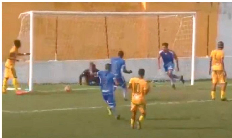
O BACABAL VENCEU O SÃO JOSÉ POR 2 X 1, NO DIA 27 DE FEVEREIRO PELO ESTADUAL