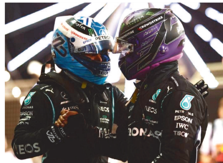
HAMILTON E BOTTAS SÃO COMPANHEIROS DESDE 2017

Protagonista de uma intensa rivalidade com Nico Rosberg entre 2013 e 2016, Lewis Hamilton nunca escondeu que vive uma relação tranquila com seu atual colega de equipe na Mercedes, Valtteri Bottas. O heptacampeão chegou a defender o finlandês da pressão que enfrenta e, ao comentar novamente sobre a convivência da dupla, apontou para a franqueza e a estabilidade que a dupla compartilha. “Qual é a melhor coisa em ser meu companheiro de equipe? Sem besteiras? Não conversar muito?”, perguntou Bottas.