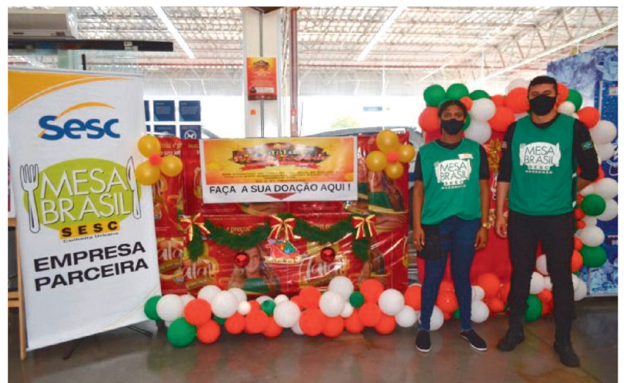
Cumprindo a agenda solidária anual, o Instituto GPA (Grupo Pão de Açúcar) realiza até o dia 31 de maio, a Campanha de Solidariedade 2021, com o objetivo de sensibilizar clientes, colaboradores e fornecedores a doarem alimentos não perecíveis nos pontos de arrecadação localizados nas lojas Guajajaras e Turu. Podem ser doados ao programa, arroz, feijão, macarrão, leite em pó, óleo e açúcar. O Mesa Brasil Sesc irá receber as doações feitas no Assai Atacadista, beneficiando comunidades carentes atendidas pelas 86 entidades sociais cadastradas no programa.