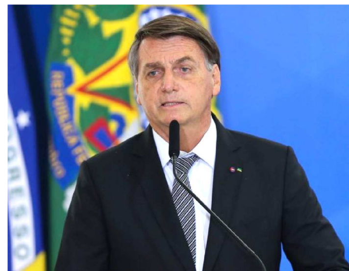
JAIR BOLSONARO SANCIONOU LEI QUE ESTENDE ATÉ 2021

O presidente Jair Bolsonaro sancionou a lei complementar que estende até o fim de 2021 a autorização concedida a estados, Distrito Federal e municípios a utilizarem, em serviços de saúde, “saldos financeiros remanescentes de repasses do Ministério da Saúde referentes a exercícios anteriores destinados aos fundos de saúde”.