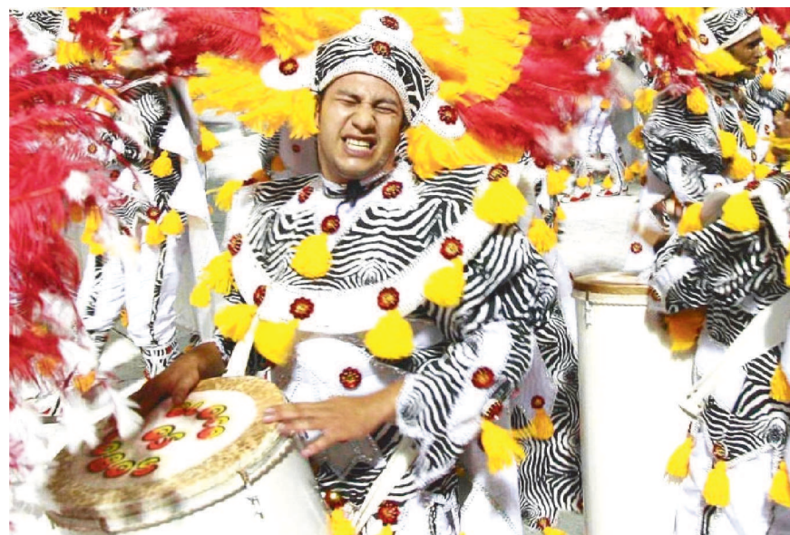
O Dia Municipal dos Blocos Tradicionais foi instituído pela Câmara de São Luís, por meio da Lei Municipal nº 4.698/2006. A data homenageia o dia do nascimento do carnavalesco Walmir Moraes Corrêa, conhecido como Mestre Walmir, falecido em 2010