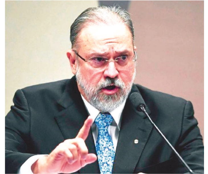
CHEFE DO EXECUTIVO PODE TER ENVOLVIMENTO