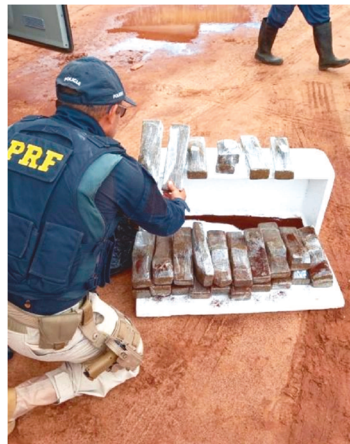
26 KG DE DROGAS ESTAVAM EM UMA MALA E NUM ISOPOR

A Polícia Rodoviária Federal (PRF) apreendeu na manhã do último domingo (9), na BR-135, na entrada de São Luís, 26 kg de maconha prensada que estavam sendo transportadas em um bagageiro de um ônibus interestadual procedente do estado do Pará.