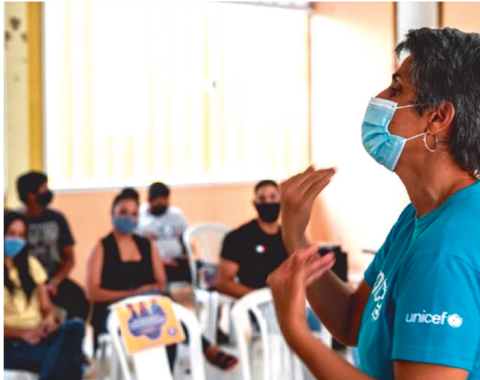
COMUNIDADE PARTICIPA DE DIÁLOGOS PARA MELHORAS SERVIÇOS PÚBLICOS

Como parte das atividades do projeto, estão sendo realizados diálogos virtuais com representantes da educação municipal e estadual, assistência social e sociedade civil, que atuam na região da Cidade Operária e adjacências com o objetivo de firmar parcerias com essas instituições e pensar iniciativas que possam melhorar a prestação de serviços públicos para a