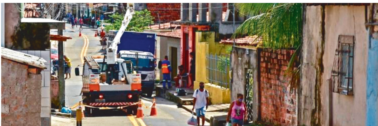
A SINALIZAÇÃO DA SMTT CONSISTIU EM PINTURA DE FAIXA DE PEDESTRES, FAIXA CONTÍNUA, SETA DE INDICAÇÃO DE SENTIDO DE VIA