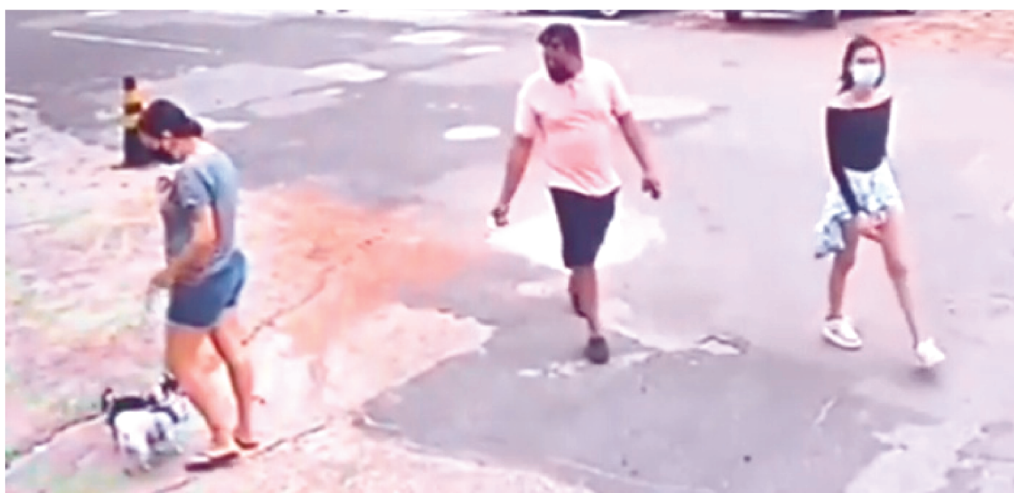
CASAL ARROMBOU APARTAMENTO DE UM PRÉDIO NA PONTA DO FAROL E SUBTRAIU UM COFRE COM BENS AVALIADOS EM R$ 200 MIL

A Polícia Civil do Maranhão em apoio às Polícias Cíveis da cidade de Petrolina, em Pernambuco e Jequié na Bahia, auxiliou para a identificação e prisão de uma organização criminosa de atuação interestadual, especializada em furtos a prédios residenciais de luxo.