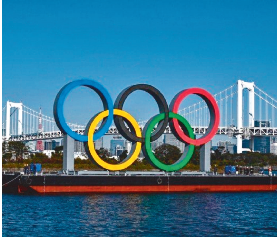
OS JAPONESES APRESENTARAM OPINIÃO EM RELAÇÃO À PRESENÇA DO PÚBLICO

De acordo com outra pesquisa da agência Kyodo, publicada no domin-