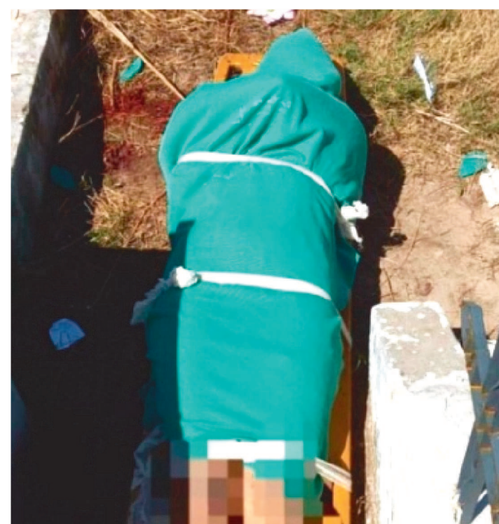
A VÍTIMA DO CRIME FOI ENCONTRADA MORTA E SEM ROUPAS

A polícia investiga a morte, na manhã do último domingo (16), de uma jovem de 22 anos. Ela foi encontrada sem vida dentro de um cemitério na cidade de São Mateus do Maranhão, a 193 km de São Luís. De acordo com a polícia, a vítima estava nua e com a cabeça esmagada.