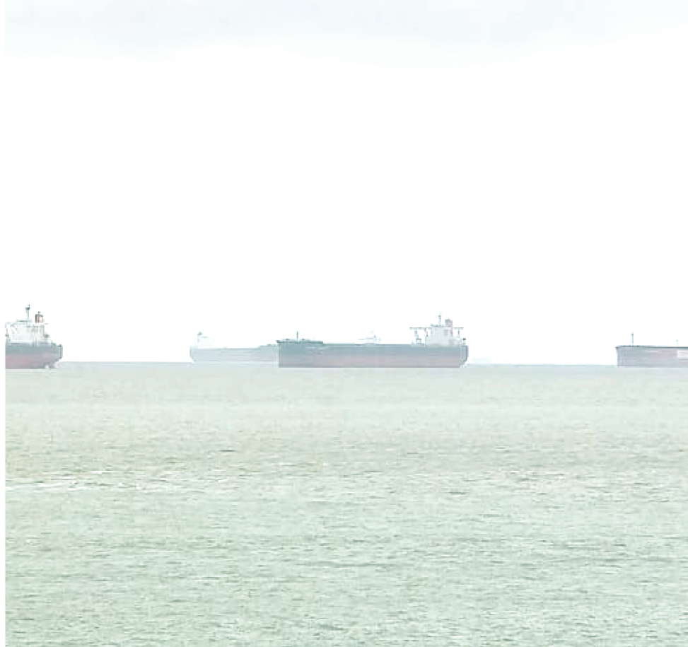
TODA A TRIPULAÇÃO DO NAVIO INDIANO ESTÁ DE QUARENTENA NA EMBARCAÇÃO

O órgão continua acompanhando o caso e em nota oficial informou que toda tripulação foi colocada em quarentena e isolada em cabines individuais na embarcação. O navio permanece em alto mar, na área de fundeio, e não chegou a atracar no porto, em São Luís.