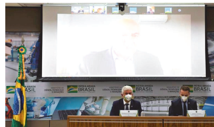
MINISTRO DE CIÊNCIA E TECNOLOGIA, MARCOS PONTES

A Versamune, primeira vacina produzida totalmente no Brasil, está em fase de testes pré-clínicos e já tem protocolo entregue na Anvisa. Também está sendo desenvolvida no país uma vacina em forma de spray nasal. A afirmação é do ministro de Ciência e Tecnologia Marcos Pontes, que nesta segunda-feira, falou à Comissão Temporária da covid-19, no Senado.