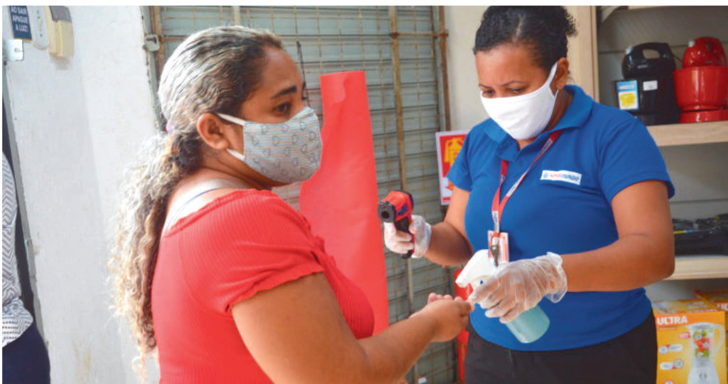
CDL SLZ RECOMENDA TAMBÉM QUE OS COMERCIANTES CONTINUEM COM PROTOCOLOS SANITÁRIOS NAS LOJAS DA CAPITAL

O mês de agosto já está chegando, e a Câmara de Dirigentes Lojistas de São Luís sugere aos consumidores que antecipem suas compras de presentes para o Dia dos Pais.