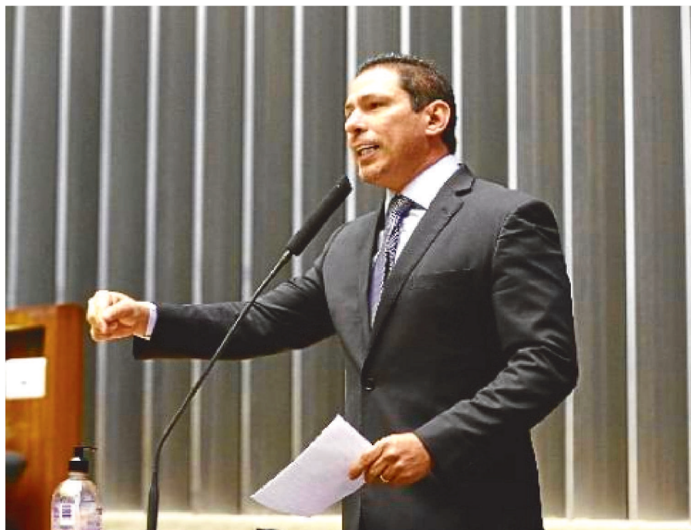
MARCELO RAMOS, VICE PRESIDENTE DA CÂMARA DENUNCIOU ACORDO PARA APROVAR

Na porta do Alvorada, Bolsonaro alegou que pode incorrer em crime de responsabilidade se vetar o restante. Disse esperar não ser atacado pela sanção e, mais uma vez, atacou adversários políticos. Em tom de ironia, avisou que, se os eleitores reclamarem muito, poderão escolher entre o ex-