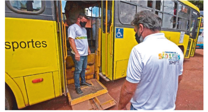
AS AÇÕES DE FISCALIZAÇÃO OCORREM EM DOIS TURNOS

A Prefeitura de São Luís, por meio da Secretaria Municipal de Trânsito e Transportes (SMTT), reforçou as operações de fiscalização nos pontos finais dos ônibus em São Luís. As atividades iniciaram pela Zona Rural e tem como intuito garantir a prestação de serviço eficiente e de qualidade para a população que usa o serviço na capital.