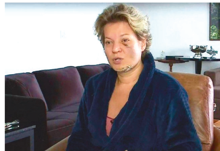
DEPUTADA SOFREU CINCO FRATURAS, CORTE NO ROSTO

O Departamento de Polícia Legislativa da Câmara dos Deputados (Depol) informou há pouco que realizou perícia em 16 câmaras do prédio onde fica o apartamento funcional da deputada Joice Hasselmann (PSL-SP) onde ela diz ter sido vítima de um atentado. De acordo com o órgão, funcionários que trabalham no local também foram ouvidos.