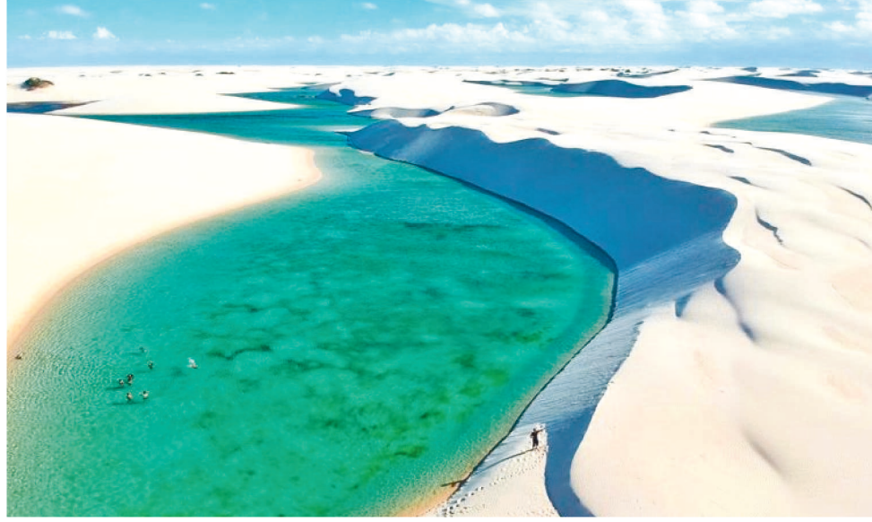
LENÇÓIS MARANHENSES ESTÃO ENTRE OS DESTINOS PREFERIDOS PELOS BRASILEIROS

A quantidade de pessoas vacinadas no destino também entrou para a lista