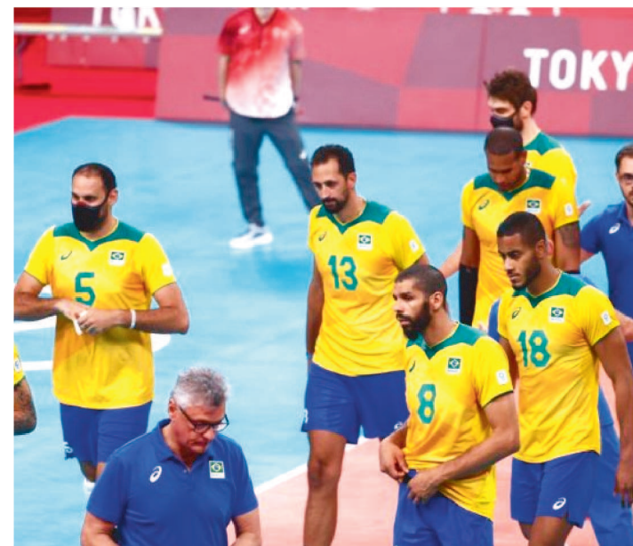
PAÍS NÃO FICAVA FORA DE UMA FINAL OLÍMPICA DESDE 2000

A seleção brasileira de vôlei masculino deu adeus ao sonho do ouro olímpico nos Jogos de Tóquio (Japão). Os brasileiros foram derrotados de virada na madrugada desta quinta-feira (5) para o Comitê Olímpico Russo (ROC, na sigla em inglês) por 3 sets a 1, com parciais de 18/25, 25/21, 26/24 e 25/23. A partida foi realizada na Arena de Ariake, na capital Tóquio.