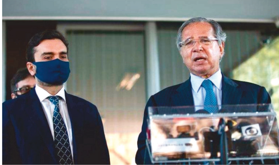
DEPUTADO CELSO SABINO AO LADO DO MINISTRO DA ECONOMIA PAULO GUEDES.

Sabino disse que tem observado muitos equívocos em cálculos que