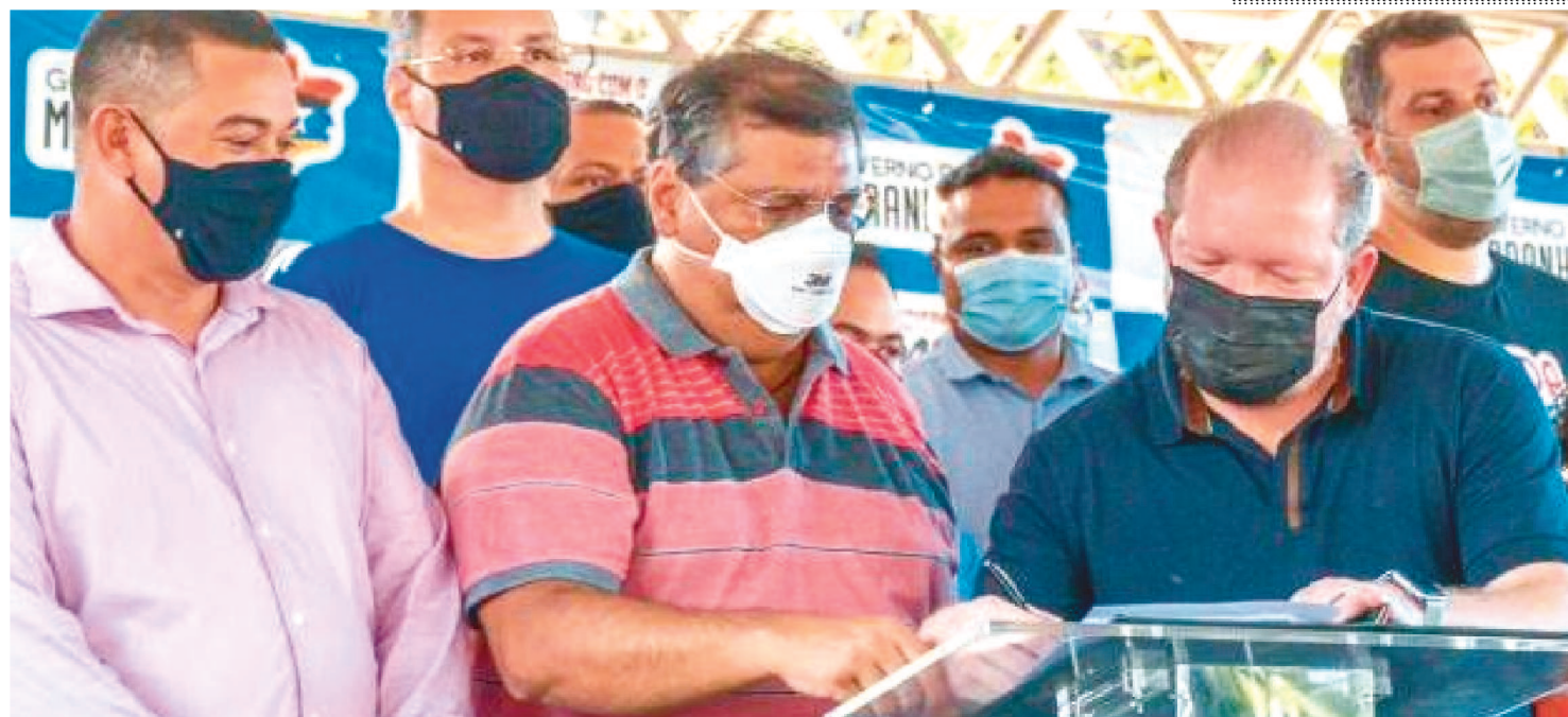
OTHELINO ASSINOU ORDEM DE SERVIÇO QUE GARANTIRÁ OBRAS DE PAVIMENTAÇÃO ASFÁLTICA NO MUNICÍPIO DE SANTO AMARO.

O município de Santo Amaro vai receber, a partir da próxima semana, novos serviços de pavimentação asfáltica, frutos de Indicação do presidente da Assembleia Legislativa do Maranhão, deputado Othelino Neto (PCdoB), que esteve na cidade, nesta sexta-feira (6), para a assinatura da ordem de serviço das obras. Na ocasião, o parlamentar também participou da inauguração da nova ponte sobre o Rio Alegre, entregue pelo governador Flávio Dino.