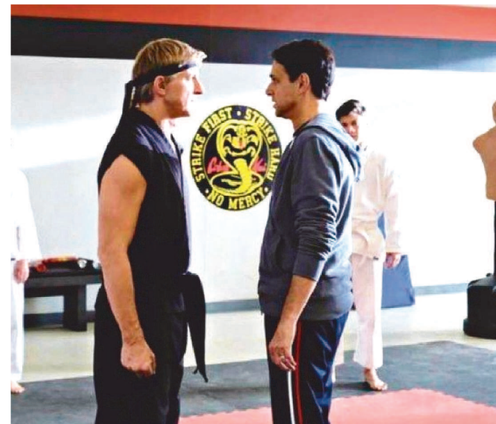
COBRA KAI VAI TER A QUARTA TEMPORADA NA NETFLIX.

A Netflix anunciou nas redes sociais nesta quinta-feira (5), que a quarta temporada da série Cobra Kai estreia este ano. Ainda sem data específica, o spin-off de Karatê Kid está previsto para ser lançado em dezembro na plataforma.