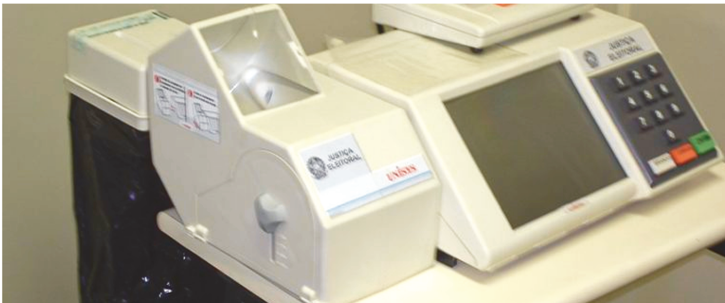
PRESIDENTES E LÍDERES PARTIDÁRIOS AFIRMAM QUE “NÃO HÁ CLIMA” NA CÂMARA PARA APROVAR A PROPOSTA DE EMENDA.

Presidentes e líderes partidários afirmam que “não há clima” na Câmara para aprovar a proposta de emenda à Constituição (PEC) do voto impresso. A avaliação é de que os recentes rompantes do presidente Jair Bolsonaro, que ameaçou não aceitar o resultado da eleição de 2022 sem a mudança na urna e fez vários ataques ao presidente do Tribunal Superior Eleitoral (TSE), Luís Roberto Barroso, dificultam a tarefa de construir maioria para aprovar o texto. Antes de anunciar publicamente a votação, o presidente da Câmara, Arthur Lira (Progressistas-AL), e o ministro da Casa Civil, Ciro Nogueira, comunicaram a Bolsonaro a decisão de pautar a PEC do voto impresso. Disseram, porém, que, se o texto for rejeitado, não vão endossar nenhuma ação do presidente contra o atual sistema da urna eletrônica. Na conversa, destacaram que a decisão do Legislativo precisará ser acatada. A proposta será votada no plenário da Câmara, no fim da próxima semana. Para ser aprovada precisa de pelo menos 308 votos em duas votações, na Câmara e no Senado, número que dirigentes partidários veem