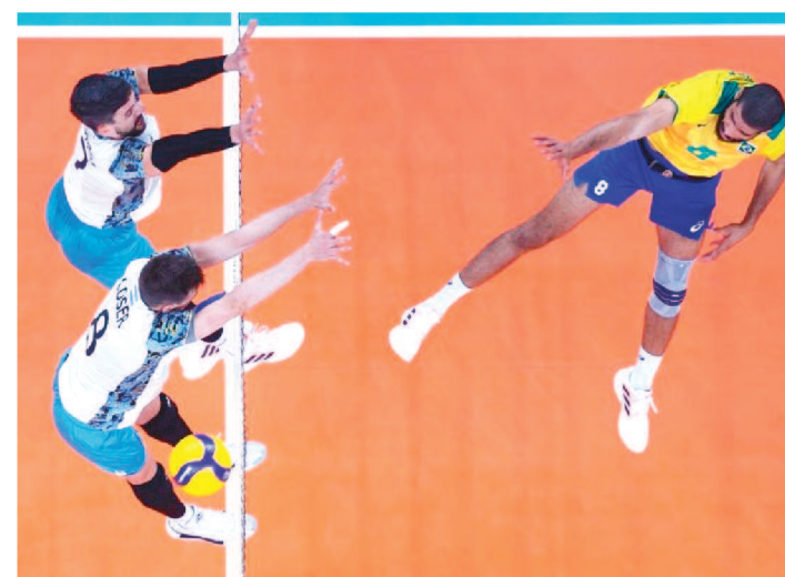
BRASIL PERDEU A DECISÃO DE TERCEIRO PARA A ARGENTINA.

O peso daquela derrota ainda era evidente. Ao entrar em quadra contra a Argentina, o Brasil precisava se livrar da ressaca da queda para evitar um fim ainda pior. Não conseguiu. Apática na maior parte do tempo, a seleção caiu para os rivais em 3 sets a 2, parciais 25/23, 20/25, 20/25, 25/17 e 15/13. Assim, fica fora do pódio no vôlei masculino nas Olimpíadas de Tóquio.