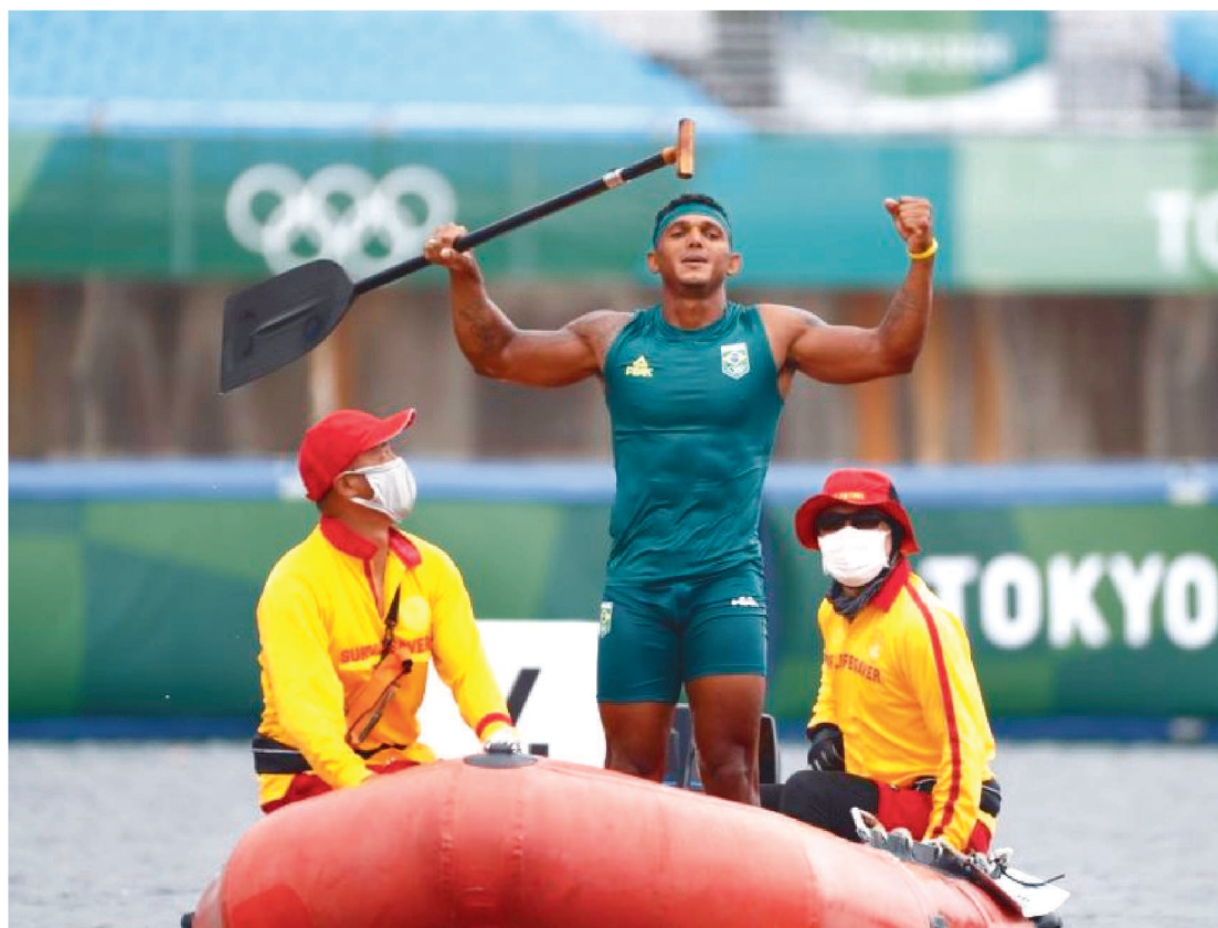
ISAQUIAS QUEIROZ COM A MEDALHA DE OURO NO C1 1000M.

Além de um lugar seleta na histórica olímpica brasileira, Isaquias Queiroz vai capitalizar ainda mais com a medalha de ouro conquistada neste sábado na prova do C1 1000m na canoagem velocidade no Canal Sea Forest, às margens da baía de Tóquio. O baiano de 27 anos vai receber um bônus robusto pela façanha e uma licença estendida para se recuperar. Ou melhor, para se preparar para os Jogos de Paris, em 2024.