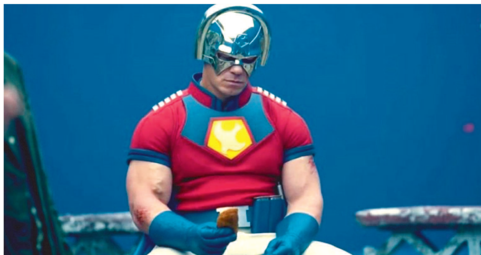
PACIFICADOR FOI UM DOS DESTAQUES DO FILME DO ESQUADRÃO SUICIDA.

“É apenas um pouco sobre o que está acontecendo no mundo, mas também sendo uma série de TV, você realmente tem mais tempo para se aprofundar nesses personagens e muito mais profundamente no drama e na comédia deles. Existem muitas