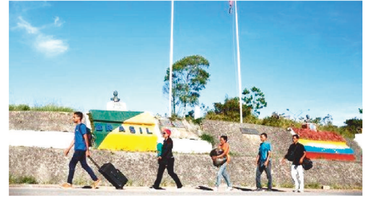
ATÉ JUNHO MAIS DE 50 MIL FORAM RECONHECIDOS

O governo federal prorrogou até 31 de dezembro de 2022 o processo simplificado para análise de pedidos de refúgio de venezuelanos. Até junho, mais de 50 mil imigrantes da Venezuela foram reconhecidos como refugiados, segundo dados do Ministério da Justiça e Segurança Pública.