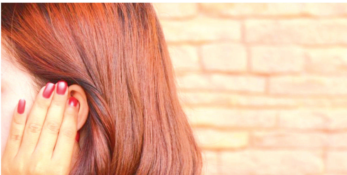
INTELIGÊNCIA DOS EUA AINDA NÃO SABE A CAUSA DA “SÍNDROME DE HAVANA”.

Os Estados Unidos ainda não têm certeza qual foi a causa da chamada “síndrome de Havana” que adoeceu diplomatas em vários países, disse a chefe de inteligência, Avril Haines, nesta segunda-feira (9).