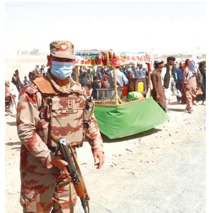
TALIBÃS ESTÃO AMPLIANDO DOMÍNIO PARA GRANDES CIDADES

Os talibãs assumiram o controle nesta segunda-feira (9/8) de Aibak, na região norte do Afeganistão, a sexta capital provincial a cair em suas mãos em apenas quatro dias, informou uma fonte do governo local.