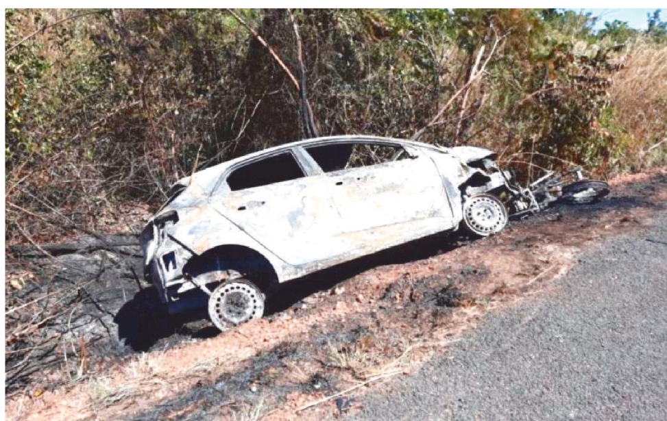
FORAM REGISTRADOS 66 ACIDENTES COM MORTES NA BR-316 NO ANO PASSADO.

Esses números foram registrados durante a pandemia pela Polícia Rodoviária Federal (PRF) do Maranhão. De acordo com os dados da PRF-MA, a BR-316, que corta algumas cidades como Zé Doca, Santa Inês e Bacabal, foi a que teve mais casos de acidentes fatais. Fora 66 mortes durante os 12