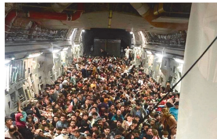
AERONAVE TEM CAPACIDADE PARA APENAS 100 PASSAGEIROS.

Em meio ao caos no aeroporto de Cabul, no Afeganistão, nesta segunda-feira (16/8), um avião militar norte-americano decolou com 640 pessoas a bordo, quando só tinha capacidade para pouco mais de 100 passageiros.