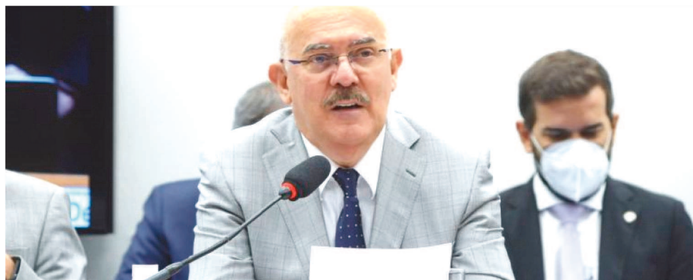
A DESPESA DISCRICIONÁRIA É AQUELA QUE NÃO É OBRIGATÓRIA, COMO INVESTIMENTOS.

Para aumentar as despesas discricionárias em 2022, o ministério vai economizar gastos com pessoal da Reserva do Banco de Professor Equivalente (BPEq). A intenção do ministro é utilizar a diferença com a recomposição do programa de assistência estudantil, bolsas e residência médica profissional, entre outras prioridades que a