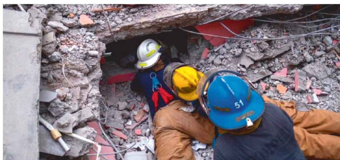
A ESPERANÇA DE ENCONTRAR SOBREVIVENTES NOS DESTROÇOS DIMINUIU.

Chuvvas pesadas atingiram o Haiti na noite dessa segunda-feira (16), complicando os esforços de resgate e enchando milhares de pessoas que foram desabrigadas pelo terremoto devastador do último sábado (14). A esperança de encontrar sobreviventes nos destroços dos prédios que desabaram diminuiu. O forte tremor, de magnitude 7,2, matou pelo menos 1.419 pessoas.