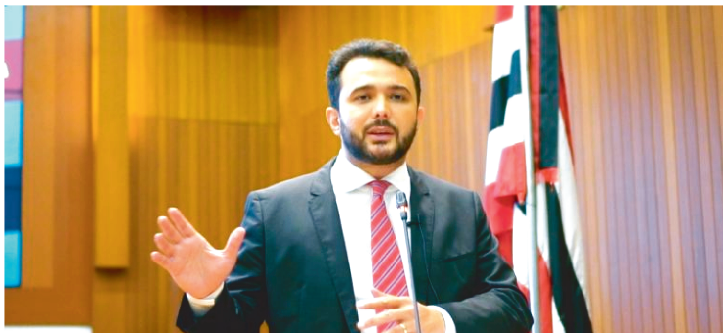
YGLÉSIO DISSE QUE VIOLÊNCIA CONTRA INDÍGENAS É ESTIMULADA POR BOLSONARO.

Na manhã desta terça-feira (17), foi realizada uma ação de reintegração de posse em um terreno privado, no bairro do Olho d'Água, em São Luís, onde cerca de 250 famílias estavam vivendo.