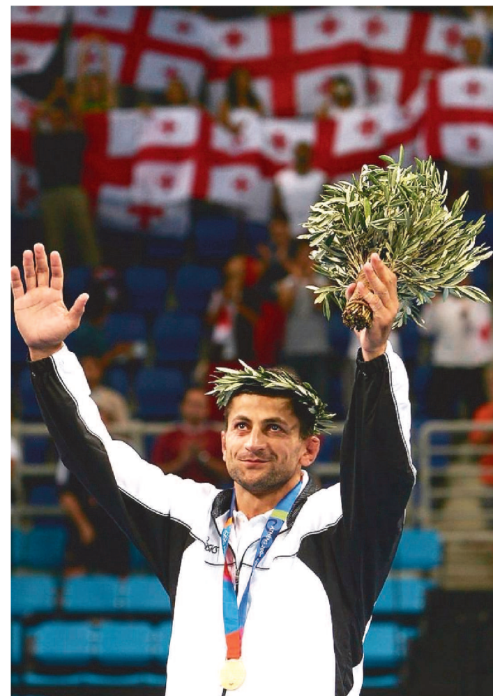
ZURAB ZVIADURI SE ENVOLVEU EM UMA TROCA DE TIROS.

O Ministério do Interior da Geórgia anunciou ontem, terça-feira (17), que Zurab Zviaduri está preso. Primeiro campeão olímpico da história do país nas Olimpíadas de Atenas 2004, o ex-judoca de 40 anos é acusado de participar de um tiroteio na vila de Tsinandali, que deixou três pessoas mortas na última segunda-feira. O crime de assassinato premeditado no país é punível com até 15 anos de prisão.