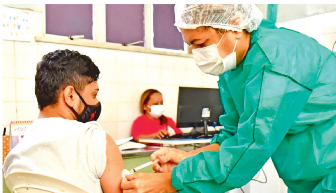
VACINAÇÃO PARA O GRUPO DE PESSOAS DE 12 A 17 ANOS ACONTECE NESTA SEMANA.

O Ministério da Saúde informou, hoje (17), que mais de 50 milhões de pessoas já tomaram as duas doses ou a vacina de dose única contra a covid-19, o que representa 31,9% da população acima de 18 anos de idade com a imunização completa contra a doença.