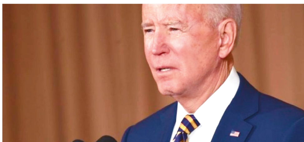
BIDEN: “SOU O PRESIDENTE DOS ESTADOS UNIDOS E A RESPONSABILIDADE É MINHA”.

Segundo o presidente, uma relação com o Afeganistão dependerá “das ações do Talibã”. “Um futuro governo afegão que defenda os direitos básicos do seu povo, que não receba terroristas e que proteja os direitos básicos da metade da sua população — suas mulheres e meninas —, este seria um governo com qual estaríamos dispostos a trabalhar”, assegurou.