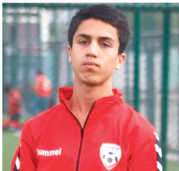
O JOVEM MORREU APÓS TENTAR FUGIR EM UM AVIÃO MILITAR DOS EUA QUE DECOLAVA DO AEROPORTO DE CABUL, CAPITAL DO PAÍS.

As autoridades afegãs confirmaram na quinta-feira (19/8) que um jovem jogador de futebol morreu após tentar fugir em um avião militar dos EUA que decolava do aeroporto de Cabul, capital do país.