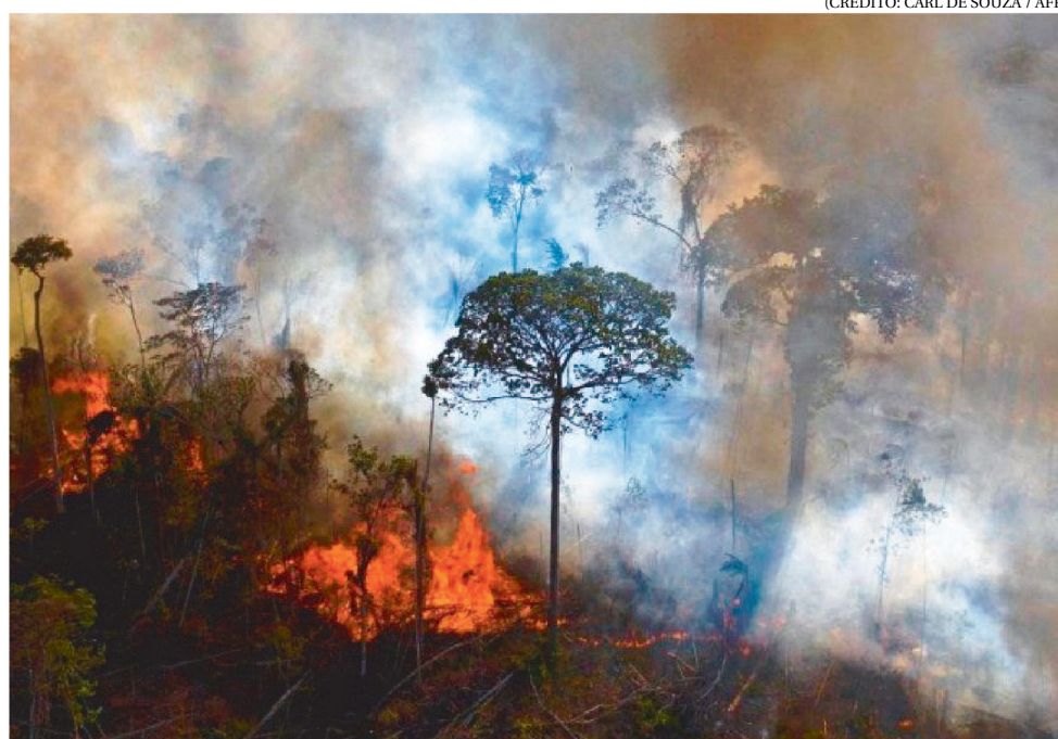
FORAM OBSERVADOS DADOS COLETADOS AO LONGO DE 10 ANOS EM TODA A AMAZÔNIA

No artigo, a pesquisadora explica que mudou a forma de estimar o impacto da redução das árvores sobre o regime de chuvas. Isso porque, comumente, usa-se uma comparação line-