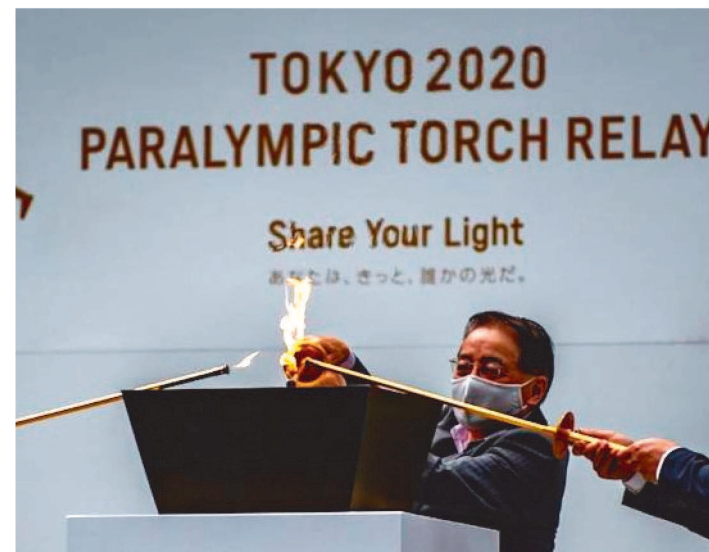
CERIMÔNIA COM CHAMA PARALÍMPICA ACONTECEU NA SEXTA

A chama paralímpica chegou nesta sexta-feira (20/8) à capital japonesa e o logo dos Jogos Paralímpicos (24 de agosto-5 de setembro) foi instalado na baía de Tóquio, enquanto o país enfrenta um número recorde de casos de covid-19 a quatro dias da cerimônia de abertura.