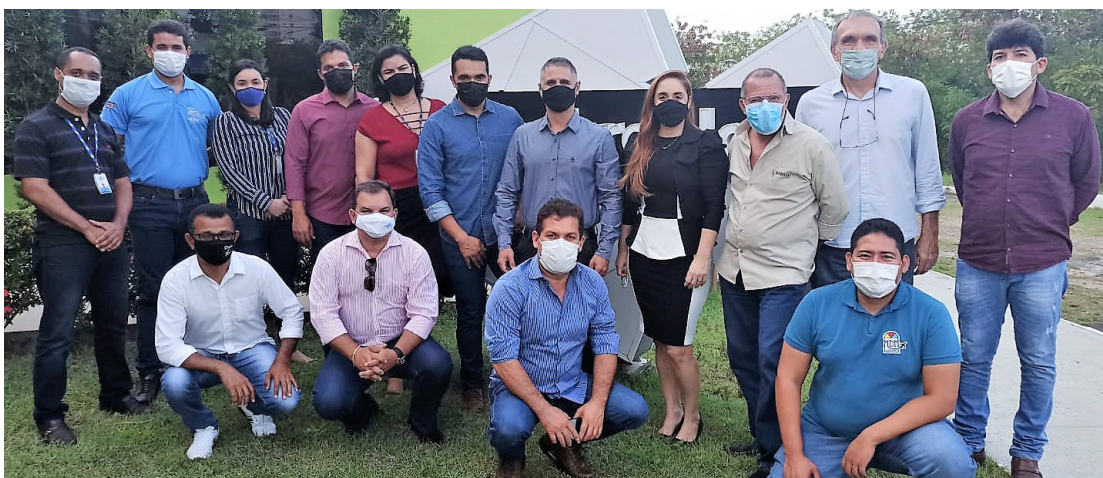
AUTORIDADES E GESTORES PÚBLICOS DE BARRA DO CORDA, SE REUNIRAM NO MULTICENTER SEBRAE PARA TROCA DE EXPERIÊNCIAS COM O TRADE TURÍSTICO DE SÃO LUÍS.

São novos 70 empregos diretos, voltados principalmente a estagiários em suas primeiras oportunidades de trabalho e desenvolvimento profissional. Aos turistas e visitantes é disponibilizada internet Wi-fi gratuita além de computador para rápidas pesquisas.