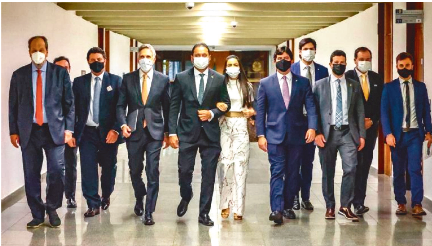
SENADOR WEVERTON E DEPUTADO FUFUCA CONSEGUEM VIABILIZAR VÔO REGIONAL PARA BARREIRINHAS

O senador Weverton (PDT-MA) e o deputado federal André Fufuca conseguiram viabilizar o vôo regional para operar nos trechos Jeri-Parnaíba, Parnaíba-Barreirinhas e Barreirinhas-São Luís.