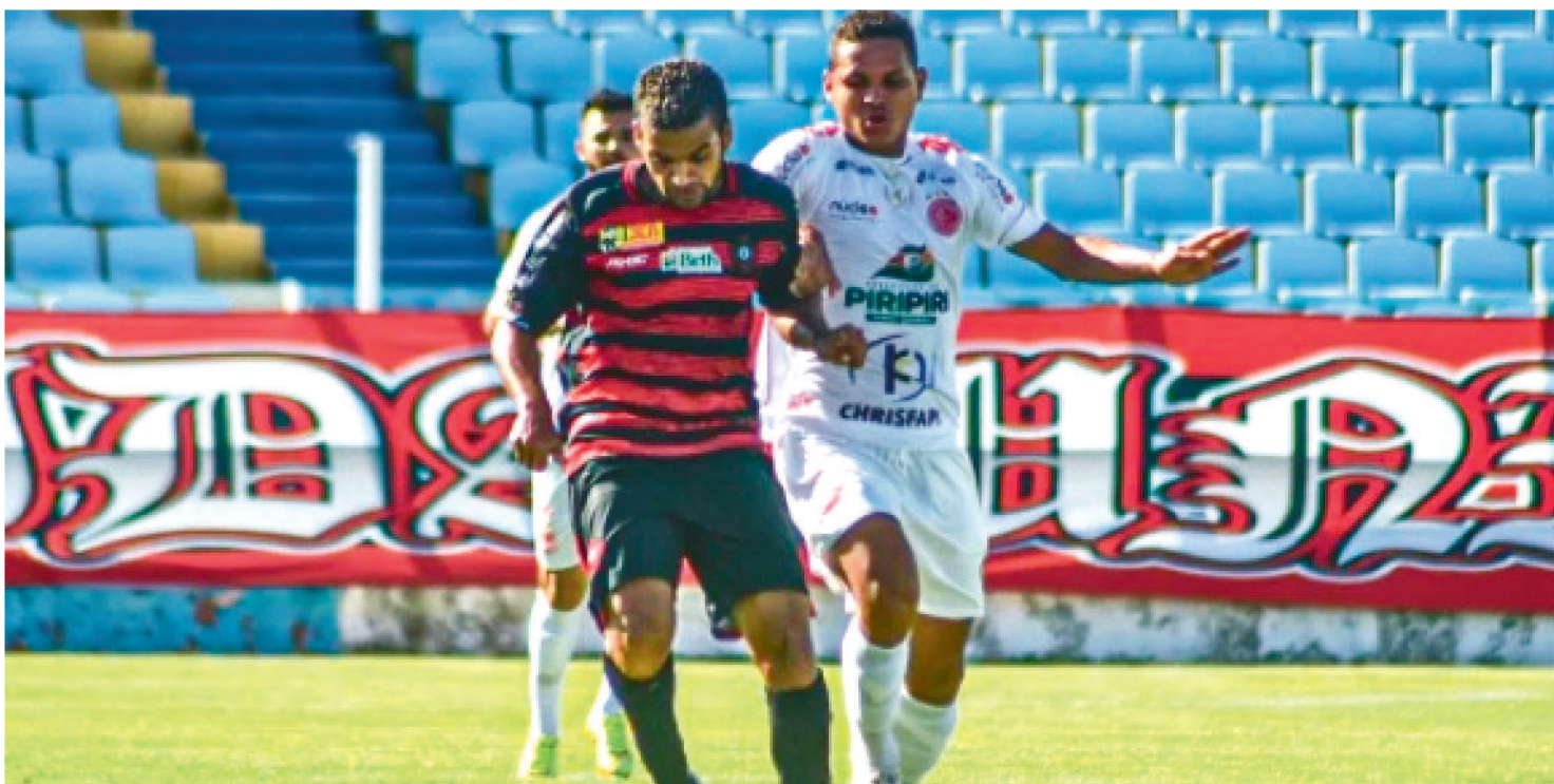
O MOTO CLUB DEPENDE APENAS DE SI PARA CONSEGUIR A CLASSIFICAÇÃO PARA A SEGUNDA FASE DA SÉRIE D DO BRASILEIRO.

A delegação do Moto Club deixou São Luís na noite de ontem, com destino a Sobral, onde disputará sua próxima partida pela Série D do Brasileiro, contra o Guarany-CE.