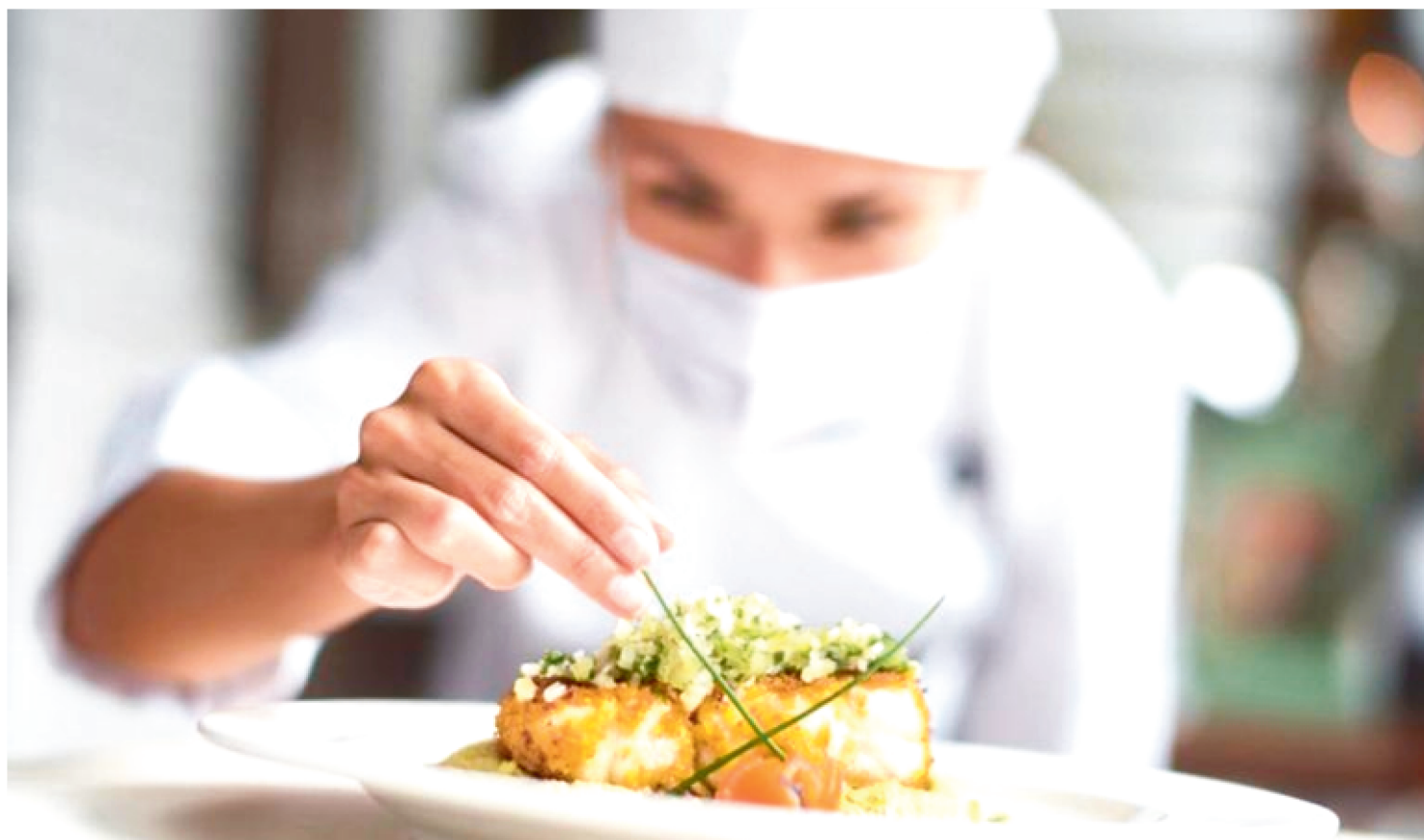
AS VAGAS OFERTADAS SÃO PARA OS CURSOS DE GASTRONOMIA BÁSICA, GARÇOM, COZINHEIRO INDUSTRIAL E CONFEITARIA

A Secretaria de Estado da Educação (Seduc) oferecerá 240 vagas em cursos de Formação Inicial e Continuada (FIC) que serão ofertados pela nova Unidade Vocacional do Instituto Estadual de Educação, Ciência e Tecnologia do Maranhão (IEMA) – o IEMA Gastronomia, que será inaugurado em breve, em São Luís.