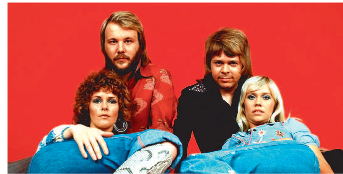
ABBA ANUNCIOU QUE FARÁ UM RETORNO ESPECIAL