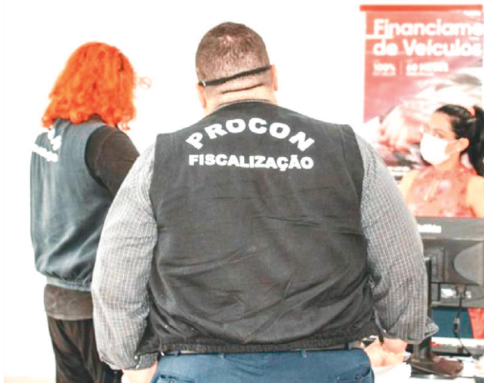
PROCON/MA AUTUOU AGÊNCIAS BANCÁRIAS E A CASA LOTÉICA POR IRREGULARIDADES