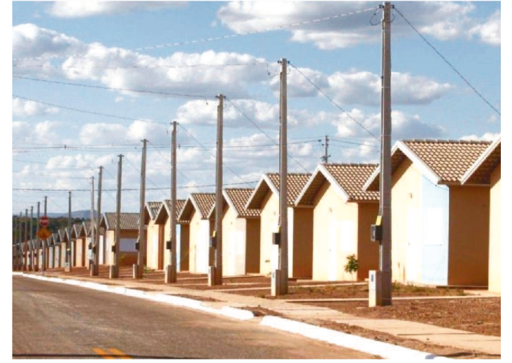
ENTREGA DE MORADIAS OCORRE NESTA SEXTA-FEIRA (27).

O Governo Federal, por meio do Ministério do Desenvolvimento Regional (MDR), entrega, nesta sexta-feira (27), 1.109 casas a famílias de baixa renda do município de Itapecuru-Mirim, no Maranhão.