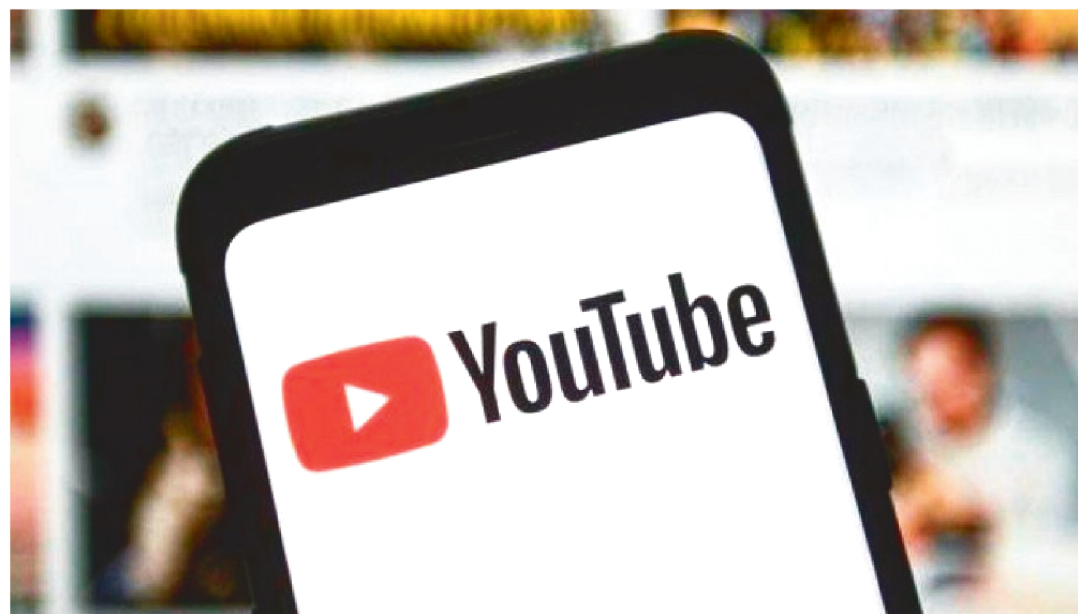
PLATAFORMA REMOUEU 1 MILHÃO DE VÍDEOS COM “INFORMAÇÕES PERIGOSAS SOBRE A COVID-19”

O YouTube anunciou nesta quarta-feira (25) que removeu mais de um milhão de vídeos com “informações perigosas sobre o coronavírus” desde o início da pandemia de covid-19.