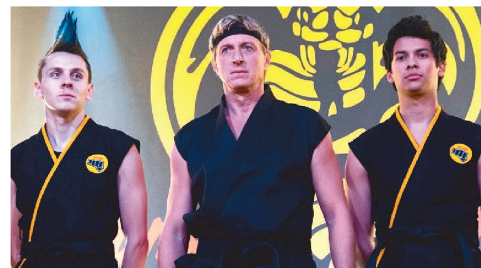
COBRA KAI VOLTA AINDA EM 2021 PARA A NETFLIX

A nostálgica série de ação Cobra Kai, que continua os eventos da franquia Karate Kid pela ótica do antes antagonista Johnny Lawrence (William Zabka), terá uma quinta temporada. O anúncio de renovação pela Netflix chega poucos meses antes do quarto ano da série, que estreia em dezembro na plataforma de streaming. As informações são do Collider.