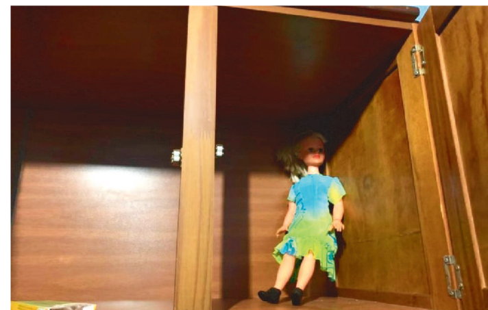
BONECAS FORAM ENCONTRADAS NA CASA DO SUSPEITO.

A Polícia Federal cumpriu um mandado de busca e apreensão e outro mandado de prisão preventiva na manhã do último sábado (28), em São Luís.