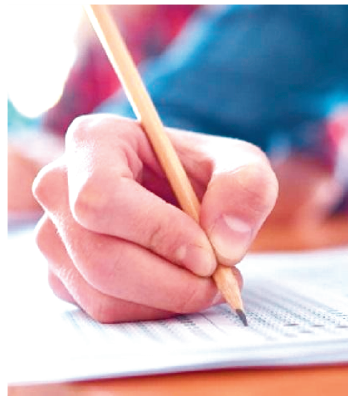
AS INSCRIÇÕES VÃO ATÉ O DIA 7 DE SETEMBRO DESTA ANO.

O Conselho Regional de Psicologia do Maranhão (CRP – MA) abriu inscrições para concurso público com vagas em São Luís.