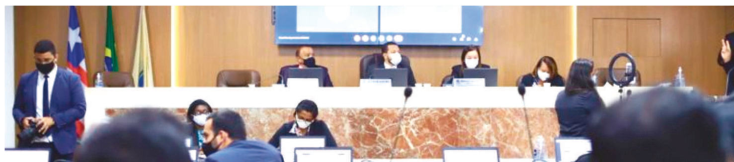
VEREADORES SOLICITARAM NOVAMENTE OBRAS DE INFRAESTRUTURA EM SÃO LUÍS À PREFEITURA E AGUARDAM POR RESPOSTAS

Ainda neste mês de agosto outros parlamentares protocolaram indicações solicitando da Prefeitura de São Luís melhorias de limpeza em diversos bairros da capital maranhense.