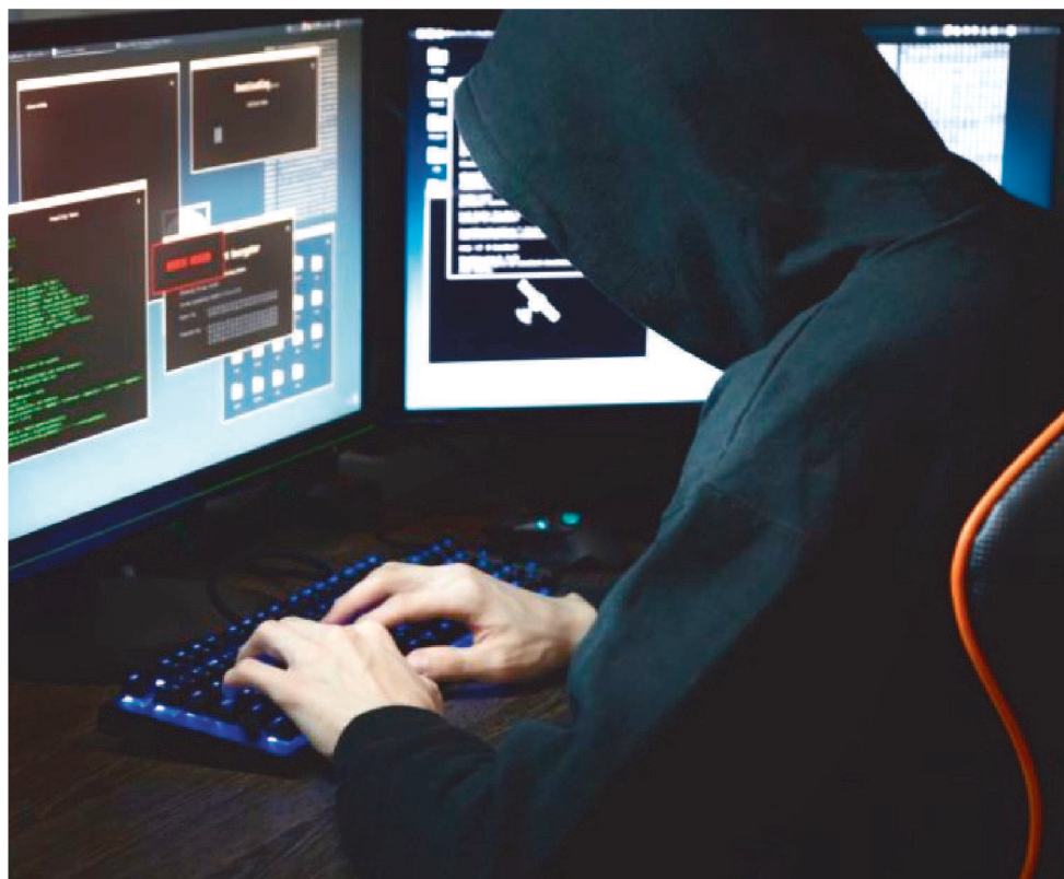
A CARTILHA ALERTA PARA QUE AS PESSOAS NÃO CAIAM EM GOLPES EM APLICATIVOS.

A publicação aborda os golpes dos falsos links, da troca de cartão, de clonagem de perfil do WhatsApp, do perfil falso no WhatsApp, phishing (enganar a vítima para compartilhar informações confidenciais como senhas e número de cartões de crédito), invasão do WhatsApp Web, da falsa ligação do banco, do falso sequestro e extor-