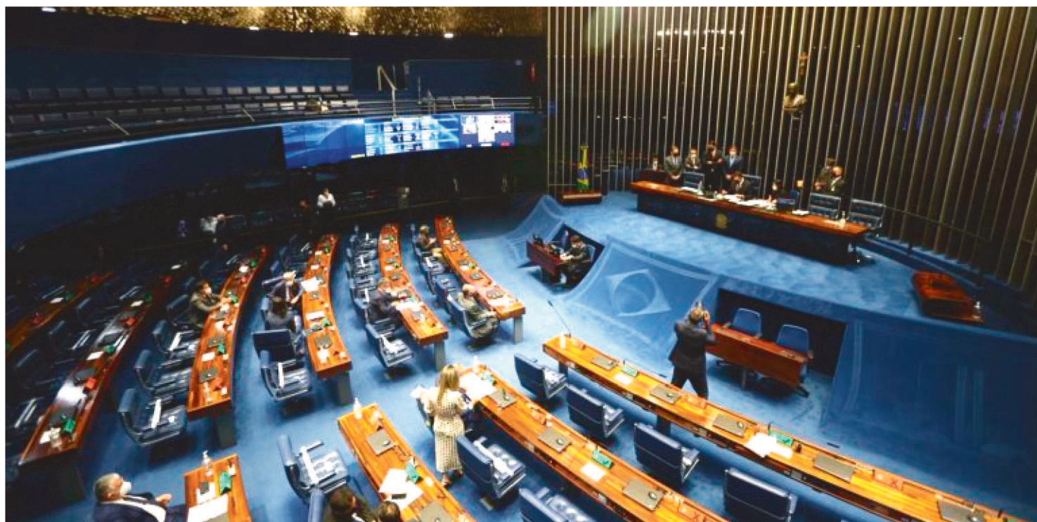
GESTORES PÚBLICOS CUJAS CONTAS FORAM REPROVADAS PODERÃO DISPUTAR AS ELEIÇÕES COM O PAGAMENTO DE MULTA.

O Senado aprovou um projeto de lei complementar (PLP) que isenta de inelegibilidade os gestores que tenham tido contas julgadas irregulares sem imputação de débito.