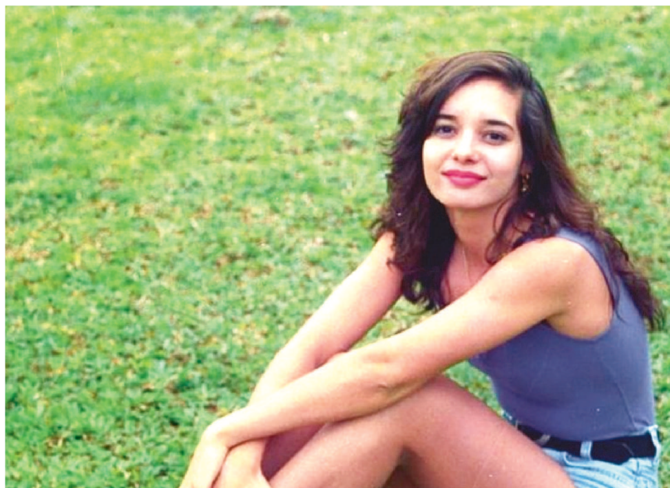
A PREVISÃO DE ESTREIA DA SÉRIE DOCUMENTAL SOBRE A VIDA DA ATRIZ É 2022.

O assassinato de Daniella foi um crime que chocou o País, tendo, inclusive, repercussão internacional, haja vista que além de ter sido uma morte prematura dada a pouca idade da atriz que estava no auge de sua carreira, não havia motivo aparente para