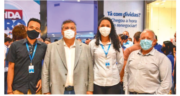
A AÇÃO DO PROCON MA OCORRERÁ ATÉ O DIA 30 DE SETEMBRO.

Os clientes da Companhia de Saneamento Ambiental do Maranhão (Caema) podem negociar seus débitos em atraso durante o programa “Dívida Zero”, em evento realizado no Shopping da Ilha, em São Luís. Os atendimentos acontecem presencialmente de segunda-feira à sexta-feira, das 12h às 18h, no local de realização do evento. A ação, promovida pelo Instituto de Promoção e Defesa do Cidadão e Consumidor do Maranhão (Procon-MA), ocorrerá até o dia 30 de setembro.