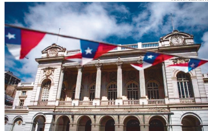
AEROPORTOS COMEÇARÃO A RECEBER VOOS DO EXTERIOR.

O governo chileno flexibilizou, nesta quarta-feira (15), as restrições em suas fronteiras, que permanecem fechadas desde abril, e permitirá a partir de outubro a entrada de estrangeiros que comprovem que já se vacinaram contra a covid-19.