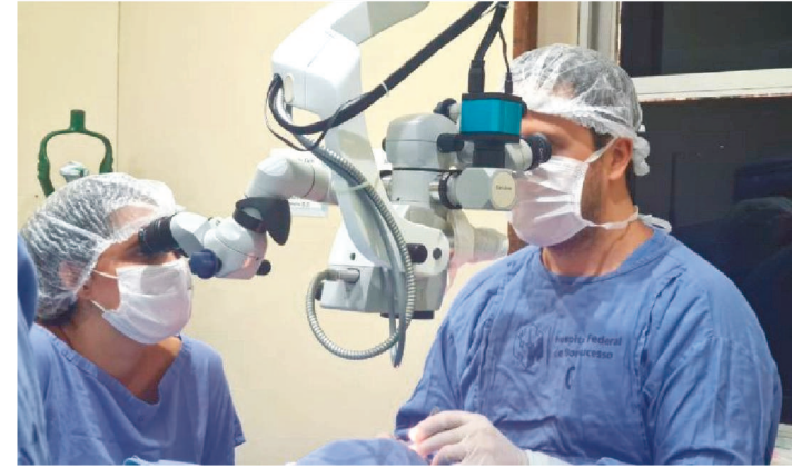
46.738 AGUARDAM TRANSPLANTE DE MÚLTIPLOS ÓRGÃOS.

EQUIPE REALIZA TRANSPLANTE DE CórNEA NO HOSPITAL BONSUCESSO