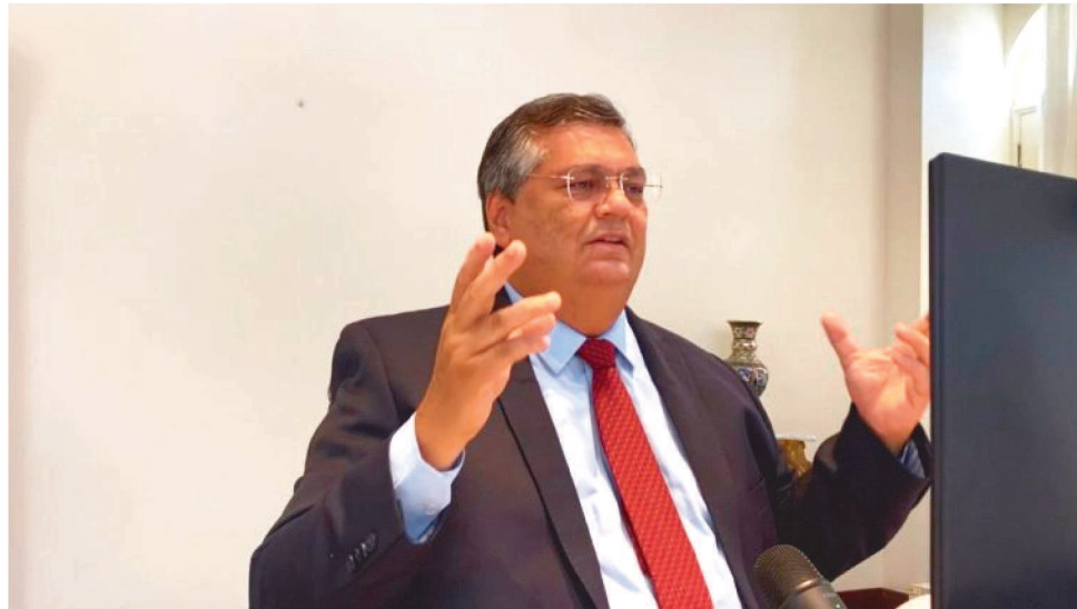
FLÁVIO DINO FRISOU QUE HÁ UM "SENTIDO DE URGÊNCIA" DO QUE DEVE SER DISCUTIDO.

“Para a CAEMA, é uma satisfação entregar este equipamento, que faz parte de um conjunto de investimentos do Governo do Estado no município de Lagoa Grande, mais especificamente no abastecimento de água, que garante avanços significativos na oferta deste serviço. Inauguramos ainda um poço com uma ótima vazão. O que faltava era esse reservatório que vai levar água para toda a cidade com