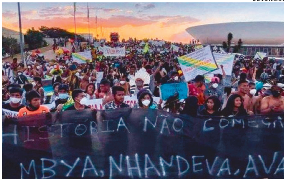
MINISTRO ALEXANDRE DE MORAES PEDIU MAIS TEMPO PARA ANALISAR O JULGAMENTO

Na semana passada, o relator do caso, ministro Edson Fachin, apresentou um parecer contrário à tese do marco temporal, que tem sido defendido por grupos ligados ao agronegócio. No entanto, Nunes Marques votou a favor do projeto, defendendo que as terras ocupadas pelos povos tradicionais pertencem ao Estado. "Todas as terras indígenas são um bem público federal", disse.