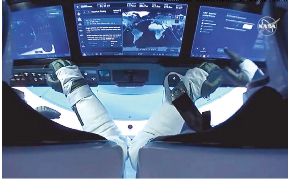
A MISSÃO “INSPIRATION4” REPRESENTA UM GRANDE PASSO PARA O TURISMO ESPACIAL.

OS ASTRONAUTAS DA NASA ROBERT BEHNKEN E DOUGLAS HURLEY SÃO VISTOS A BORDO DA ESPAÇONAVE DRAGON ENDEAVOR DA SPACEX, EM 2