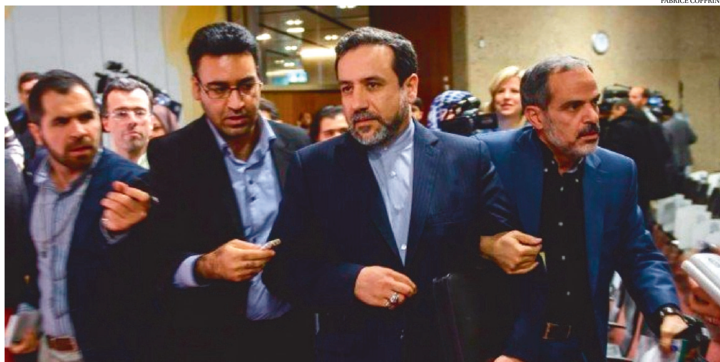
ARAGHCHI SERÁ SUBSTITUÍDO POR ALI BAGERI, PRÓXIMO AO NOVO PRESIDENTE, O ULTRACONSERVADOR EBRAHIM RAISI.

O Irã destituiu o vice-ministro das Relações Exteriores, Abbas Araqchi, que também era o principal negociador do programa nuclear – anunciou a diplomacia iraniana.