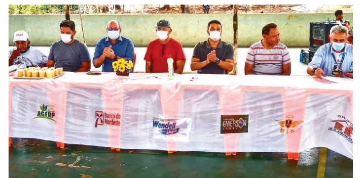
O DEPUTADO ESTEVE NO EVENTO, NO POVOADO DO LEITE.

Com uma programação que promete entrar no calendário cultural do município de Itapecuru-Mirim (MA) e região. O deputado estadual Wendell Lages (PMN) acompanhou o primeiro Festival da Farinha realizado no Povoado do Leite, valorizando agricultores e produtores rurais que usam da farinha, o principal caminho para venda e renda-básica.