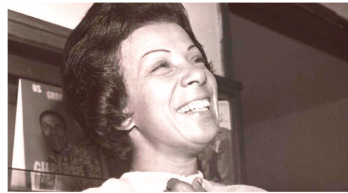
ELIZETH CARDOSO FOI UMA DAS MAIORES CANTORAS DA MPB