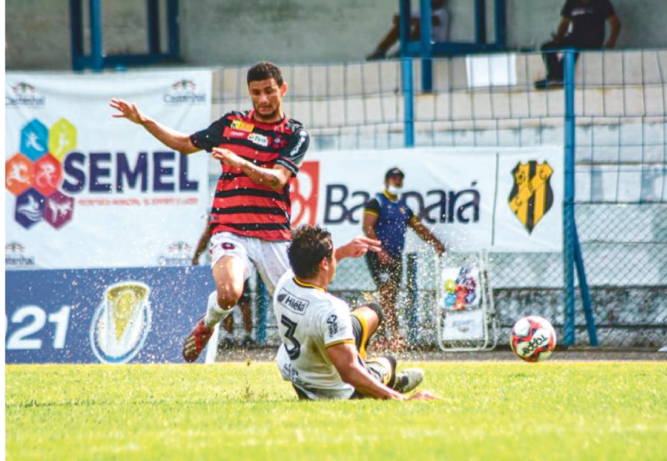
O PAPÃO DO NORTE VEM DE DUAS VITÓRIAS DIANTE O CASTANHAL-PA NA SÉRIE D.

A situação agora mudou para o Moto Club, que vai jogar a primeira partida fora, e decide em casa. O segundo jogo será no Estádio Nhozinho Santos, às 15h do dia 3 de outubro. A Confederação Brasileira de Futebol justificou o horário ao alegar que se houver necessidade de desempate haverá cobranças de “tiros livres, direto da marca penal”. O Estádio Nhozinho San-