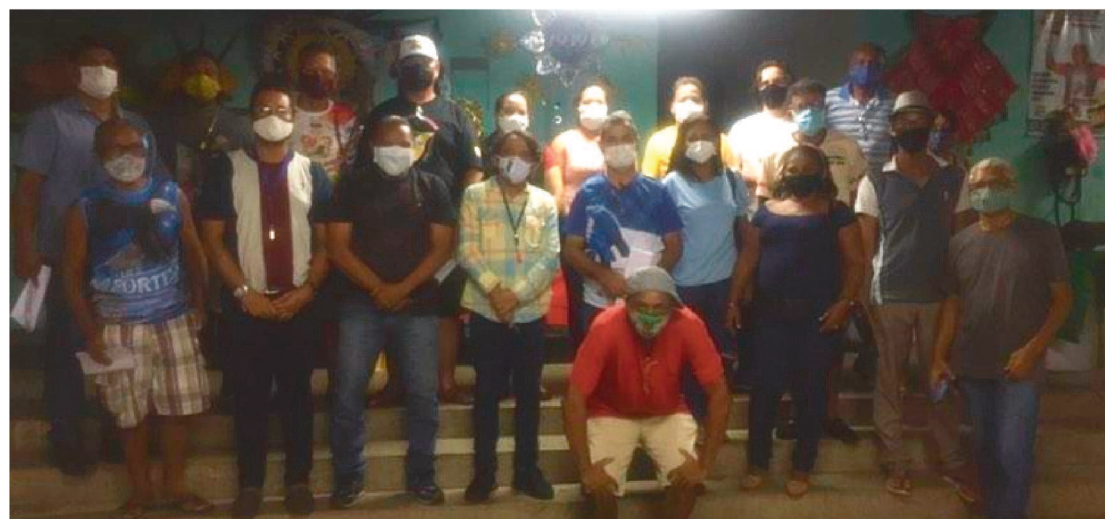
REPRESENTANTES DE AGREMIÇÕES DE SÃO LUÍS DERAM O PONTAPÉ INICIAL NO CARNAVAL.

A AMBC realizou na última Segunda-feira (20) a primeira reunião entre representantes e equipe técnica para discutir a realização do carnaval em 2022, uma das mais tradicionais festas do interior do Maranhão e do Brasil.