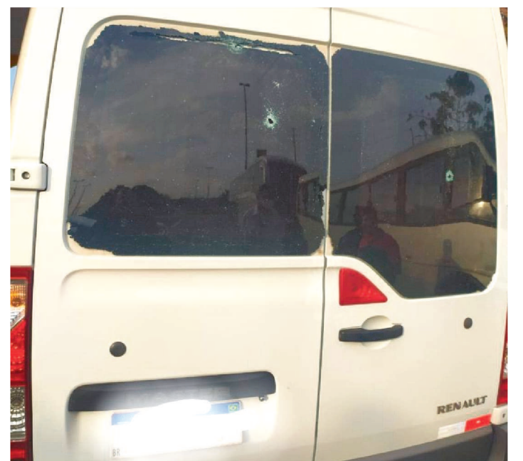
UM DOS TIROS ATINGIU AS COSTAS DE UMA MULHER

A Polícia Rodoviária Federal (PRF) do Maranhão registrou uma tentativa de assalto a uma van, na BR-135, próximo à entrada de São Luís, na altura do km 19.