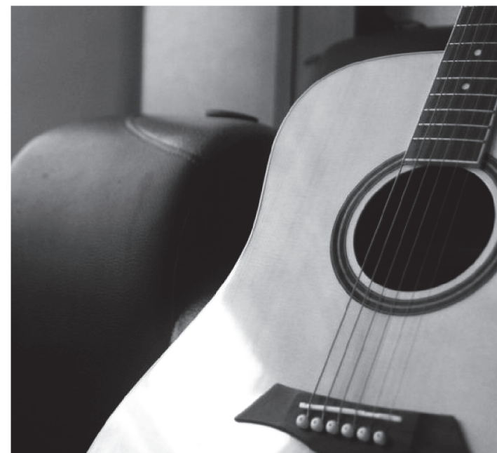
O PERÍODO DE RECURSO FOI ABERTO NESTA TERÇA (21).

A Secretaria de Estado da Cultura (Secma) divulgou nesta terça-feira, 21, o resultado preliminar de mais um dos 11 editais lançados na segunda fase da Lei Aldir Blanc no Maranhão (Lei 14.017/20).