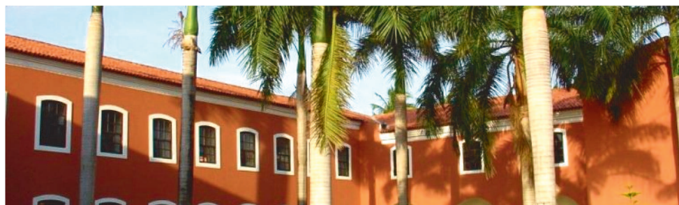
NO MARANHÃO, ESPAÇOS MUSEOLÓGICOS TÊM PROGRAMAÇÃO ONLINE E PRESENCIAL.

“Em face à pandemia, a 15ª edição do evento propõe como tema – Museus: perdas e recomenços, uma refle-