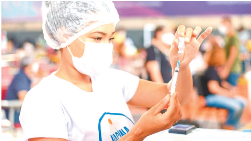
A CAMPANHA DE IMUNIZAÇÃO CONTRA A COVID EM SÃO LUÍS COMEÇOU EM JANEIRO.

A ação segue recomendação do Ministério da Saúde (MS). São Luís já vacinou com a terceira dose 4.817 idosos e imunossuprimidos, desde o dia 26 de agosto.