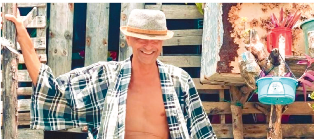
A DATA SERÁ CELEBRADA COM UM DESFILE NO DIA 28, NA PRAÇA DA MISERICÓRDIA, NO CENTRO.