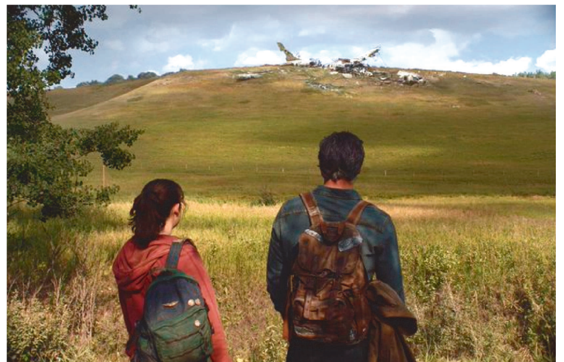
JOEL E ELLIE EM UM CAMPO ABERTO. AO FUNDO É POSSÍVEL VER UM AVIÃO DESPEDAÇADO.

A primeira imagem oficial da série de The Last of Us com Joel e Ellie foi divulgada na internet na noite deste domingo (26). Para celebrar o "The Last of Us Day", data especial focada na franquia, o diretor Neil Druckmann, bem como diversos perfis da PlayStation e HBO, mostraram uma prévia da produção.