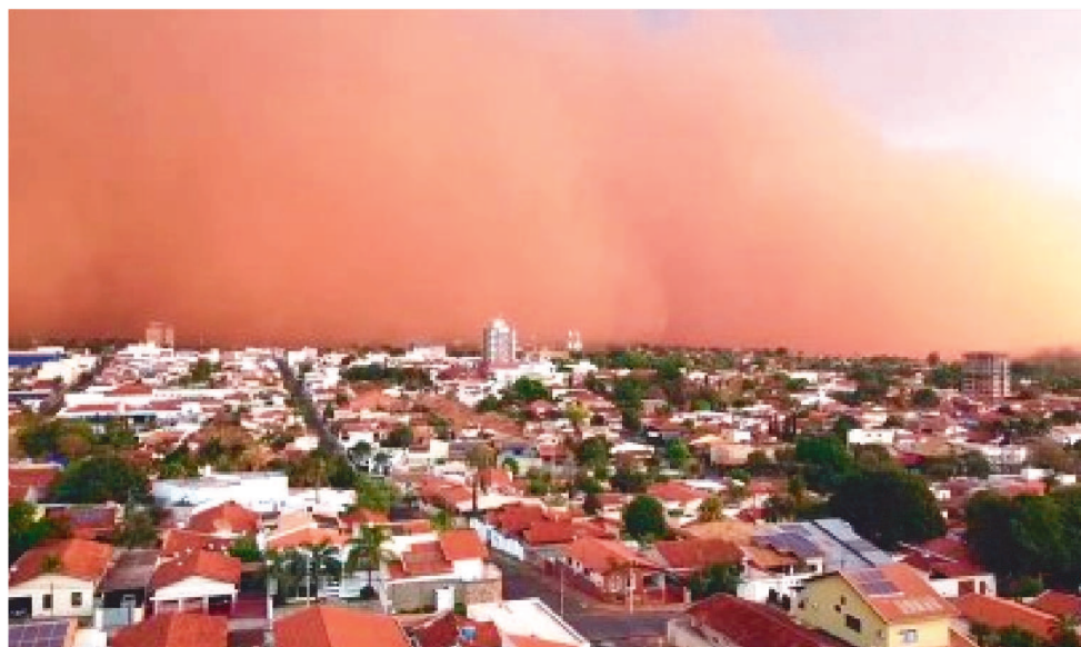
VENDAVAL ACONTECE DEVIDO A CHOQUE ENTRE PRESSÕES ATMOSFÉRICAS DISTINTAS.

Uma impressionante tempestade de areia, com velozes ventos em Uberaba e Frutal, no Triângulo Mineiro, na tarde de domingo (26/9), que antecedeu uma pequena chuva de cerca de 15 mm, assustou os moradores das cidades e provocou, além de quedas de árvores e de energia, uma avalanche nas redes sociais com fotos, vídeos e comentários.