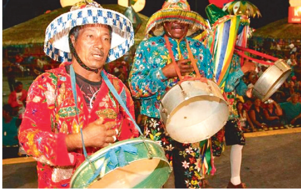
O EVENTO ACONTECE NO CONVENTO DAS MERCÊS, DIA 2, A PARTIR DAS 18H.

aos Mestres, Cantadoras e Cantadores do Bumba-meu-Boi dos sotaques da Baixada e Costa de Mão.