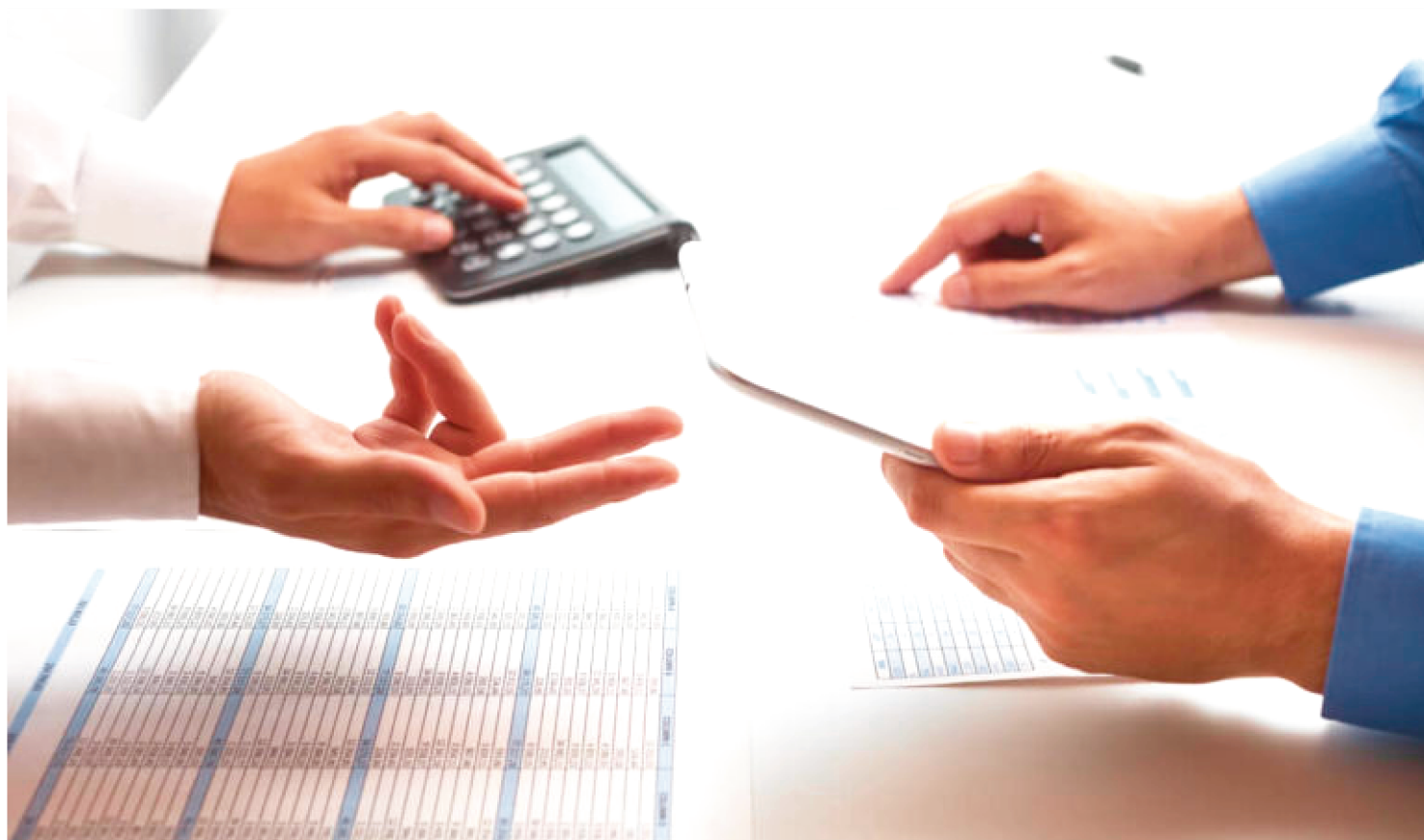
A AÇÃO OFERECE CONDIÇÕES ESPECIAIS DE PAGAMENTO PARA CONSUMIDORES DA CLASSE RESIDENCIAL DE TODO O ESTADO.