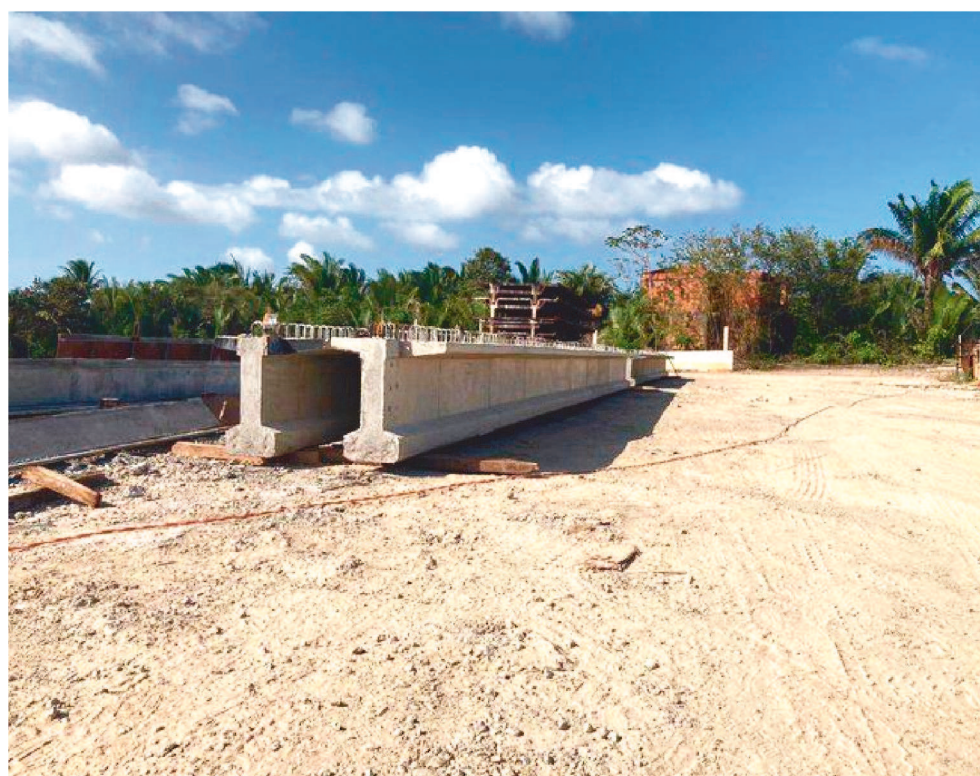
PONTE TERÁ 12 METROS DE EXTENSÃO EM CONCRETO ARMADO, SOBRE O RIO PACIÊNCIA

De acordo com o prefeito Eudes Barros, trata-se de uma obra de importância significativa para a localidade e um antigo sonho dos moradores da região. "Além de ser do município de Raposa, a ponte também faz ligação com o município de Paço do Lumiar e isso vai ajudar na escoação da produção local. Uma obra aguardada há muitos anos e que só foi pos-