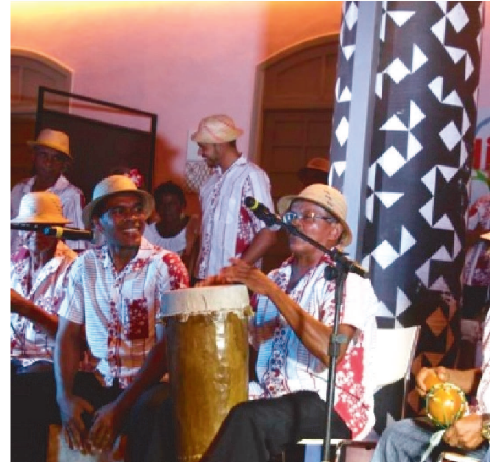
CURSO RESGATA A TRADICIONAL BRINCADEIRA POPULAR.

O Centro Cultural Vale Maranhão realizará, nos dias 29 e 30 de setembro às 19h, a oficina virtual de Dança da Mangaba.