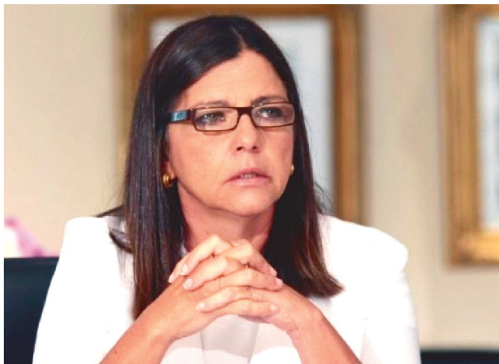
ROSEANA SARNEY CHEGOU A ANUNCIAR A SUA APOSENTADORIA DA POLÍTICA.

Para fortalecer a sua possível candidatura ao Congresso, a ex-governadora foi eleita por unanimidade no início de julho deste ano como presidente estadual do partido Movimento Democrático Brasileiro (MDB), no Maranhão. A convenção estadual foi reali-