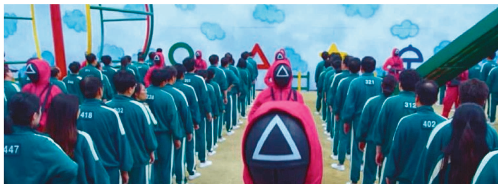
SÉRIE SUL-COREANA DE TERROR ESTREOU NA NETFLIX NESTE MÊS DE SETEMBRO

Ainda no primeiro episódio, vemos que os jogos não são tranquilos e, por mais que sejam perturbadores, chocam e encantam ao mesmo tempo. A série usa brincadeiras infantis, transformando-as em competições que valem a riqueza ou a sua própria vida.