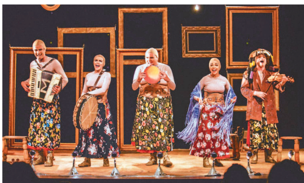
OS ESPETÁCULOS SERÃO TRANSMITIDOS PARA TODO O BRASIL PELO YOUTUBE

Além das 17 transmissões ao vivo pelo canal do Youtube Sesc Brasil, o Palco Giratório contemplará 190 horas de oficinas, 97 debates (pensamentos giratórios) e 132 intercâmbios, todos em modo remoto e relacionados aos 17 espetáculos do circuito nacional. Serão disponibilizadas também 131 apresentações de grupos re-