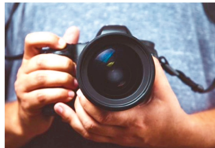
INSCRIÇÕES DO CONCURSO SEGUEM ATÉ 15 DE JANEIRO DE 2021

A Secretaria de Estado da Cultura (Secma) divulgou o resultado preliminar de habilitados em mais dois editais lançados na segunda fase da Lei Aldir Blanc no Maranhão (Lei de Emergência Cultural 14.017/20).