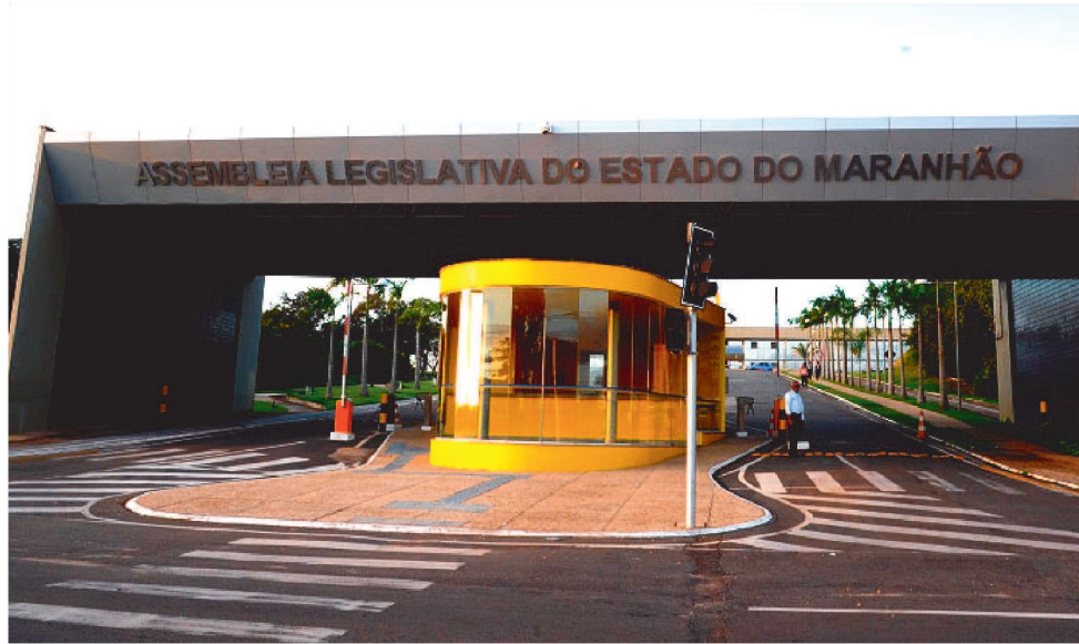
ÚLTIMOS DETALHES DO CONCURSO DEVEM SER DISCUTIDOS EM NOVEMBRO.

Pressionada pelo SINDSALEM, pelo Ministério Público, pelos autores da ação, por representantes de outros sindicatos e por mais de 350 concurretes e concurreiras, que lotaram a Audiência, a ALEMA garantiu que a banca organizadora do certame será contratada até o fim de outubro, via processo licitatório que já está em andamento.