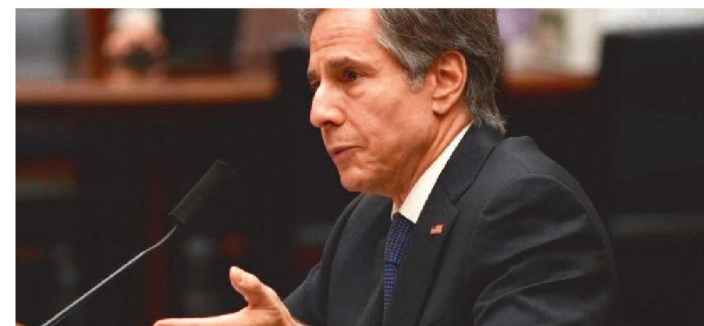
BLINKEN FALOU COM FUNCIONÁRIOS DA COLÔMBIA E ESPANHA