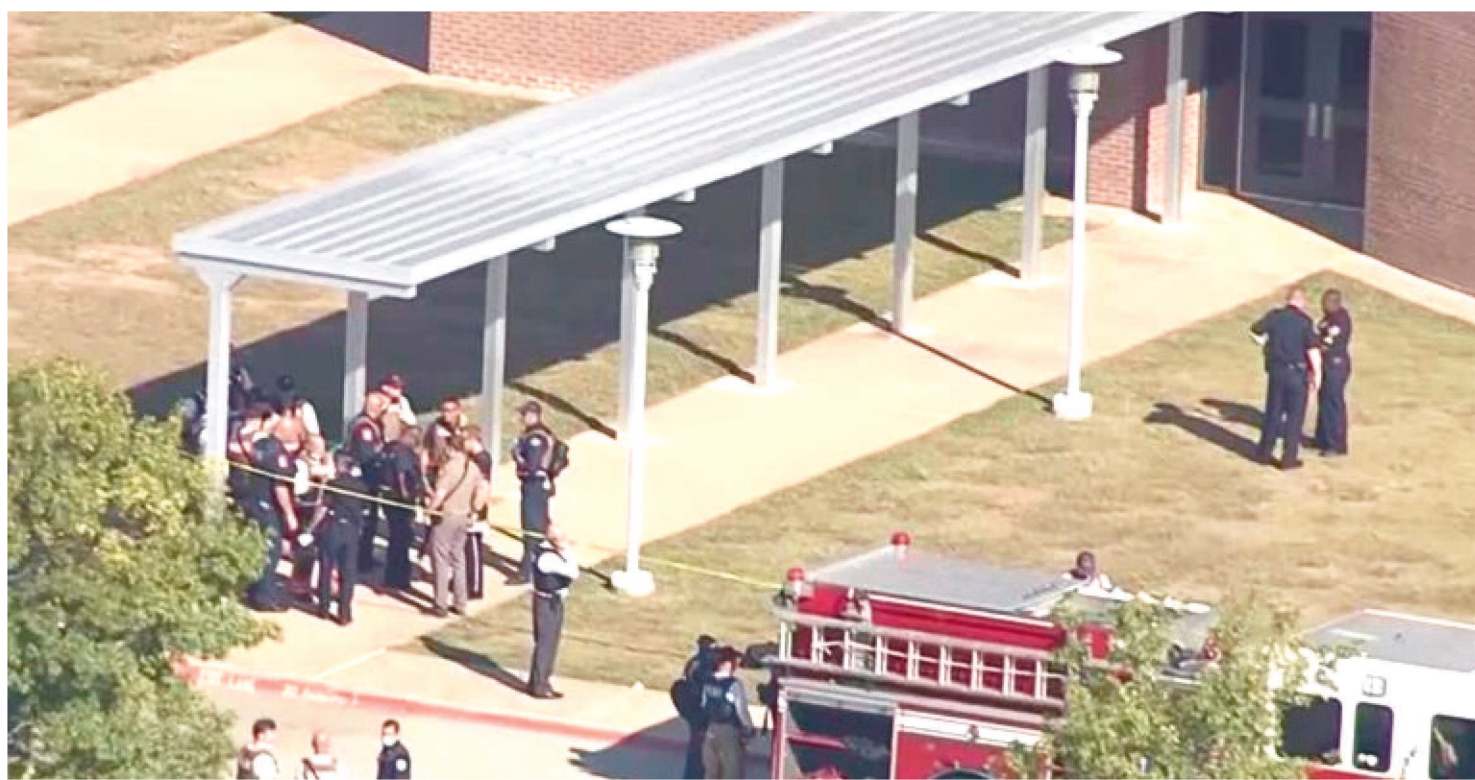
TRÊS ALUNOS E UM FUNCIONÁRIO FORAM BALEADOS, SEGUNDO INFORMAÇÕES PASSADAS PELA POLÍCIA À IMPRENSA LOCAL

Quatro pessoas ficaram feridas após um ataque à Timberview High School na cidade de Arlington, Texas, Estados Unidos. Três alunos e um funcionário foram baleados nesta quarta-feira (6/5), segundo informações passadas pela polícia à imprensa local. Os investigadores acreditam que este incidente começou com uma briga.