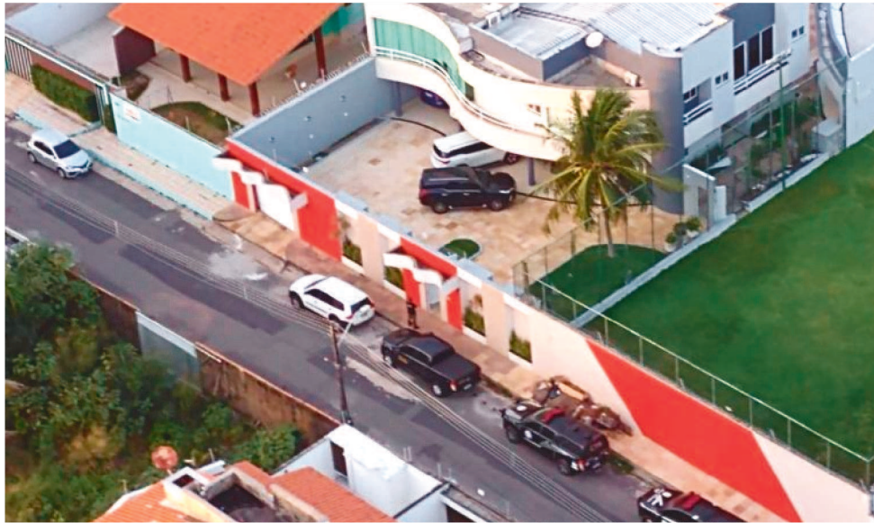
OPERAÇÃO FOI REALIZADA EM VÁRIOS ENDEREÇOS E CIDADES DO MARANHÃO E CEARÁ.

A Operação Maranhão Nostrum é resultado do Procedimento Investigatório Criminal nº 011660-750/2018, instaurado no âmbito do GAECO em 2018, para apurar possíveis fraudes