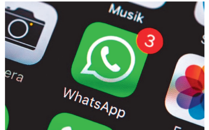
NA ÚLTIMA SEGUNDA HOUVE UM APAGÃO NAS PLATAFORMAS