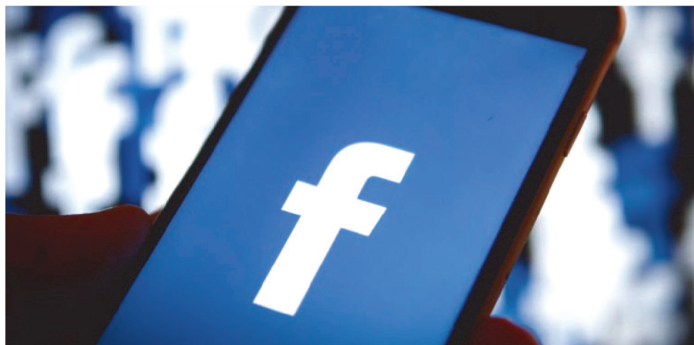
O "APAGÃO" DEIXOU SEM SERVIÇO MILHÕES DE PESSOAS EM TODO O PLANETA.

A queda do Facebook e das demais aplicações levou o Telegram, um serviço de mensagens instantâneas (como o WhatsApp), a receber mais de 70 milhões de novas adesões, informou o fundador da rede, o russo Pavel