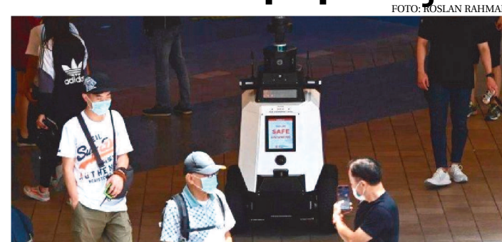
ATIVISTAS DENUNCIAM QUE A PRIVACIDADE FOI SACRIFICADA

Singapura fez testes robôs de patrulha que lançam advertências a pessoas envolvidas em "comportamento social indesejável", aumentando o arsenal tecnológico de vigilância nesta cidade-Estado sob estreito controle. Do grande número de câmeras CCTV (Circuito Fechado de Televisão) aos postes de luz equipados com tecnologia de reconhecimento facial atualmente em teste, Singapura viu uma explosão de ferramentas para vigiar seus habitantes.