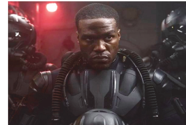
MATRIX RESURRECTIONS ESTREIA NO DIA 22 DE DEZEMBRO.

O ator Yahya Abdul-Mateen II confirmou que ele vai viver uma nova versão de Morpheus em The Matrix Resurrections, confirmando a suspeita de toda a internet desde a divulgação do primeiro trailer. Em entrevista à revista Entertainment Weekly, ele comentou sobre o peso de substituir Laurence Fishburne e deixou claro que seu papel é uma iteração completamente diferente do personagem.