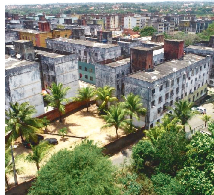
A INTERVENÇÃO SERÁ NOS 58 BLOCOS DO RESIDENCIAL.

O Governo do Estado, por meio da Secretaria das Cidades e Desenvolvimento Urbano (Secid) iniciará, na próxima segunda-feira (18), as obras de revitalização do Conjunto Residencial Ipem Bequimão, em São Luís.