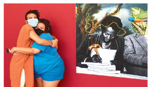
Protagonista importante da histó-