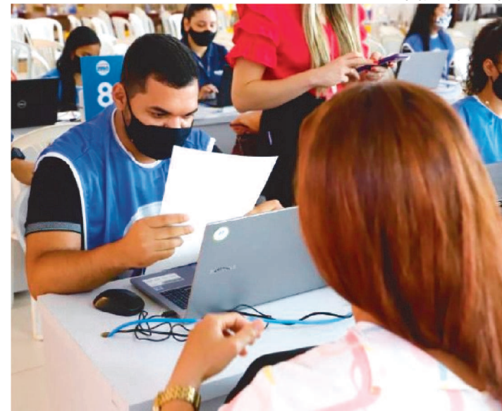
AÇÕES OCORRERÃO NO VIVA/PROCON DO IMPERIAL SHOPPING

Consumidores de Imperatriz ganharam mais dias para negociar débitos pelo Programa Dívida Zero, que será estendido até o dia 22 de outubro.