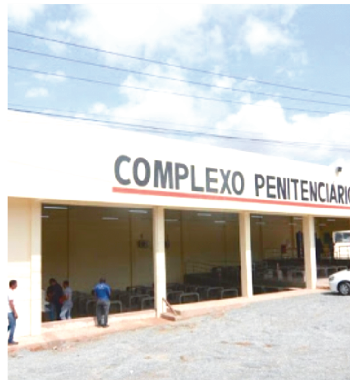
SOMENTE NA ÚLTIMA SAIDINHA, 28 PRESOS NÃO RETORNARAM

113 presos são considerados foragidos neste ano. Dos 2.606 detentos beneficiados com a saída temporária em 2021, 113 não retornaram aos seus respectivos presídios onde estavam custodiados.