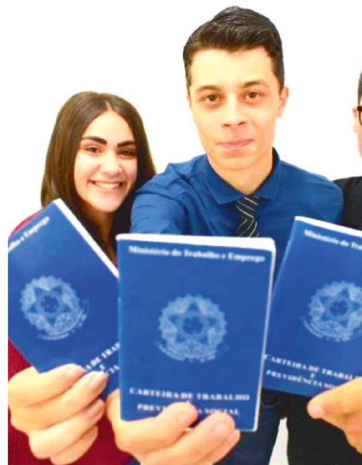
O EDITAL DA SEDUC OFERTA 5.120 VAGAS PARA CURSOS

A Secretaria Estadual de Educação (Seduc) lançou edital com mais de 5 mil vagas de cursos profissionalizantes que serão ofertados em parceria com instituições religiosas.