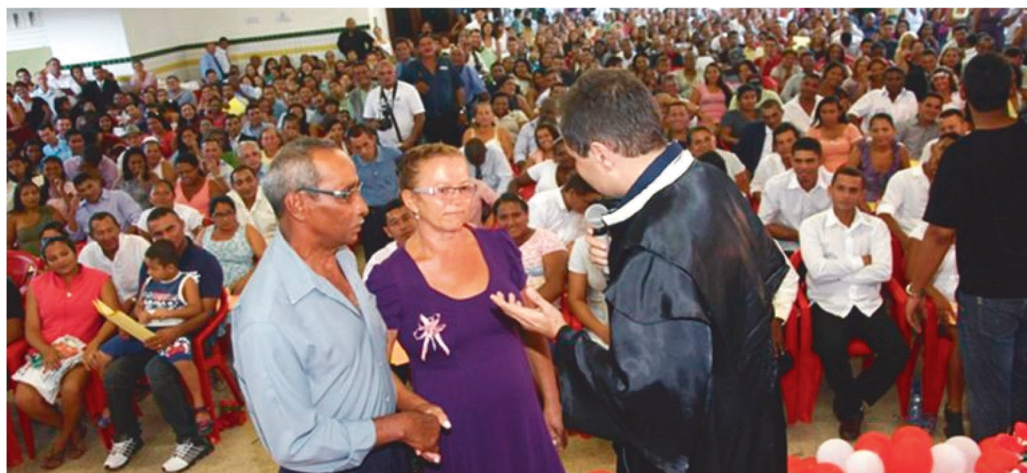
AS INSCRIÇÕES DOS CASAIS INTERESSADOS PODERÃO SER REALIZADAS A PARTIR DESTA QUINTA-FEIRA (21), ATÉ O DIA 5 DE NOVEMBRO

A 4ª Vara da Família de São Luís realizará uma edição do Projeto “Casamentos Comunitários”, para 63 casais, no dia 5 de dezembro de 2021, às 9h30, na Igreja Adventista do Sétimo Dia, no Bairro de Cidade Operária (Avenida Este 103, 334-378 – Cidade Operária)