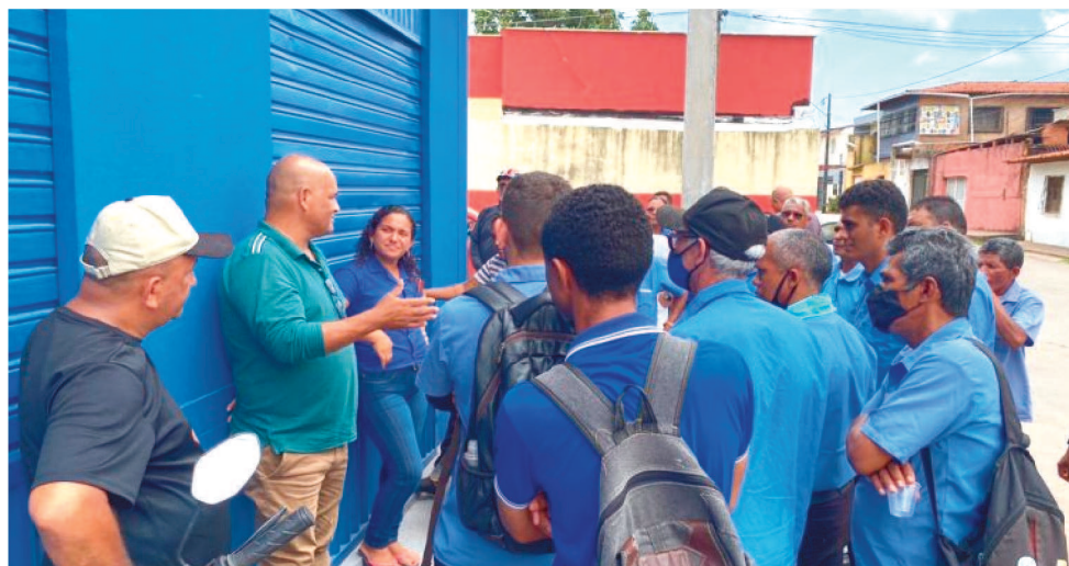
O SINDICATO DOS RODOVIÁRIOS MEDIA TODAS AS NEGOCIAÇÕES COM EMPRESÁRIOS

viários da empresa Matos também cruzaram os braços e realizaram uma paralisação. Após cinco dias de negociações, os rodoviários voltaram ao trabalho.