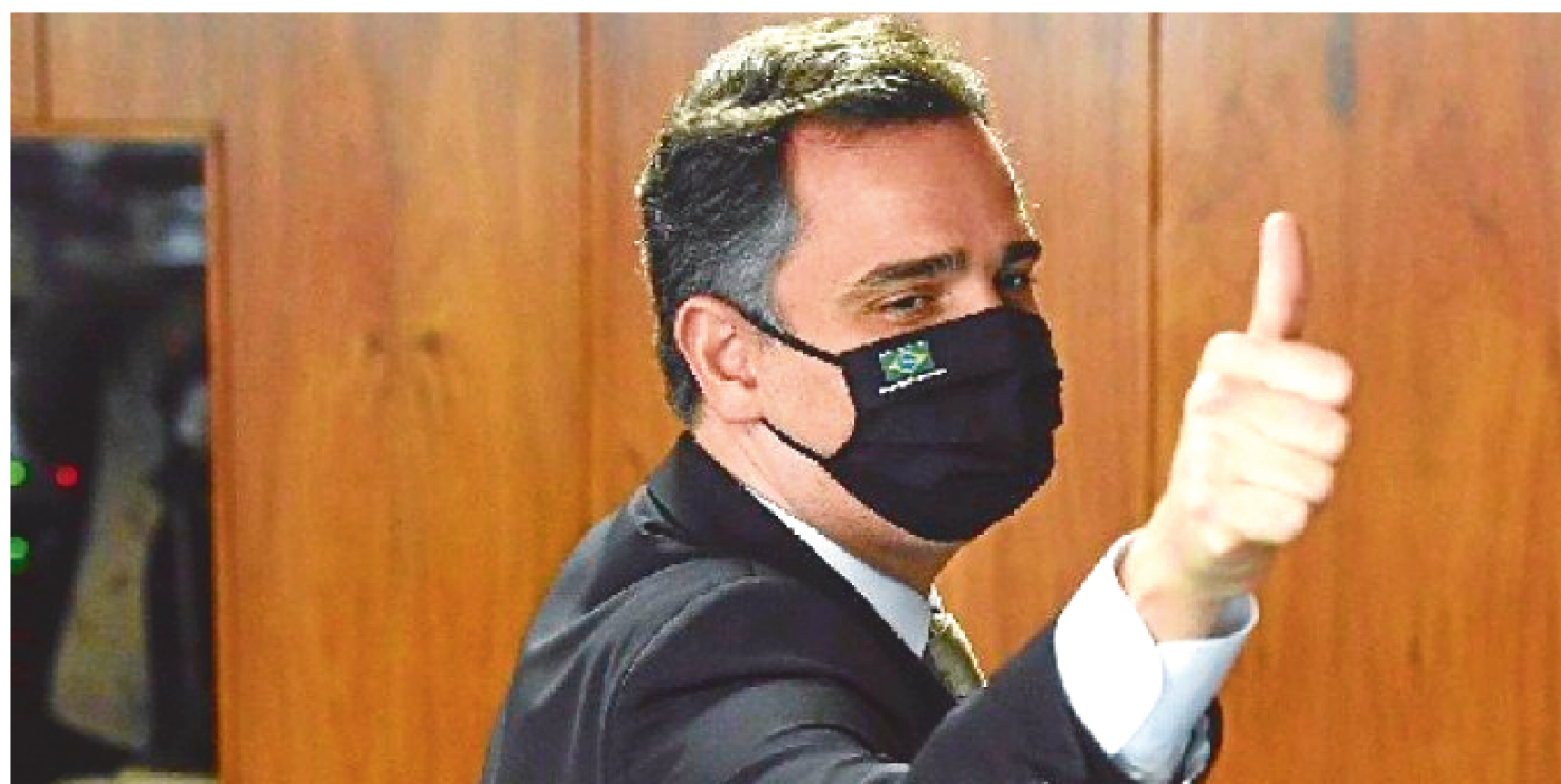
RODRIGO PACHECO DEIXOU O DEM PARA SE FILIAR AO PSD “ESTOU MUITO FELIZ COM A VINDA AO PSD, COM ESSE CONVITE QUE RECEBI”

O presidente do Senado, Rodrigo Pacheco, foi confirmado pelo presidente nacional do PSD, Gilberto Kassab, como o candidato da sigla para a corrida presidencial nas eleições de 2022. O anúncio ocorreu durante o encontro regional da legenda no Rio de Janeiro neste sábado (23/10). Em clima de comemoração, o encontro contou com show do sambista Dudu Nobre e da bateria da Acadêmicos da Rocinha.