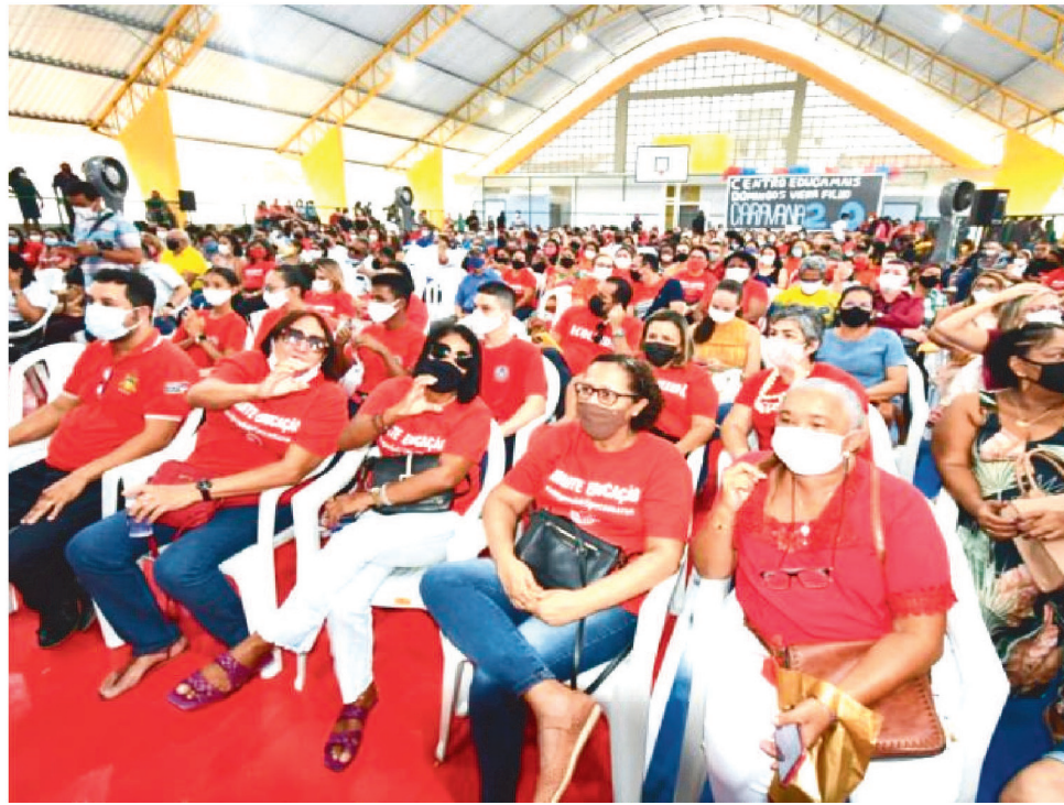
15.925 EDUCADORES DA SECRETARIA DE EDUCAÇÃO FORAM BENEFICIADOS

“As progressões já estarão implementadas nos contracheques a partir do mês de novembro, juntamente com o vencimento do mês. Esta é a maior concessão de progressões da história, dada à categoria, alcançando praticamente 16 mil professores. Somente no Governo Flávio Dino, já somos aproximadamente 40 mil pro-