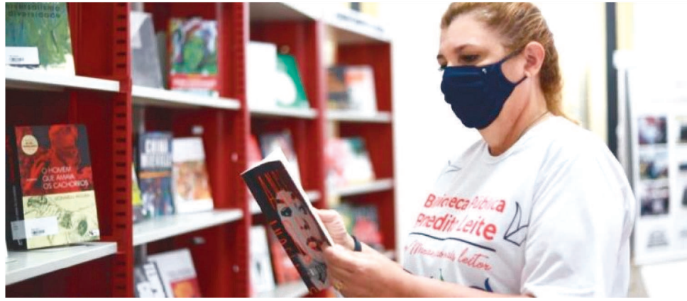
RENOVAÇÃO FOI INVESTIMENTO INÉDITO PARA A BIBLIOTECA, DISSE DIRETORA DA BPBL

Além dessas aquisições, a BPBL fechará a compra de mais 230 títulos, no