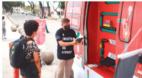
Também com apoio da BPBL, che-

gou a São Luís o projeto móvel A incrível Máquina de Livros. Instalada na porta da BPBL, a iniciativa percorre o país incentivando a leitura por meio da “transformação” de livros usados em obras novas.